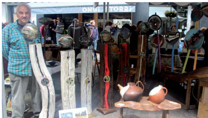
Herriko eta kanpoko 25 artisauk hartuko dabe parte bixarko azokan.

Bixarko goiza eta eguerdi aldia hartuko dau, urtero lez, artisau eta basarritarren azokiak. 10:00etarako postu guztiak ipiñitta egongo dira Toribio Etxebarria kalian