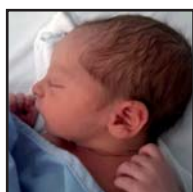
Ongi etorri, POL, maiatzaren 5etik gure artian zagoz-en-eta. Famelixa guztiaren partetik.