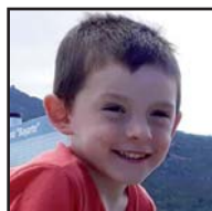
Zorionak, PERU, hillaen 2xan 5 urte bete zenduaz-en-eta. Patxo pillua famelixa guztiaren partez. Asko maite zaittugu!!!