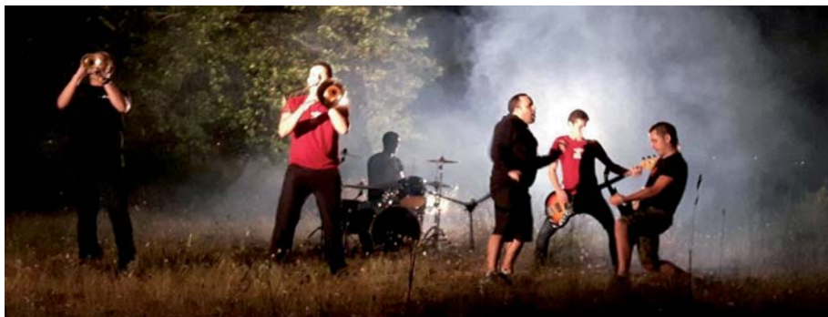
Cloverwind eta Egurra Ta Kitto taldiak joko dabe gaur gabian Mugi Panderoarekin. Behian, juan zan egueneko aurkezpena Deporren.

ta, bost pieza interpretatuko dittu. Eta 19:30xetatik kantu-afarixa hasi bittarteko tartian trikipoteua egingo da, Eibarko trikitilari gaztien eskutik. 21:30xetan hasiko da afari berezixa karpan: “Alkarte gastronomikuen eskutik bertoko basarrixetako produktuekin presatutako afarixa izango da. 11:00xetatik aurrera taldekako kantuak abestuko dira eta goizaldeko 01:00xetatik aurrera erromerixaren ordua izango da” .