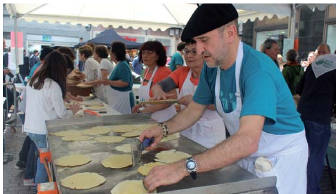
Talo-postuan Gure Esku Dago ekimenakuak egingo dabe biharra.