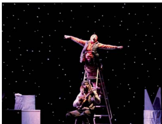
"Linbo planeta" eguenean eskainiko dute.