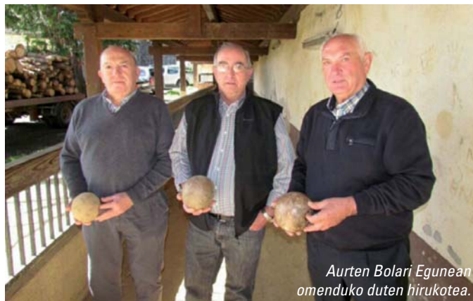
Aurten Bolari Egunean omenduko duten hirukotea.

Gipuzkoako Txapelketaren amaieran, ohikoa denez, Bola-