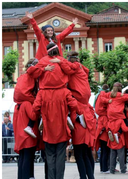
Kezkako dantzarixak Iruñeko Dugunakoekin izango dira Euskal Jaiko Dantza Jaialdixan.

Arratsaldeko 19:00etan Eibarko Musika Bandak Euskal Jaiko kontzertua eskinduko dau Untzagan. Oin dala hiru urte hasi eta errekuperatu dan tradiziñuari jarraitu-