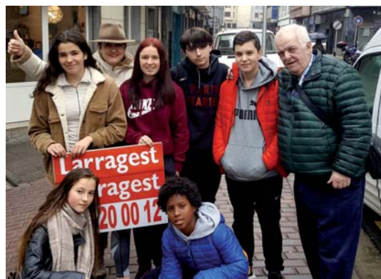
Kalamuako ordezkariak Andorrarako bidea hartu aurretik.