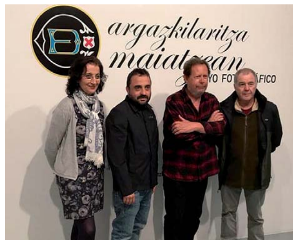
Aurreko barixakuan zabaldu zituzten erakusketak.