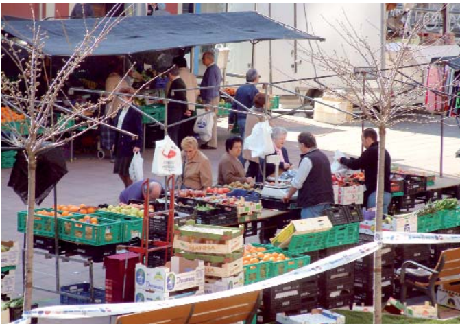
Urkizuko beheko parkian 15 postu dagoz, janarixenak ixa danak.

Aurretik aprobria egiñ eben ea postu guztiendako tokirik zeguan Errebalen, "burdiñazko estrukturak eta erabillitta"; hor ikusi zeben danak sartzen zirala. 33 postu dagoz guztira