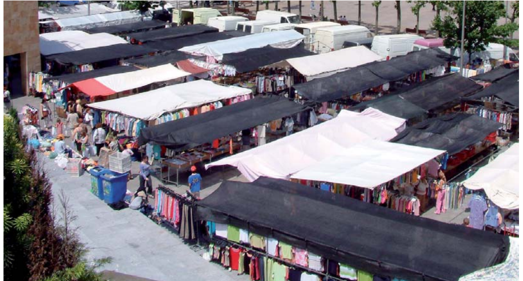
Txikitora juan aurretik Untzagan egon zan merkadillua, baiña arazuak sortzen zittuan zirkulaziñuan.

Gurian astiaren erdira ailegau garala aditzera emoten deskun merkadilluak eguna ez, baiña kokapena aldatuko dau hamendik hillabete batera. Postuetakuak jakiñaren gaiñian dagoz eta Txikitoko azken eguaztenian egingo dan zozketaren zaiñ, jakitteko Errebalian nun izango daben kokapena. Errebal ingurua indartu nahi izan dau Udalak neurri horrekian eta, Urkizuko postuekin (hor parkian jarraituko dabe) eta Rialtoko Merkatu Plazarekin lotura bat egittia. Errebaleko aparkalekua, bestalde, martitzen gabetan kendu egingo dabe, gero eguaztenetan, 15.00etan, barriro zabaltzeko.