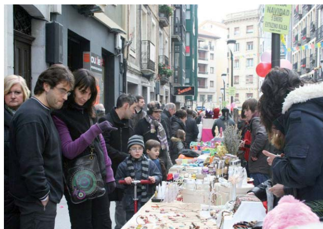
Geltoki Market-ak bost orduko iraupena izango dau. LEIRE ITURBE

Gabonetan lehelengoz egindako azokiak euki eban harrera onarekin animauta, Zona 10 alkartekuak azokia antolatu dabe atzera be: bixar Geltoki Market 10.30xetatik 15.30xetara egongo da martxan Estaziño kalia (trafikuaendako itxiko dabe), 100 bat posturekin. Aurrekuan lez, bestiak beste bigarren eskuko azokia, artisautza, Lambretta motorren konzentraziñua, janari-billetia, futbolin txapelketia, ludotekia, bertsolarixak balkoietan (12.00xetan, 13.00ian eta 14.00xetan), break dance erakustaldixa, photocall-a eta beste hainbat egingo dittue.