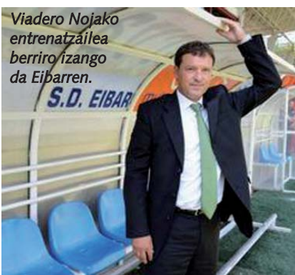
Viadero Nojako entrenatzailea berriro izango da Eibarren.

Aurreko domekan, azken minutuan eta eztabaidarako penaltiarekin, Teruelen galdutako partidua larriratu egin du Gaizka Garitanoren taldearen egoera. Eibar KE behartuta dago lehenbailehen azken asteko dinamikarekin apurtzera, berandu baino lehen, Barakaldo 5. sailkatua eibartarrendandik bi puntura kokatu baita sailkapenean. Ipuruako neurketa 17.00etan hasiko da.