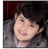
Zorionak, AIORA, astelehenian lau urte egin zenduaz-en-eta. Muxu haundi bat aitaxo, amatxo eta Oihenarten partez.