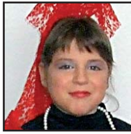
Zorionak, NAIA, hillaren 5ian zortzi urte bete zenduaz-en-eta. Patxo haundi bat aitaxo, amatxo eta Jonen partez.