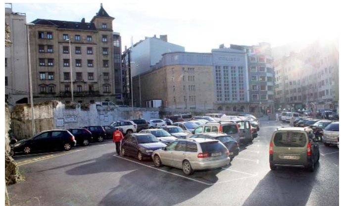
Errebalen tokixa izango da guztiendako 33 postuendako.

Toki aldaketia ez dabe denarixak edo merkadilloko saltzailliak eskatu, orokorrian pozik dagoz-eta Txikiton: “Kanbixatzekotan, aukeran Untzagan nahixago”. Baiña ez detse lagatzen, lehen be traba larregi egitten zebelako: autobus geltokixa, trafiko arazuak... Edo-