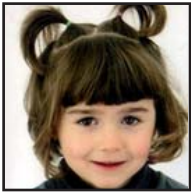
Zorionak, ANE, Arritokieta, hillaren 6xan hiru urte egin zenduaz-en-eta. Etxekuen partez.

Zure senide edo lagunen bat zoriontzeko aukera ezin hobea eskaintzen dizugu. Argazki arruntaren prezioa 4 eurokoa izango da; argazki bikoitzarena, 8 euro (...eta kitto!ko bazkideentzat %20ko deskontua). Argazkia eta testua eguaztena aurretik egon beharko da ...eta kitto!-n.