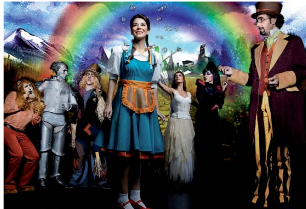
Istorio ezagunari buruzko ikuskizun musikala sortu dute.

Apirilaren 13an ikuskizun musikala hartuko du Coliseoak 17.00etatik aurrera: Lyman Frank Baum idazlearen "El Mago de Oz" istorio ezagun eta arrakastatsuari omenaldia egiteko sortu zuten musikala Mundiartistak taldekoek eta lau urteko tartean 800 emanalditik gora eskaini dituzte hamaika herritan. Coliseo antzokiko taula gainean musikari jarraituta antzetzuko duten lana familia osoarentzat pentsatuta dago eta protagonisten berbetan, "fantasiako mundu batean murgiltzeko gonbitea da, magian sinesten duten haurrei eta haurrengan sinesten duten hel-