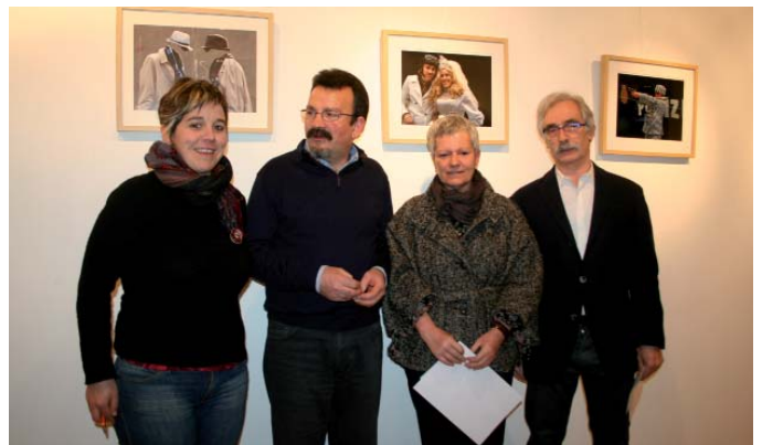
Sari banaketa ekitaldiko irudia.