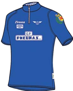
UDABERRI SARIA martxoak 3

TALDEKAKO SAILKAPENA: Soraluze, S. Coop. / DEBABARRENAKO ONENA: Goritz Hornikuntzak