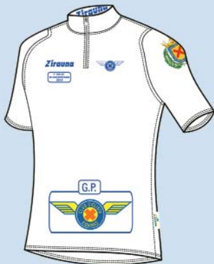
23 URTETIK AZPIKO ONENA