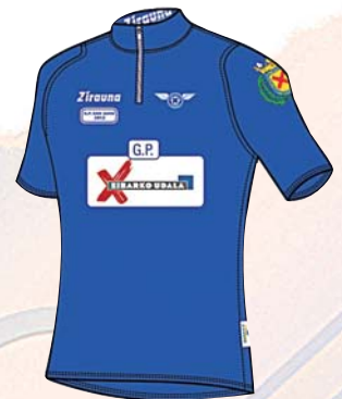
SAN JUAN SARIA ekainak 2