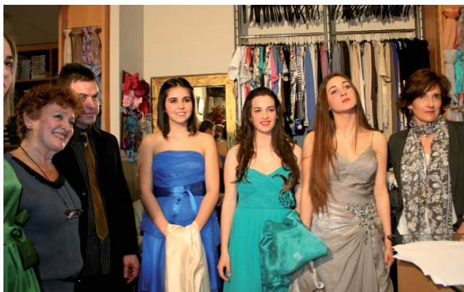
Valenciagako jantzixeri laguntzen Mabeke zapatak eruan zittuen.