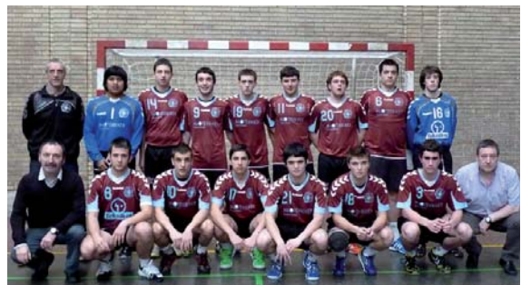
Jubenilen mailako Espainiako txapelketarako azken fasean parte hartu zuen taldea.

Maila ona eman zuten gure herriko ordezkariak Gasteizen jokaturako azken fase horretan. Hala ere, Irungo Bidasoarekin 22na berdindu eta gero, 21-25 galdu zuten Zarautzekin eta 26-28 bertako Corazonistekin. Ia aurkari guztiak urtebete nagusiagoak izan arren, eibartarrek maila bikaina eman dute euren lehenengo urtean.