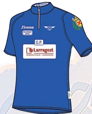
OTXOA OROITZARREA apirilak 21