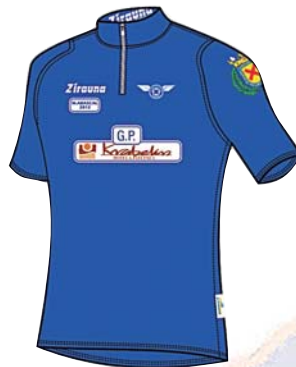
ABASCAL OROITZARREA martxoak 17