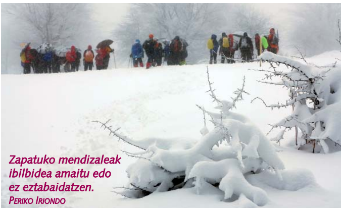
Zapatuko mendizaleak ibilbidea amaitu edo ez eztabaidatzen. PERIKO IRIONDO

Aipatutako bi txirrindulariez gain, Etxabe anaiek ere lan ona egin zuten Debabarrenakoen artean. Bihar Zornotzan izango dira eta etzirako zalan-tza dute, Tour de Lot-et-Garonnen edo Berriatuan parte hartzeko.