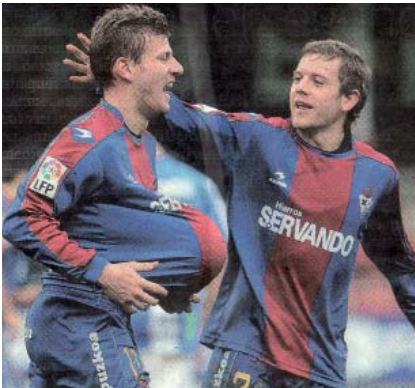
Gol gutxi, baina erabakigarriak sartu dituzte azken aldian.