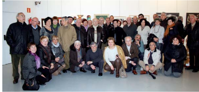
40 bat bazkideren orotariko lanak ikusteko aukera dago. LEIRE ITURBE

Aurreko barixakuan inauguratu zuten Portalean Eibarko Artisten Elkartekoaren erakusketa. Hilaren 28ra bitartean elkarteko 40 bat bazkideren orotariko artelanak ikusteko aukera izango da, martitzenetik domekara 18.30etatik 20.30etara.