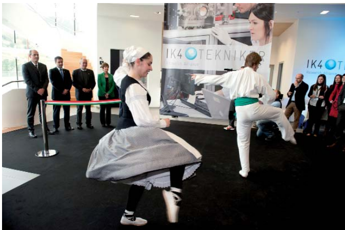
Inauguraziño-ekitaldixan hainbat agintari izan ziran.