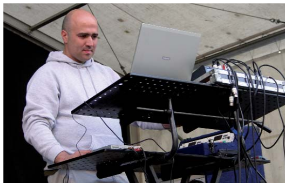
Arno DJ-ak girtuko dau Errebalgo jaialdixa. LEIRE ITURBE

arabera hiru mailla bereiziko dittue, 4 urtera arte, 4-6 urte bittartekuak eta 6-8 urte bittartekuak); 12.00etan ginkarnari ekingo detse (kaskara-batzia, zaku-lasterketia...); eta hórrekin amaittuta, 13.00ian Sakaren zezentxo eta ponixak ailllegauko dira. Hórretxek girtzen Arno DJ-k jardungo dau, photocall-a be egongo da eta graffitilarixak hormak margotzen ibilliko dira. Joko eta bestelakuetan parte hartzen dabenendako domiña eta garaikurrak banatuko dittue.