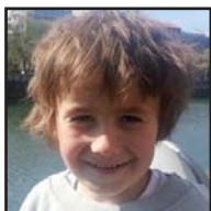
Zorionak, PEIO, hillaen 4an zazpi urte egin zenduaz-eta. Zelako pijama festa eta merendolia! Patxo haundixak, kokodriloi!