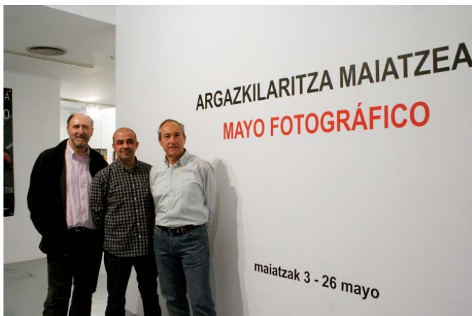
Portalean erakusketa zabaldu duten hiru argazkilariak. LEIRE ITURBE