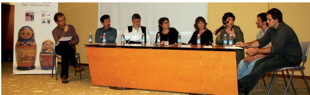
Hizlari guztiak batu zittuan mahainguruak agurtu eban mintegixa. KOLDO MITXELENA

Ikerketia doktore-tesirako oiñarria be izan da eta gaixa oso sakonian landu dau Kasaresek. Eta biharrian jardun daben bittartian, transmisioña aztertze-