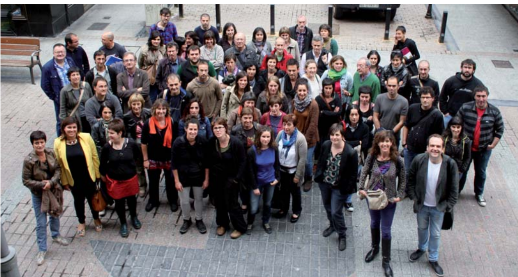
Transmisiñuaren gaixak interes haundixa sortzen dau euskeriaren inguruan diharduenen artian. SILBIA H.

Nahiko begibistakuak izan leikiazen ondorixo nagusixak hórretxek izanda, eskolako erabilleriari lotutako aldagai nagusixen zerrenda luzian, bestiak beste, etxian erabiltzen dan hizkuntza, euskeria gustokua daken ala ez, euskeraz egitteko daken erreztasuna, aisialdixa, herrixaren euskalduntze mailla, mailla ekonomikua, irakaslien erabilleria eta gurasuen jatorrixa dagoz. Eta aittatutakuen artian "aparteko garrantzixa" daka antolatutako aisialdixak, Suberbiolak esandakuaren arabera: "Bederatzi edo hamar urterekin eskoliak eremu 'babestua' sortu