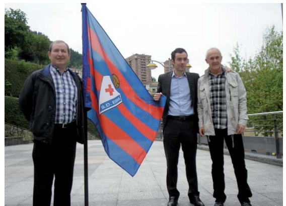
Historiako Hamaikako Ideala ekimena aurkeztu zuten martitzenean, klubaren 75. urteurrenari begira.

Azken jardunaldiko emaitzek (eta epaileek zeresan handia izan dute horretan: Alavesen aldeko eta Eibarren aurkako penaltiak tarteko) asko zaildu dute Eibarrek 2. B mailako bigarren multzoko liderra izatea. Jardunaldi bi falta dira liga amaitzeko eta eibartarrak partidu biak irabazi beharko dituzte eta gasteiztarrek biak galdu sailkapena irauli eta lehenengo postuan amaitzeko. Domekan Gimnastica Torrelavega hartuko du Ipuruan Garitanoren taldeak 18.00etatik aurrera eta, garaipen horrekin behintzat sailkapeneko bigarren postua segurtatuko lukete.