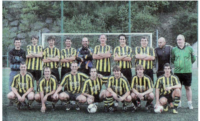
Txokok penaltietan nagusitu zitzaion Ermuko Boavistari.

3. Kiroljokoa bereganatu. Bihar eta etzi jokatuko dira, bestalde, Kopako final-zortzirenak, honako partiduekin: bihar, Caserio - Esmorga Akara, EzDok - Iruki, Garages Garcia.com - Tankemans eta Durango - Koskor; etzi, Txoko - Areto, Alkideba - Sporting eta Fontaenria Mujika - Azkena Kalton.