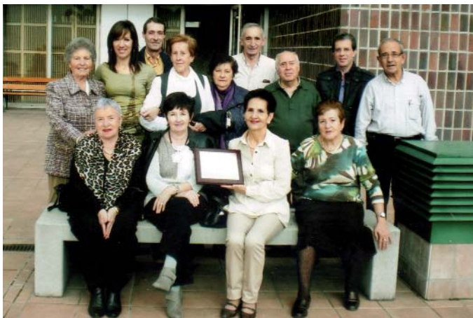
Eibarko Nagusilanen diharduten bolondresen talde bat.