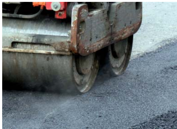
Herriko zazpi tokittan egingo dittue asfaltauak.

baiño ez dago eta, horregaittik, oin toki batzuk konponduko dittue eta gaiñontzekuak datorren urterako lagatzia erabagi dabe. Aurten konponduko dittuenak hónek dira: Tiburtzio Anituatik Otaola hiribideraiñoko tartia, Ubitxa kaliaren ostia, Jardíñeta (10. zenbakittik 12.era doian tartia), San Juan (9tik 11ra), Errebal, Bittor Sarasketa (12tik 14ra) eta Barrena (8tik 38ra).