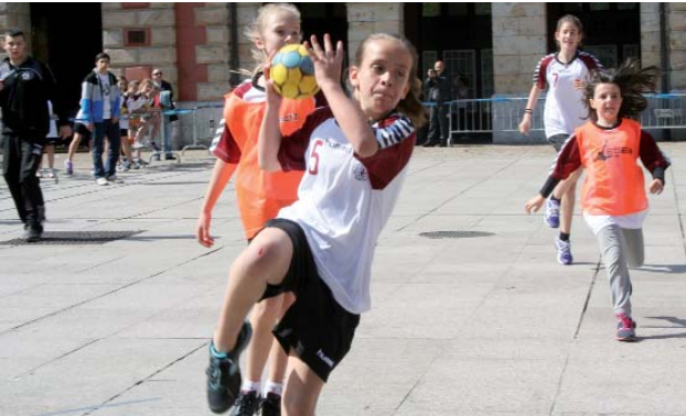
Alebin mailako partidua jokatu ziren. LEIRE ITURBE

Eibar eskubaloiak urteroko jaia ospatu zuen Untzagan , alebin mailako neska-mutikoen partiduekin eta musika saioekin. Tartean