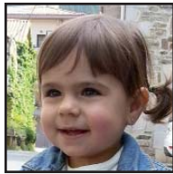
Zorionak, bitxito NARA, martitzenian bi urte egin zenduaz-eta. Muxu pilluak ama txo eta aitaxoren partez.