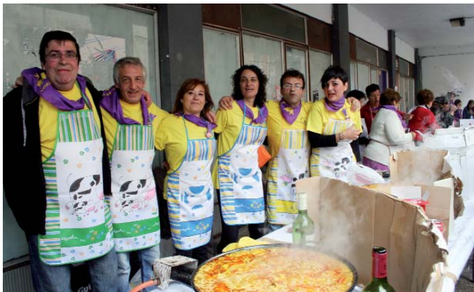
Paella lehiaketia urtero bezain arrakastatsua izan zan. LEIRE ITURBE