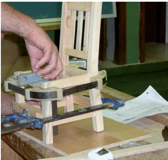
Egur-zurgintzaren fabrikazioaren ingurukoak ikas daitezke.

Lanbide hastapenerako zentroa 1989. urtean sortu zen Lanbide Hastapena izenarekin; orduan Ikasbat-ek, Debegesari atxikitako erakundeak kudeatzen zuen. 1995. urtean, egoitza Elgoibarren izan arren Eibarko Udalaren eskuetara pasatu zen eta 2011. urtean Eibarrera etorri zen, behin betiko gure herrian geratzeko. Lehenago klase teorikoak Ondamendiko (Ermua) haurtzaindegi zaharrea ematen ziren eta klase praktikoak Azitainen, hiltegi zaharrena instalazioetan. Aurrerantzean, baina, jarduera osoa Azitainen eskainiko dute.