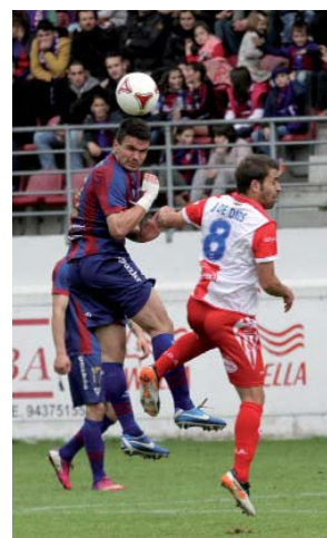
Partidua ETB1-ek eskainiko du zuzenean.

Eibar KE-k aurrerapausu handia eman zuen Carlos Tartieren Oviedori 1-2 irabazita. Bihar, 19.30etan, Ipuruan jokatu den itzulerako partidurako tarte dute eibartarrek emaitzarekin jokatzeko; hala ere, klubean ez dute "konfiantza larregirik nahi". Sarrera guztiak salduta, Ipurua lepo beteko da eta segurua da Oviedotik ere zaletu mordoa etorriko dela. Eskozia La Bravak hainbat ekitaldi antolatu ditu partidua girotzeko: 12-00etan, herri-poteoa, Koskoren hasita; 15.00etan, bazkaria Eibar Rugby Taldearen karpan; 18.00etan, peñen kontzentrazioa Untzagan eta kalejira Ipuruaraino; 18.45etan, Ipuruan sartu animatzen hasteko; eta 19.25etan, konfeti jaurtiketa.