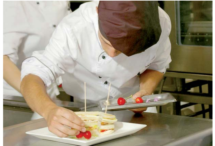
Sukaldaritza eta zerbitzari-lana espezialitatea aukeratu daiteke.

Arduradunek diotenari jarraituta, "matrikula doan da eta taldeak txikiak. Ikasleei orientazio pertsonalizatua eskaintzen zaie, alor pertsonalean, bai prestakuntzaren inguruan bai lan alorraren inguruan. Bestalde, ikasturtean zehar izaera ludikoko eta kultureko hainbat jarduera antolatzen dira eskolaz kanpo".