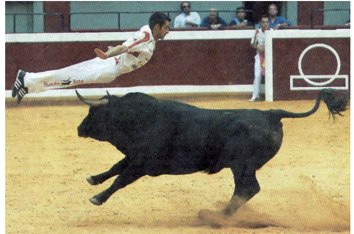
Errekortadoreen jaialdia izango da domekan, 18.00etan hasita. Marques de Sakaren zezenak emango dute jokoa.

Domekan berriz ere goizetik ekingo zaie jardueri: 10.30etan Eibarko IV txikien duatloia