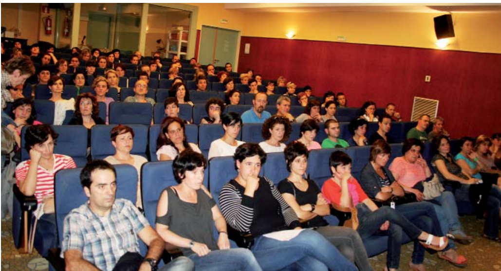
Gaixak kezka eta interes haundixa piztu dau. Areto nagusiko ehun aulkixak bete ziran martitzenian.

LOMCE edo Wert legia aurreproiektu modura onartu dabe Espaiñiako ministro kontseiluan eta oiñ, ekaiñian oso-