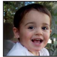
Zorionak, IXONE, bixar hiru urte egingo dozuz-en-eta. Millaka patxo potolo, etxekuen partez.