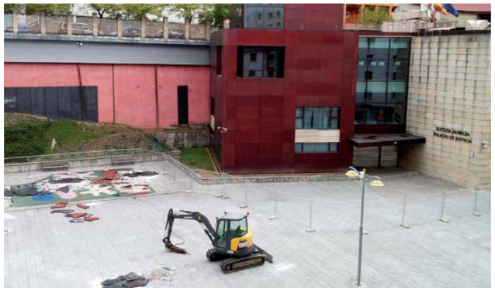
Abuztuaren amaieran hasi dittue Txaltxa Zelaiko lanak. SILBIA HERNANDEZ

Horrekin batera, abuztuaren amaiera aldian hasi dittue Txaltxa Zelaian, epaitegi aldame-nian estalitako parkia egitteko biharrak. Sasoi Eraikuntzak SL enpresiak 295.349 euroko aurrekontua eta sei hillebeteko epia eukiko dittu 410