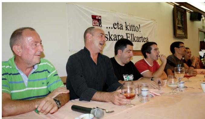
Betiko Lizasok eta Egañak lagun berriak izango dituzte. LEIRE ITURBE

dian plaza asko egiten diharduen Zubeldiaren debuta izango da Arraten.