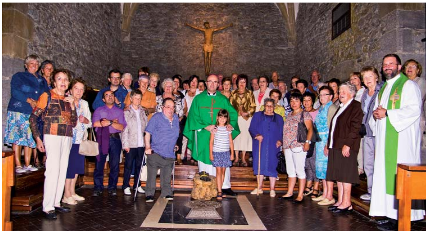
Munilla apezpikua lehelengo aldiz izan zan Azittaiñen aurreko domekan.