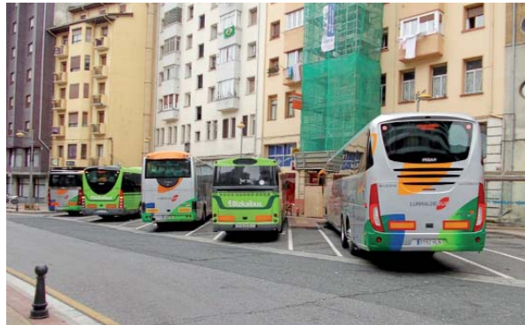
Neguko ordutegixa ekaiñaren 30a arte egongo da indarrarian.

Hillaren 1az geroztik neguko ordutegixa sartu da indarrarian. Pesako autobusak eskintzen dituen zerbitzu guztietan eta horri segiduko detse 2014ko ekaiñaren 30ra arte. Linea bakotxaren ordutegi zihetzak ikusteko interneten www.pesa.net helbidera jo leike edo, bestela, 902 101 210 bezeruaren arretarako telefono zenbakira deittu.