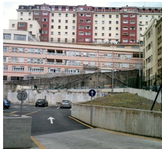
Errebalgo orubiak emon dau, bai, saltsia gure artian. Noizbaitten izango dau amaieria.

Urtero legez, udalak Eibarko ikasleri diru-laguntzak emongo detsez, ikasturte hasierian egin biharreko gastuekin laguntzeko asmuarekin. Umeak Eskolara eta Diru-Laguntzak ikasleri kanpaiñen barruan ikasle bakotzeko banatuko diran 60'10 euroak jaso ahal izateko eskaeriak Eibar Merkataritza Gune Irekiaren bu- legora (Untzaga Plaza, 7 behea 3; Artola jatetxe aldamenian) eruan biharko dira (epia urriaren 31n amaittuko da). Eskaeria zelan egiñ eta beste edozein zalan- tza argitzeko, barriz, Pegoran galdetu.