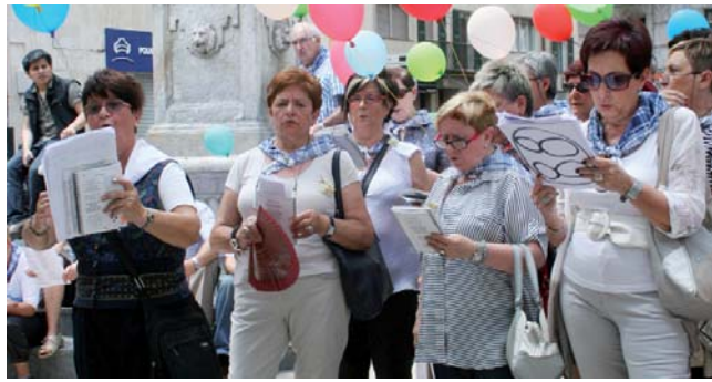
Euskeraz kantatzeko abesbatza berria sortu dute herrian. L. ITURBE

Euskal Herriko abestien errepertorioa berreskuratze-ko asmoz eta, batez ere, euskal kantuak indartzeko, talde berria osatu da gure herrian: Eibarko Kantu Zaleak du izena eta astelehenean, hilaren 9an, egingo du lehenengo bilera (eta baita lehenengo entsegua ere), arratsaldeko 19.30etan, San Andres parrokiako lokaletan. Kaleetan Kantuz taldean jardun dutenen artean osatu dute talde berri hori, "euskal abestien alde egiteko. Kaleetan Kantuzek bost urte egin ditu dagoeneko eta, euren oso pozik ibili bagara ere, euskal kantuen alde gehiago egin behar genuelakoan geunden". Federatu berri den abesbatzak atea