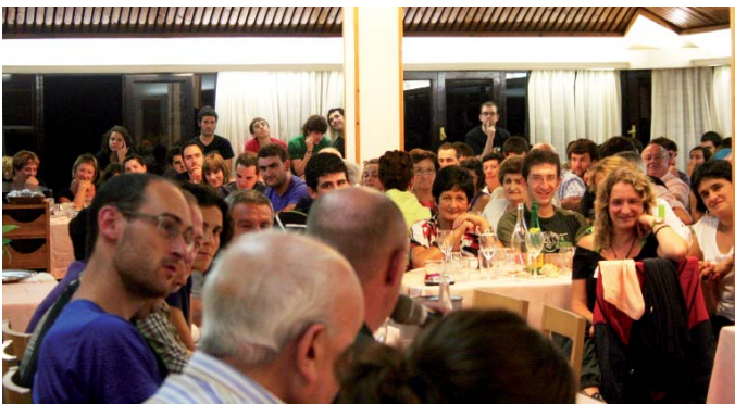
Jendeak asko gozatzen du afari ondorenarekin.