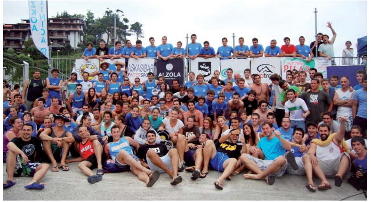
Mutrikuko torneoan parte hartu zutenak talde argazkian.