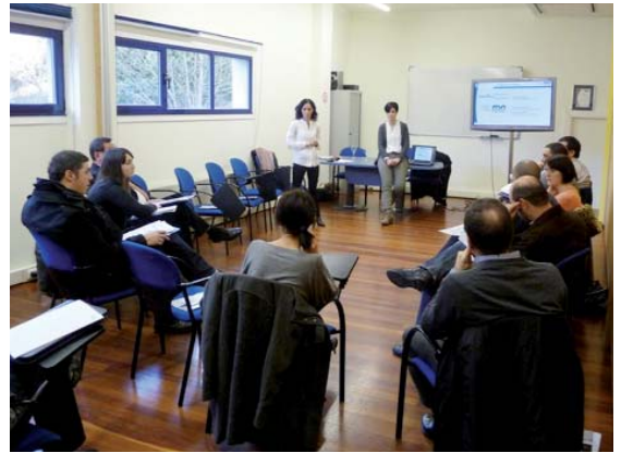
Sei enpresak hartu leikie parte trebakuntza saiuan.

Debegesak atzera be Ostiralak Debegesan programiari ekin detsa eta, horren barruan, Learn Startup proiektua abiarazi dabe, enpresen dibersifikaziñua sustatzeko asmoz. Garapen agentziak eta Mondragon Unibersidadiak alkarlanian sustatutako proiektu pilotuak, trebakuntza-jarduera baten bittartez, doan trebatzeko aukeria emongo detse parte hartzera animatzen diran enpresa txiki eta ertaiñeri (gehixen jota, seik hartu leikie parte). Trebakuntza programia lau orduko iraupena izango daben sei saiok osatuko dabe eta urtarillaren 31an hasiko da, 09.00etatik 13.00era, Debegesaren egoitzan (Azittaingo industrialdian) eta parte-hartza duan izango da. Informaziño gehixago www.debegesa.com webgunian, Ostiralak Debegesan atalian begiratu leike.