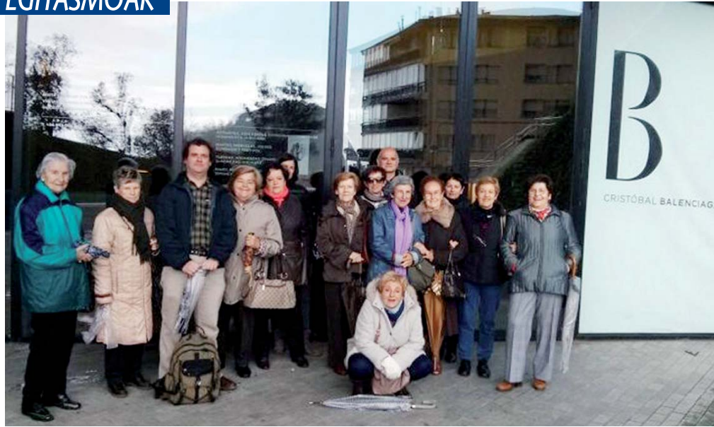
Berbetan-eko partaideak iaz Zumaiaiko Balenciaga Museora egindako bisitaldian.

Eibarren ez eze, Euskal Herria osoan geroz eta indar handiagoa hartzen ari den mugimendua da mintzapraktika egitasmoena; ia sei mila berbalagunek dihardute mintzapraktika taldeetan parte hartzen. Eraginkorra den seinale. Izan ere, berbalagunek behin eta berriro errepikatzen duten esaldia da, talde horiei esker gehiago erabiltzen dutela euskera, lotsa