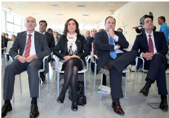
Goirizelaia eta Uriarte IK4-Teknikerreko ordezkariekin. SILBIA H.

ondare denean" hitzaldia emongo dabe Tximini Kolektibokuak.