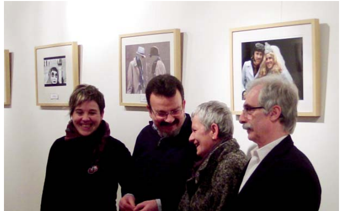
Azken Eguen Zuriko sari banaketaren ekitaldiko irudia.

Bestalde, aurten hamazazpigarrenez antolatu dute Eguen Zuri argazki lehiaketa. Argazkietarako gaia Aratostekak dira (ez dira zertan Eguen Zuri egunekoak edo Eibarko aratosteetan egindakoak izan) eta edozeinek har dezake parte, gehienez lau argazki aurkeztuta (koloretan nahiz zuri-beltzean), 40x50 zentimetroko passpartout-aren gainean (azken eguna martxoaren 4a izango da). Argazki onenak 160 euroko saria jasoko du, bigarrenak 100 eurokoa eta hirugarrenak 60 eurokoa.