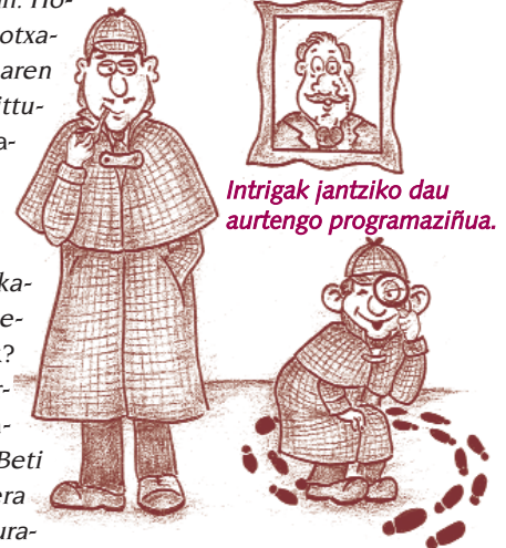
Intrigak jantziko dau aurtengo programaziñua.

ra eskulan eta jokuetan. Horretarako, baiña, baktaxaren ahalmen eta adinari arabera antolatzen dittugu mahaixak", diñue Lasuenek eta Santosek. Kurso hasierian eta amaierian urteeria be egitten dabe, "neskamutil eta euren amekin". Amekin bakarrik? Bai, amak diralako arduratu eta gehixen inplikatzan diranak. "Beti izan da holan. Olitera juaten gara, ikutu kulturala dakan txanguan, eta bestian Galdonako kanpiñera. Horkua ludiko-festibua izaten da, gin-