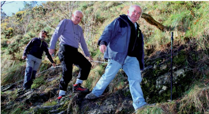
Deporrekoak Urkon ipinitako kateaz baliatzen.

kanaren bidea mendizaleentzat seguruago egiteko. "Pauso horretan dagoen labain egiteko arriskua saihestea" nahi izan dute horrela. Bestalde, 40 lagun inguru animatu ziren 2014ko lehenengo irteeran, Irisarritik Donibane Garaziraino eraman zien etapan, tartean Arradoi mendira igota. Oso giro ona izan zuten 17 bat kilometroko ibilbidean.