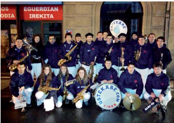
Eibarren sailkatzen direnek Orion izango dute hurrengo kanporaketa. LEIRE ITURBE

Ustekabe fanfarreak aurten Donostiako danborradan eskainitako saioa benetan arrakastatsua izan zen. Argazkian ikusten dituzuen musikari gazteek ordu txikitan eta euripean jardun zuten donostiarren jai egun handian, erdialdeko Antonio Bar konpainiakoeekin batera. Baina euren ahalegina ez zen alperrikakoa izan, emanaldiaren oihartzunak hurrengo egunean El Diario Vasco-ko azaleko protagonista izatera eraman zituen-eta.