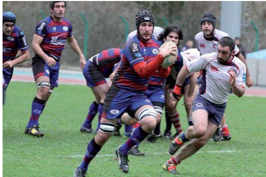
Eibartarrek jantzi berriak estreinatu zuten Unben Bilbao R.T.-ren aurka jokatutako neurketan.