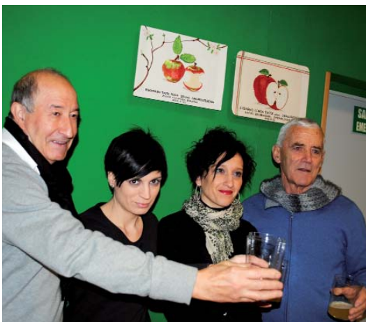
Gaur zabalduko dabe txotxa Irukin. SILBIA HERNANDEZ

Iruki sagardotegixan gaur egingo daben omenaldi-txotxak erantzun paregabia euki dau, 170 lagunek bertan afaltzeko izena emon eta gehixagorendako toki barik geratu dira-eta. Afaltzen hasi baiño lehen, berotzen juateko, herriko erdialdian trikitilarixak kalejiran ibilliko dira 19.00etatik aurrera. 20.00etan, barriz, sagardo dastaketia hasiko da sagardotegixan, Saizar sagardotegiko ordezkariaren eskutik. Afarixa 21.00ak aldera hasiko da eta, afalostian, aurtengo omenduak diran Trio Medianoche eta Voces y Cuerdas taldiak kantuan jardungo dabe.