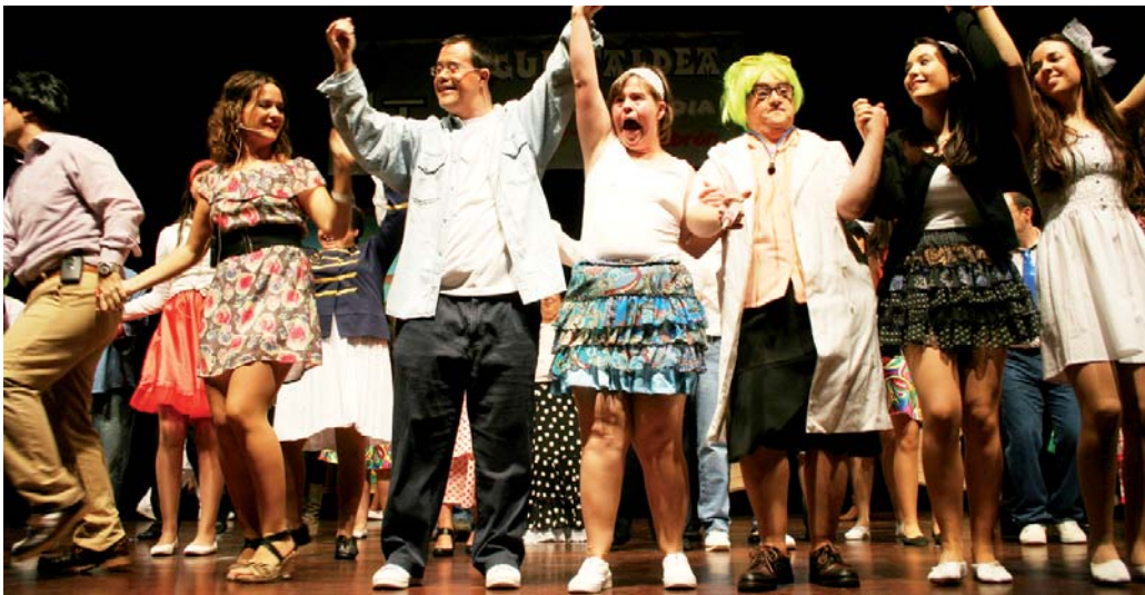
18 aktuaziño musikalekin prestau dittue aurtengo jaialdirako. Izango da girua, bai, Unibersidadian.

Argatxako Jardinetan dake zentrua, "Udalak lagatako lokal batian", eta edozein hartzeko prest dagoz: "Laguntzeko bada behintzat; arduratsua izatia da eskatzen dogun bakarra". Gizartiar euren gerturatzia eskatuko zetsen: "Asko aurreratu da alor horretan, naturaltasun haundixagoz jokatzen dalako oiñ. Integraziñuan asko aurreratu dogu, gitxittasun horrekin be gauza asko egitteko ahalmena dakela errekonozidu dogulako: badago jendia Teknikerren biharrian...".