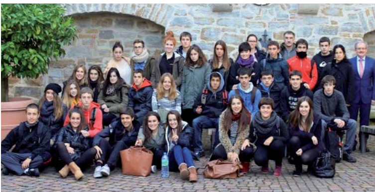
Azaroko lehen egunetan egon ziren eibartarrak Alemanian bisitan.

gero, aurtengo berritasunik garrantzitsuena bisiten txandetan egon den aldaketa izan da: aurreko urteetan alemaniarrek izan dira lehenak bidaiatzen eta, haiek joan eta aste batzuetara, eibartarrak Alemaniara joaten zitzaizkion bisitan. Baina gaurkoan, agur esateko orduan egoera oso bestelakoa izango da, eibarta-