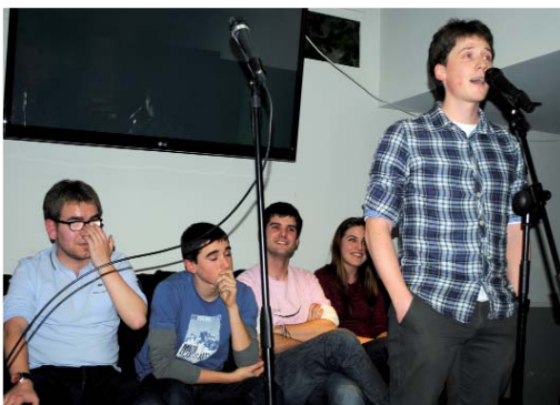
Hankamotzak bertso eskolakoek Akara girotu zuten barixakuan. LEIRE ITURBE

ipurdiz ipurdi eta bizkarrez bizkar. Izan ere, batzuetan zenbat eta urrutiago joan, orduan eta hobeto ulertzen dugu herrian duguna eta, jakina, ezezaguna ere askoz hobeto hartu".