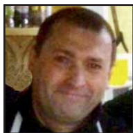
Zorionak, ION, atzo urtiak bete zenduaz-eta. Ondo ospatu! Laztan haundi bat lagun guztien partez.