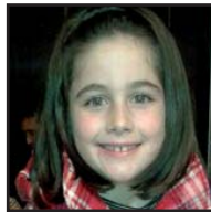
Zorionak, ANE, aurreko domekan zortzi urte bete zenduazelako. Laztan haundi bat famelixaren eta, batez be, Iraiaren partez.