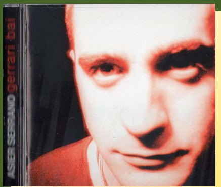
"Gerrari bai" 2003