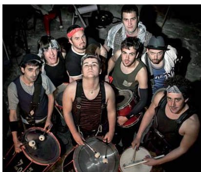
Zo-Zongo Perkushov-k kalejiria egingo dau.