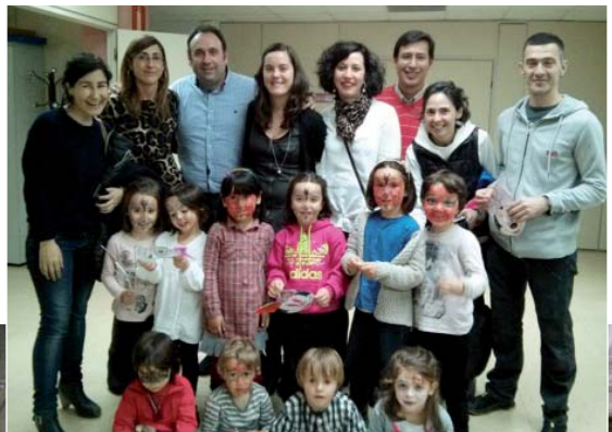
Goian, maskaren tailerra. Behean, Gazteizera egindako txangoa..