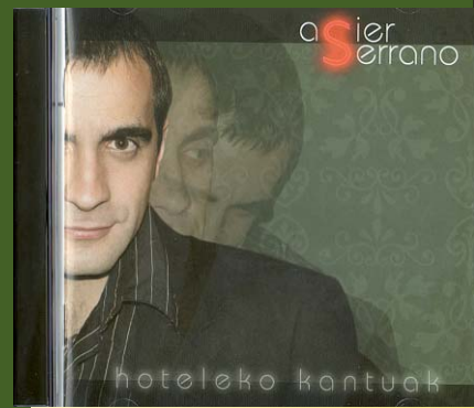
"Hoteleko kantuak" 2005