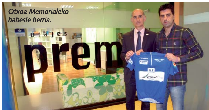
Otxoa Memorialeko babesle berria.