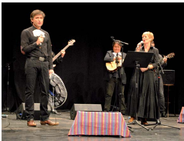
Aurreko barixakuko aktuazioetako bat.