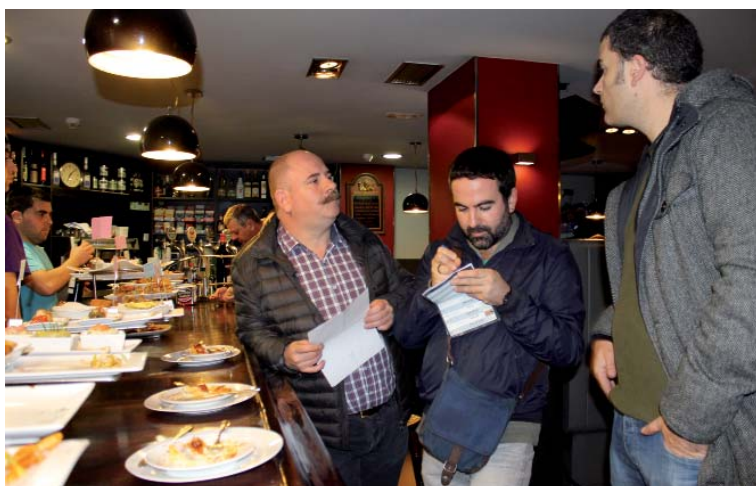
Pintxo Lehiaketako epaimahaikuak taberna batian. SILBIA HERNANDEZ

ko ekitaldixa 14.30xetarako amaittuko da eta arratsaldekoa 18.30xetan hasiko. Dana dala, aurretik Ustekabe txarangia Urkizutik Ipuruara juango da kalejiran (16.00etan urtengo dabe) eta, Eibar eta Real Madrilren arteko partidua amaittuta, Untzaga ingurua girotuko dau 20.00etatik 21.30xetara arte, zozketaren ordua hasi arte. 3.000 euro inguru banatuko dira sarixetan.