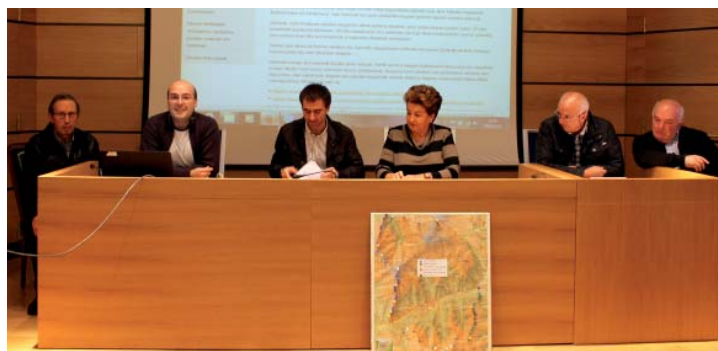
Atzo udaletxean emandako prentsaurrekoaren irudia.