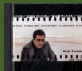
"Ez Esan Inori"