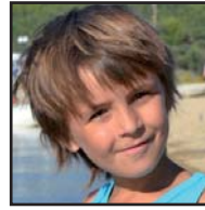
Zorionak, LUAR, etxeko Printze Txikixa! Jarraitu irudimen hori lantzen eta elefantia boaren sabelian ikusten. Amamen eta aitixen partetik.