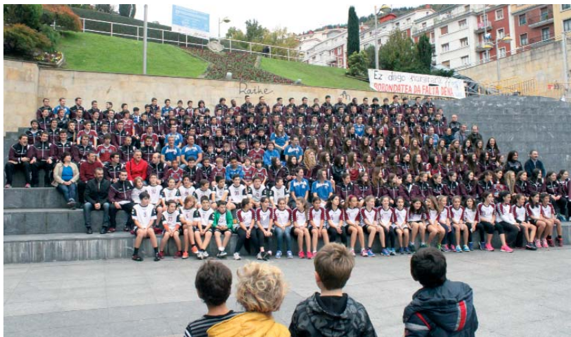
Talde guztiak batuta egin zuten azken argazkia zapatuan. ANDER AZPIAZU