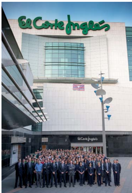
Zentrua zabaldu zebe bihargifetako taldia.

Datorren eguaztenian, hillaren 26xan, El Corte Inglesak merkataritza gunia za- baldu ebala bost urte beteko dira eta, hori ospatzeko, 18.00etan hasiko dan jaialdi- dixa preparau dabe. Dendako fatxadia apaintzen dagaizen argiak ixotziarekin batera ekingo jako jaixari eta, jarraixan, Ipuru dantza garaikidekuak egun ho- rretarako bereziki sortu daben koreografixa erakutsiko dabe. Eta bosgarren ur- tebetetze eguna agurtzeko, bezeruen artian banatzeko egingo daben tarta erral- doia jateko aukeria egingo da.