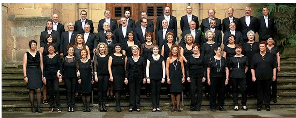
Sostoa abesbatzak, Ermuko Pispillurekin batera, emanaldi bikoitza dauka: gaur Ermuan eta etzi Eibarren.