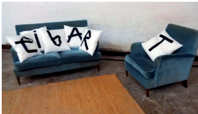
Gaur arratsaldian Zuloagarren kalia zabalduko dabe Eibart.