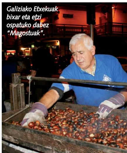
Galiziako Etxekuak bixar eta etzi ospatuko dabez "Magostuak".

rritik kanpora be askok ospatzen dittue eta. Jatorriz jai paganuak ziran, Elizaki denporiak kristautu zittuan arren. Edozelan