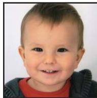
Zorionak, GARI, gaur urtetxua betetzen dozu-eta. Muxu potolo-potoluak famelixaren partez.