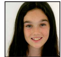
Zorionak, IZAR!, datorren martitzean 11 urte beteko dozuz-eta. Muxuak etxekuen partez.