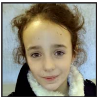
Zorionak, LORE Maiora, domekan bederatzi urte egingo dozuz-eta. Etxeko guztien partez.