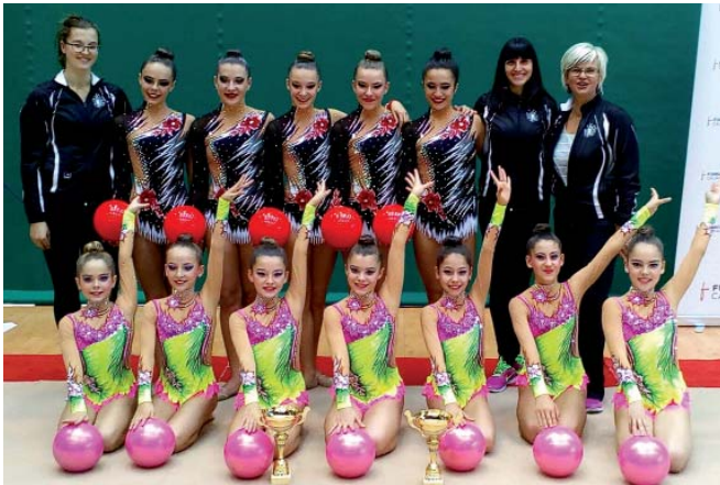
Denboraldi hasiera bikaina egin dute Ipurua Klubeko oinarrizko talde biek: Iruñeko torneo horren adibide, urrezko bi dominekin.