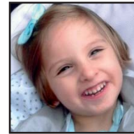
Zorionak, HIART, haraiñegun lau urte egin zenduezen-eta. Muxu haundi bat Ekain nebaren eta famelixaren partez.