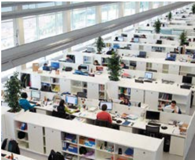
Goian, Urkotronik enpresako langileak eta, behean, Teknikerreko instalazioak.