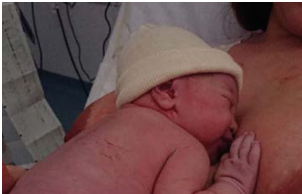
2019an 506 erditze izan genituen Mendaroko Ospitalean; eta aurreko urtean, 605. Lantaldea 10 lagunek osatzen dute, eta lortzen dituzten emaitzak eskaintzen duen kalitatezko zerbitzuaren islada dira.