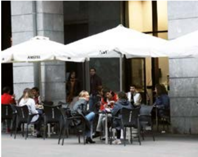
Astelehen arratsaldean bete egin ziren herrian jarri zituzten terraza urriak.