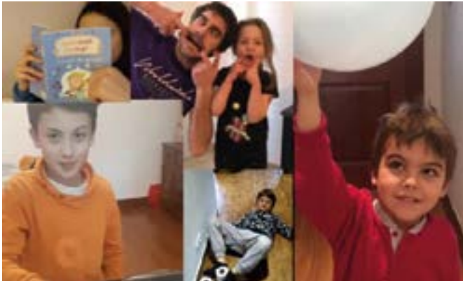
Irakurri, gimnasia, esperimentuak... denetarik egiten dihardute umeeek etxean ez aspertzeko.