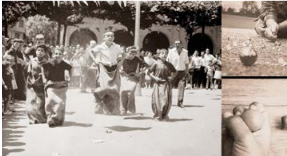
Haurrak, zaku lasterketan, 1965. urteko argazkian.

Ume asko auzoan. Jolasak: pilotan, harrapatzen, ezkututzen... "oin baiño be traste gitxiagokin..." Kaniketan, aponak (tortolosak). Mutilak eta neskak denak batera: jolasean, eskolan... "Horrek ziran gure ibilixak!".