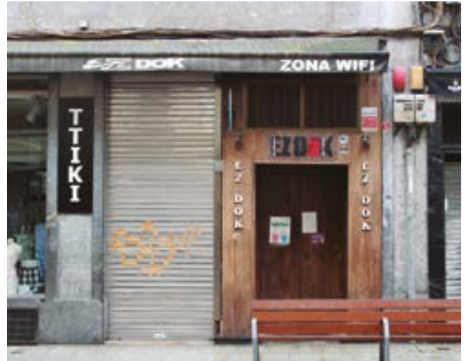
Ez Dok tabernak laster irekiko ditu atekak.

hurbileko bezeroei hozkailuan genituen garagardoak eskaini genizkien”. Horrekin zerbait irabazi dute, baina galerak izan dituzte itxialdian.