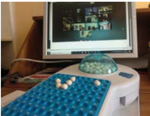
Martitzenetan izaten da bingo-partida, eta saririk ez da falta.