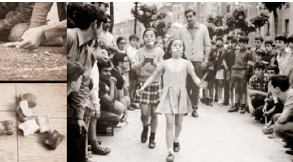
Arrautza lasterketa, Ipuruako jaietan. 1969ko ekainaren 18ko argazkia.