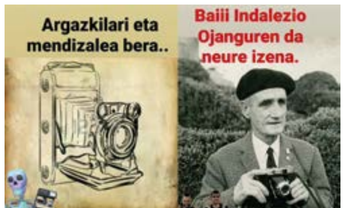
Pisten bitartez Eibarko auzo, kale edo pertsonaien izenak asmatu behar dira.

Gurasoak Berbetan egitasmo-ko kideek ere etxetik dihardute ...eta kitto! Euskara Elkarteak eskaintzen dizkien jardueretan parte hartzen. Lehenengo astean etxean egiten zihardutena kontatzea eta erakustea eskatu genien, eta era guztietako bideoak bidali zizkiguten: sukal-