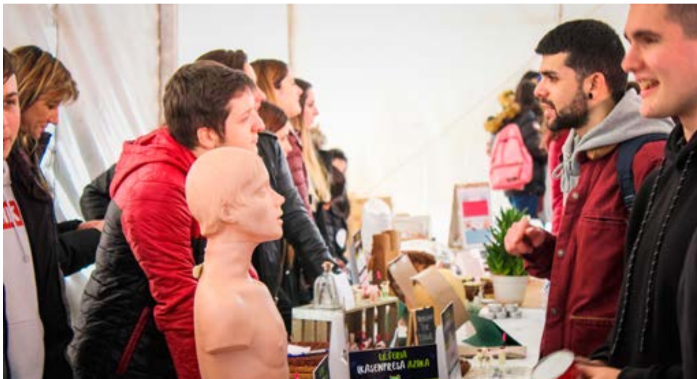
Lanbide Heziketako ikasleentzat berebizikoa izan daiteke ikasketak euskaraz egitea etorkizunean lana aurkitzeko.

bermatu beharko ditugu eta, herritarrak arreta euskaraz jaso nahi badu, euskaraz eman beharko diogu”, dio Ortuondok.