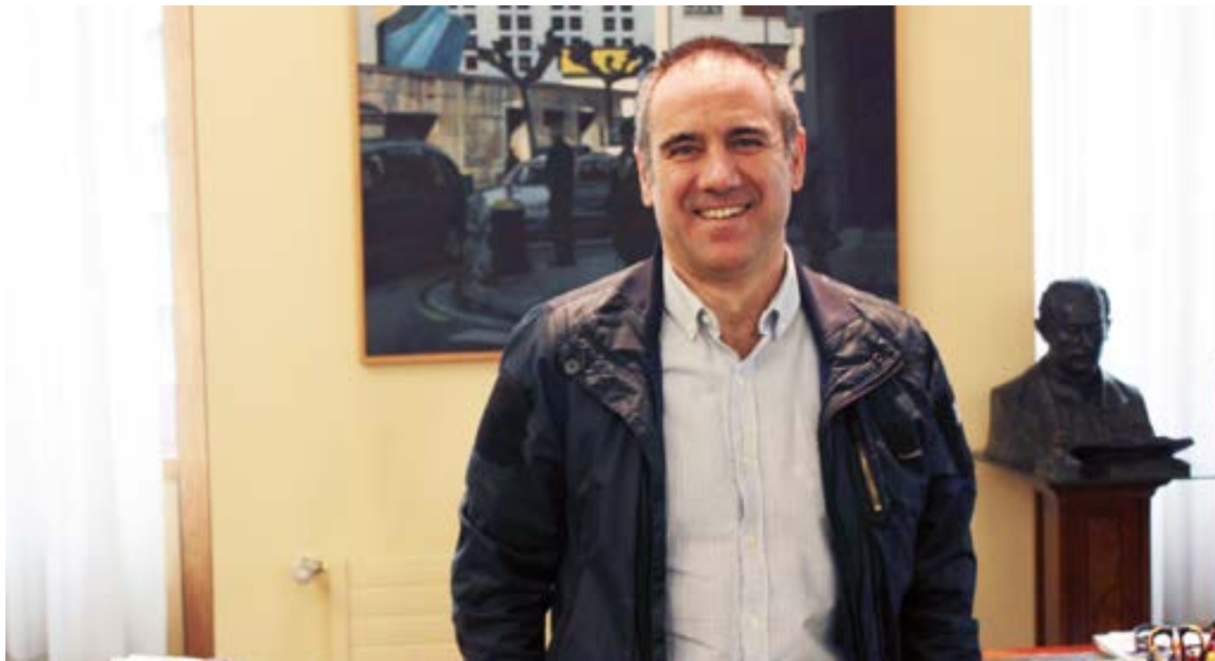
De los Toyos alkateak inoiz baino boletin ofizial gehiago irakurri ditu azken aldian.

kudeatzea. Aurrekoan Espainiako beste 25 alkaterekin izan nintzen aldi berean gure lanaren nondik-norakoak elkartrukatzen... Kudeaketa administratiboa ere ohitzen joan da, egunez egun beste intentsitate bat hartuz. Egunero 08:00etan biltzen naiz Udaltzaingoarekin, bezperan gertatutakoa baloratzeko. Eta inoiz ez dut hainbeste boletin ofizial irakurri.