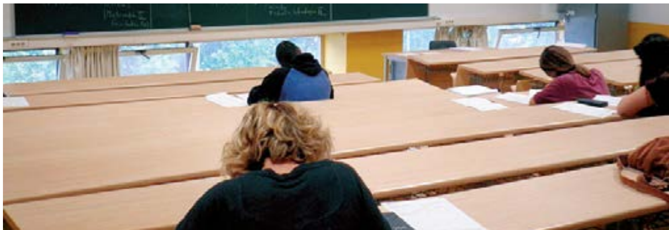
Batxilergoko 2. mailakoek uztailean egingo dute selektibitatea.

Hori bai, ikasturte amaierako azterketak bai egingo dituzte.