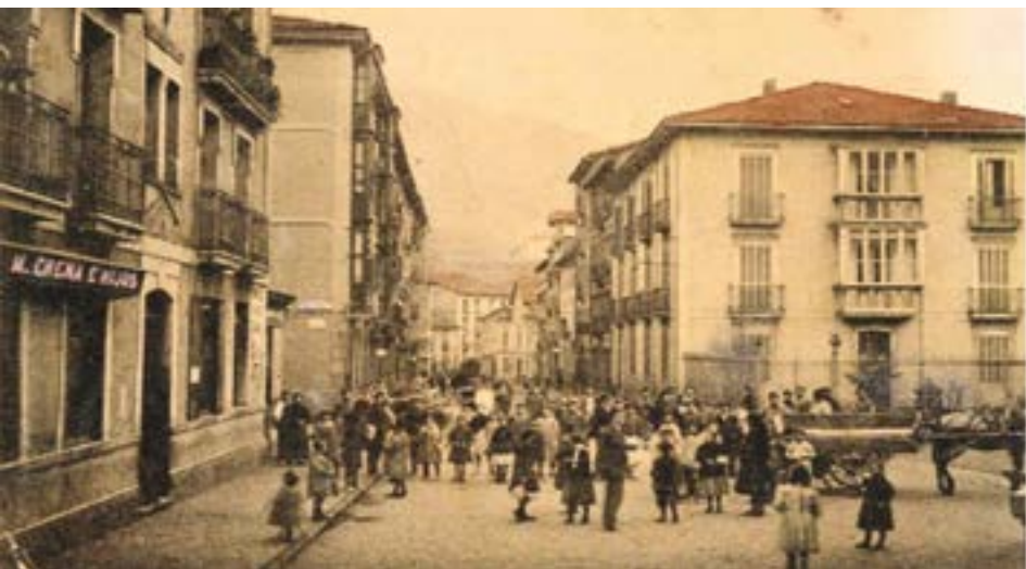
1910 inguruan. Estazio kalea. Espaloi Berberean Hotel Comercio ezaguna (lehenengo eraikuntza eskumatara) eta Salón Teatro Cruceta zeuden.