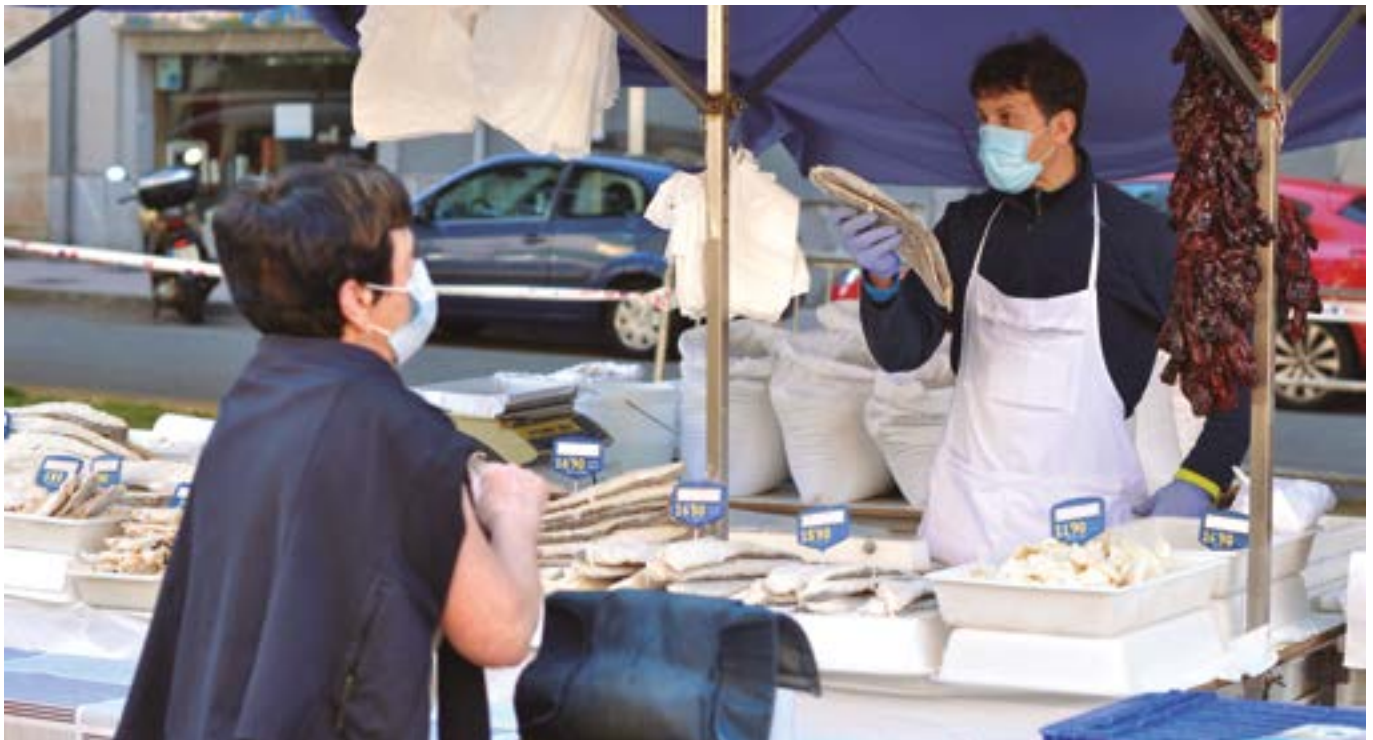
Salmentaren erritmoa nahiko pattal doala esan digute saltzaileek.

tonomoen kuota eta bestelako gastuak ordaintzen jarraitu behar izan dugu". Gainera, alarma-egoera aurretik arrautzak ere saltzen zituen eta bizilagunen artean banatu behar izan zituen alferrik ez galtzeko.