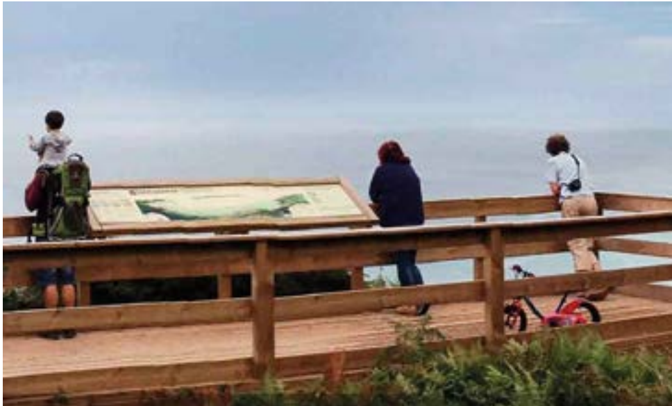
Aurtengo udan gure inguruan ibiliko diren turisten perfila aldatu egingo dela aurreikusi dute Eusko Jaurlaritzako Turismo Sailean: gertuko bisitariak eta egonaldi laburrak espero dituzte.