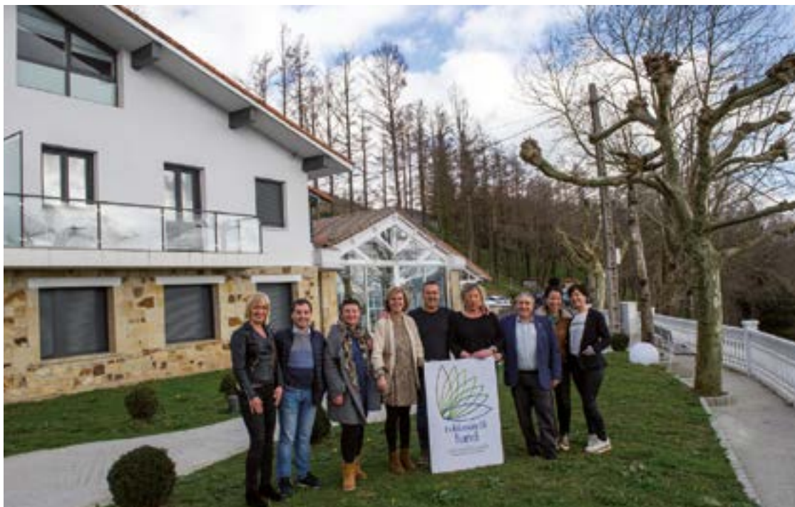
Aurreko otsailean Eusko Jaurlaritzako eta Debabarreneko Udaletako ordezkarien bisita jaso zuen "Txikitasunetik Handi" proiektuan parte hartu duen Ixua Hotelak.