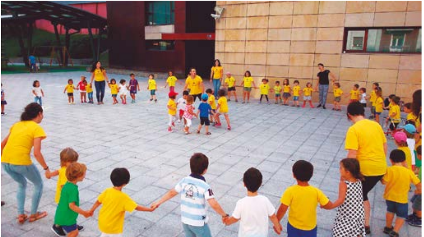
Mitxeleta aisialdi taldeokak herriko toki ezberdinetan ibiliko dira udan.