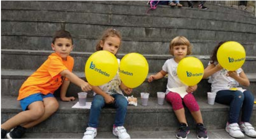
Lehenago irudiari agur esan eta itxuraldatuta etorriko zaigu Berbetan irailetik aurrera.