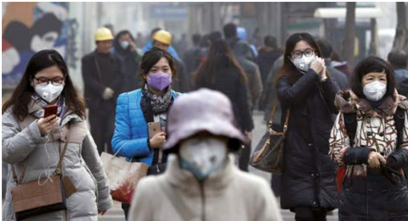
Korean jendeak euren aplikazioetan kontsultatzen du airearen kutsadura-maila.