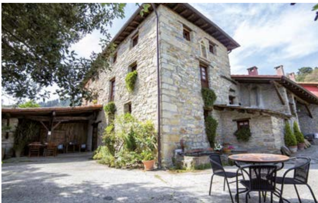
Euskal Herriko hiriburuetatik distantzia gutxira egoteak bisitari asko ekartzen ditu Sosolara, bertan atsedean lasaia hartu eta inguruneak ezagutzeko aukeraz gozatzeko.

Hori bai, gure herriaren edertasuna zalantzan jartzen duten horiek ez lukete halakorik izango Sosolan edo Ixuan gaua bertan pasatuko balute. ■