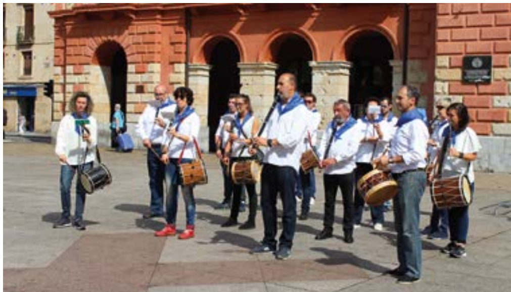
San Juan Zortzikoa udaletxe barruan joko dute aurten.

Txistulari gutxi gaude Eibarren, eta egiten dugun lanaren helburuetako bat da, hain zuzen, txistua herritarrei gerturatzea eta ezagutzera ematea, musika eskolan ikastera animatu daitezzen. Hemendik urte batzuetara taldea bizirik jarraitzea gustatuko litzaiguke.