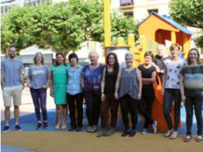
...eta kitto! Euskara Elkarteak lantaldea zuekin batera aurrera egiteko prest.