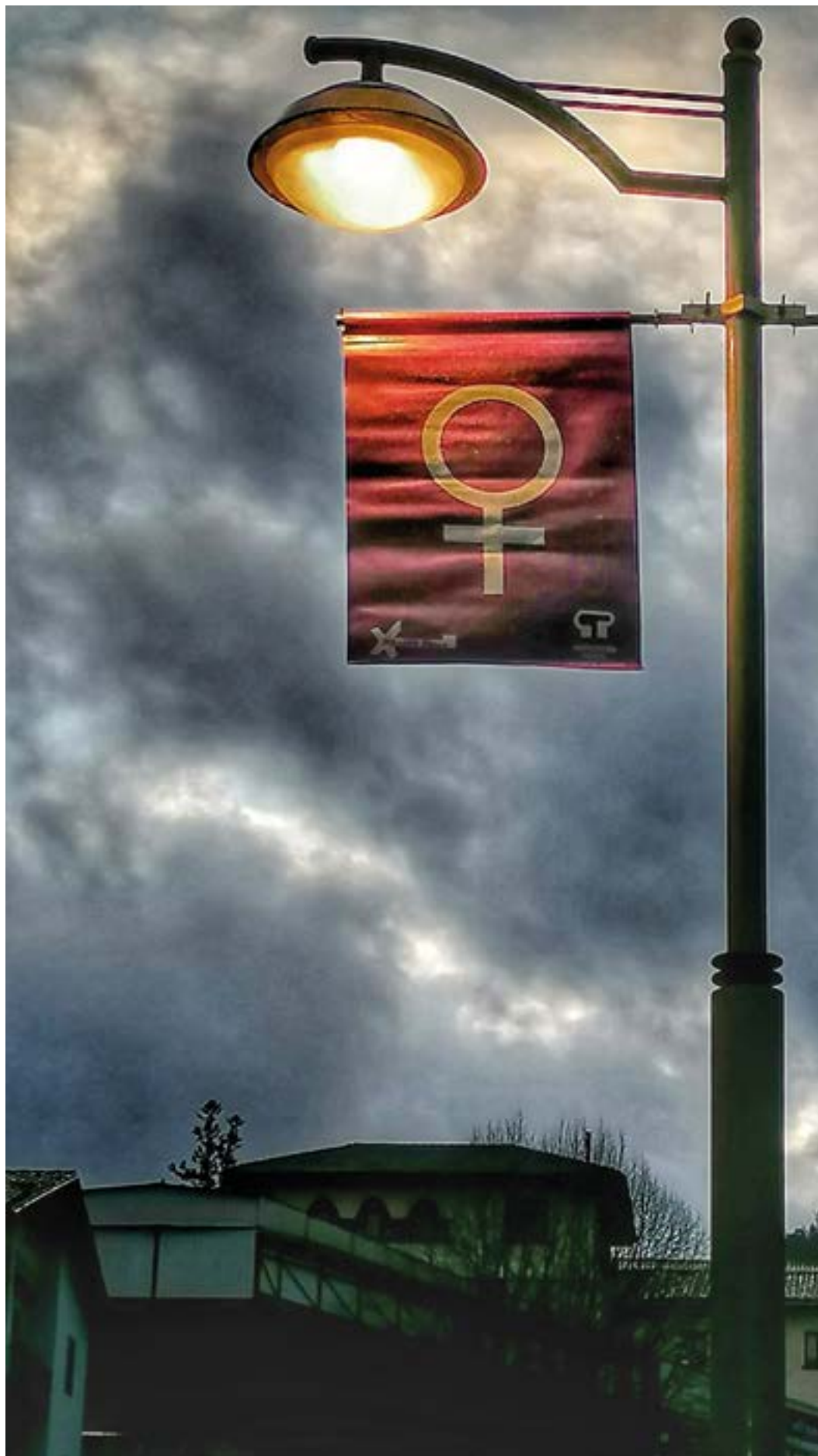
Emakumearen errealitatea argi bila. FERNANDO SOLANA