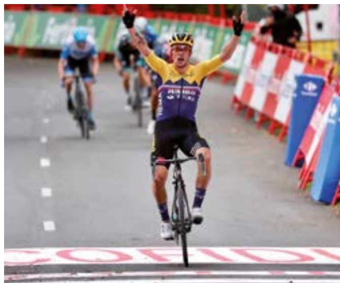
Roglic-ek ondo asmatu zuen noiz aurrera egin Arrateko helmugaren bila.