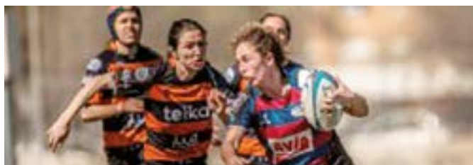
Emakumezkoen taldeko hiru ordezkeri selekzioarekin izan dira.

Hala ere, gogotsu hasiko dute denboraldia eibartarrek, azken hilabeteetan egindako lanaren fruitua erakusteko asmotan. Bestalde, goi mailako Iberdrola Ligan debutatuko duen emakumezkoen taldeak oraindik aste batzuk ditu lehiaketari aurre egin aurretik, denbora guzti hori taldea ahal den hobekien prestatzeko.