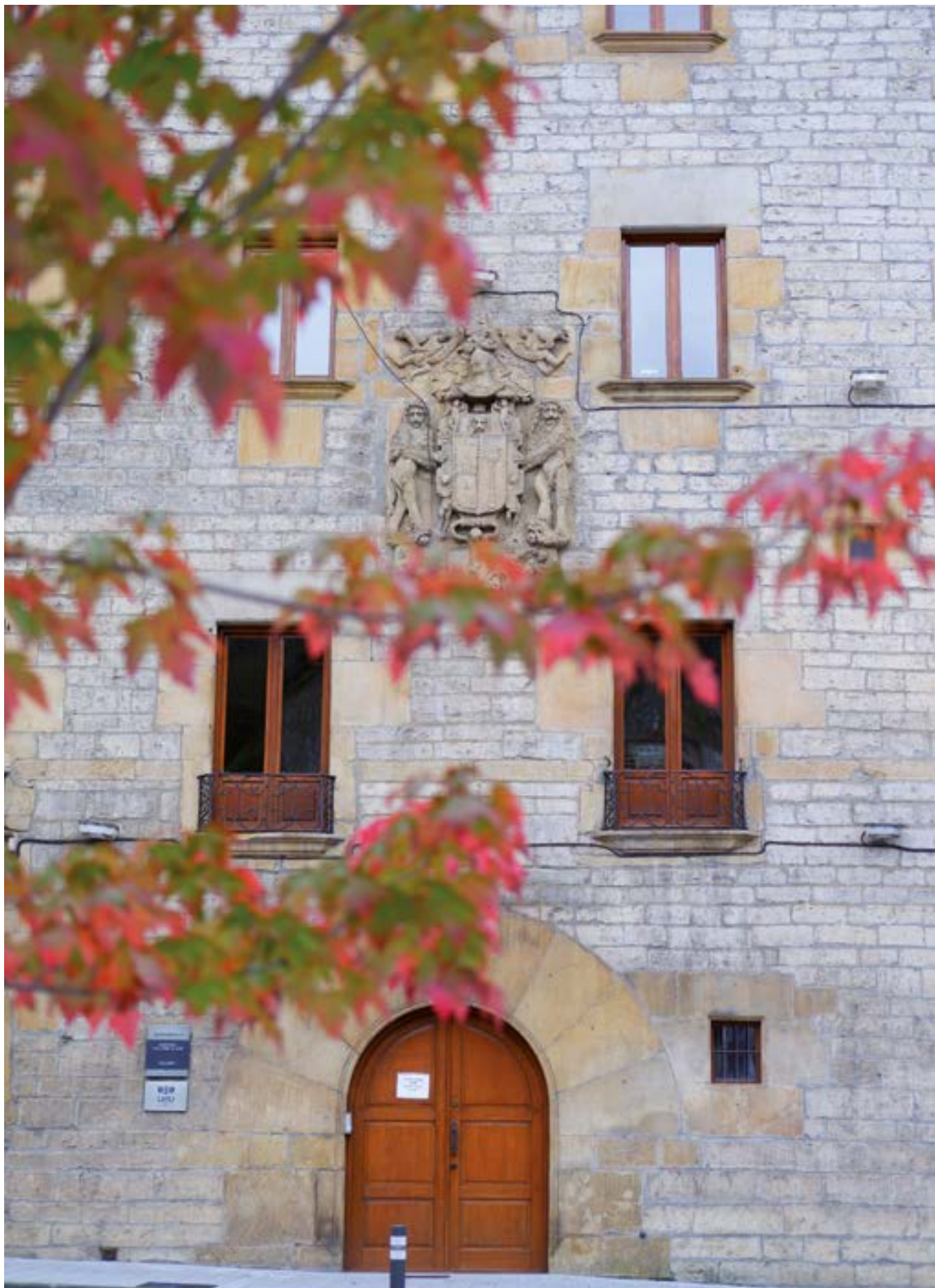
Harriak udazken gorrian. GORKA TELLERIA