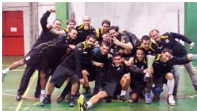
Beste sasoi bateko garaipen bila abiatu dute denboraldia Aviakoek.