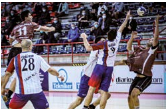
Defentsako lan bikainarekin batera, jokoan ere aurrera egin dute eibartarrek.