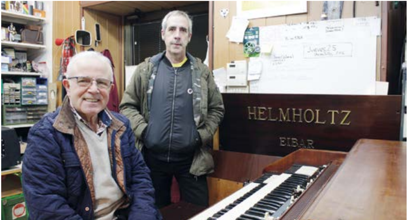
Jesus Mari Agirrerren lokalean hiru Helmholtz organo daude, argazkian Hammondarekin badago ere. EKHI BELAR