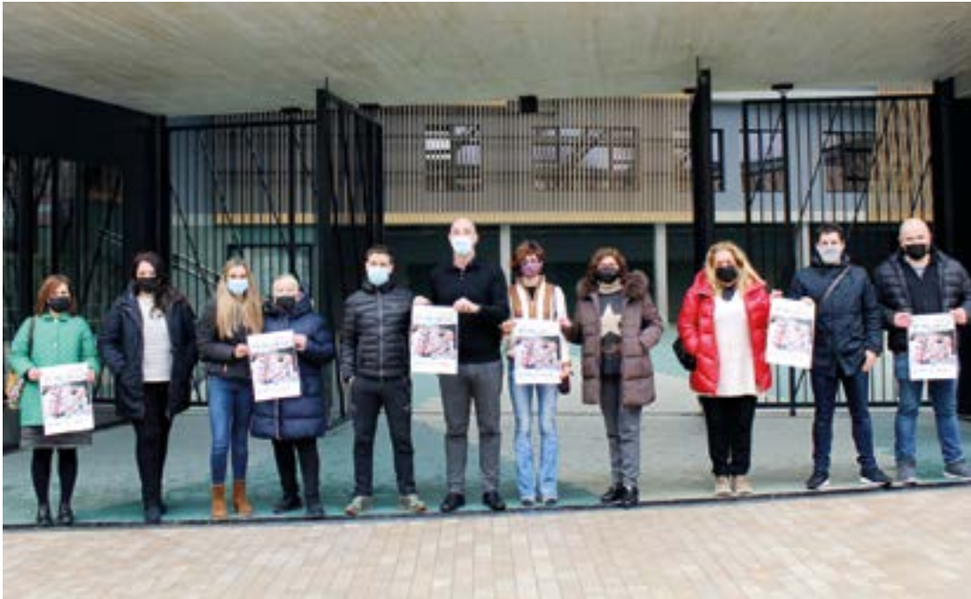
Eibarko Udalak, ...eta kitto! Euskara Elkarateak eta Eibar Merkataritza Gune Irekiak abiatu duten kanpainaren aurkezpenean herriko merkataritza batzuk ere egon ziren. SILBIA