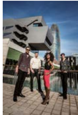
Koko-Jean & The Tonic