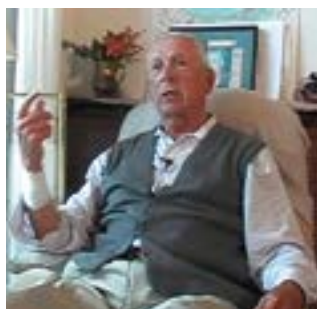
Migel Gallastegi Ariznabarreta (1918 – 2019)

Eibarko Asoliartza baserrian jaio zen, Amaña auzoan. Bere garaiko ume gehienak bezala, txiki-txikitatik hasi zen pilotan jokatzeko, baina berehala ikusi zen profesional izateko gaitasun apartak zituela. 14-15 urte zituela Isasi kaleko “Giputxanekua” pilotalekuan hasi zen jokatzeko eta entrenatzeko; berehala, Astelenan ere hasi zen entrenatzen. Hemezortzi urte zituela debutatu zuen 1936. urtean, baina gerrak harrapatu zuen. Gerra amaituta eta sasoi batean, 1940. eta 1950. hamarkadetan nagusi izan zen Euskal Herri osoan. Buruz buruko hiru txapelketa irabazi zituen (1948, 1950 eta 1951) eta dozenaka partida jokatu (eta irabazi) zituen bikoteen eta hirukoteen aurka.