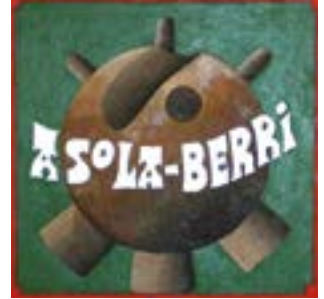
Gure herriko Asola Berrikoek mai-la onean jardun dute txapelketan.

Bihar Ziortza-Bolibarko Iru-zubietan dagoen bolatokian jokaturako den Lehendakari Sariak emango dio jarraipena, ohikoa denez, Euskal Herriko Txapelketari. Hor lehenengoko 64 sailkatuek hartuko dute parte eta, kanporaketa formatuari jarraituz (lehenengoa azkenaren kontra, bigarrena azken aurrekoaren kontra eta horrela) garaile bakarria geratu arte jardungo dute. Hiru sari egongo dira: 300 euro eta txapela irabazlearentzat, 200 euro