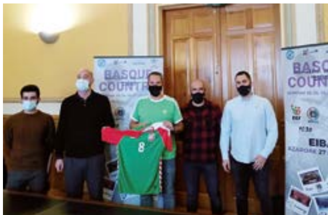
Martitzenean udaletxean egin zuten aurkezpen ekitaldia.

Aipatutako Batzar Orokorra abenduaren 15ean (eguztana) egingo da, 19:00etan hasita, Coliseoan. Oraingoan presentzialki egiteko itzaropena dute klubean, iazkoa telematikoki egin behar izan zuten-eta.