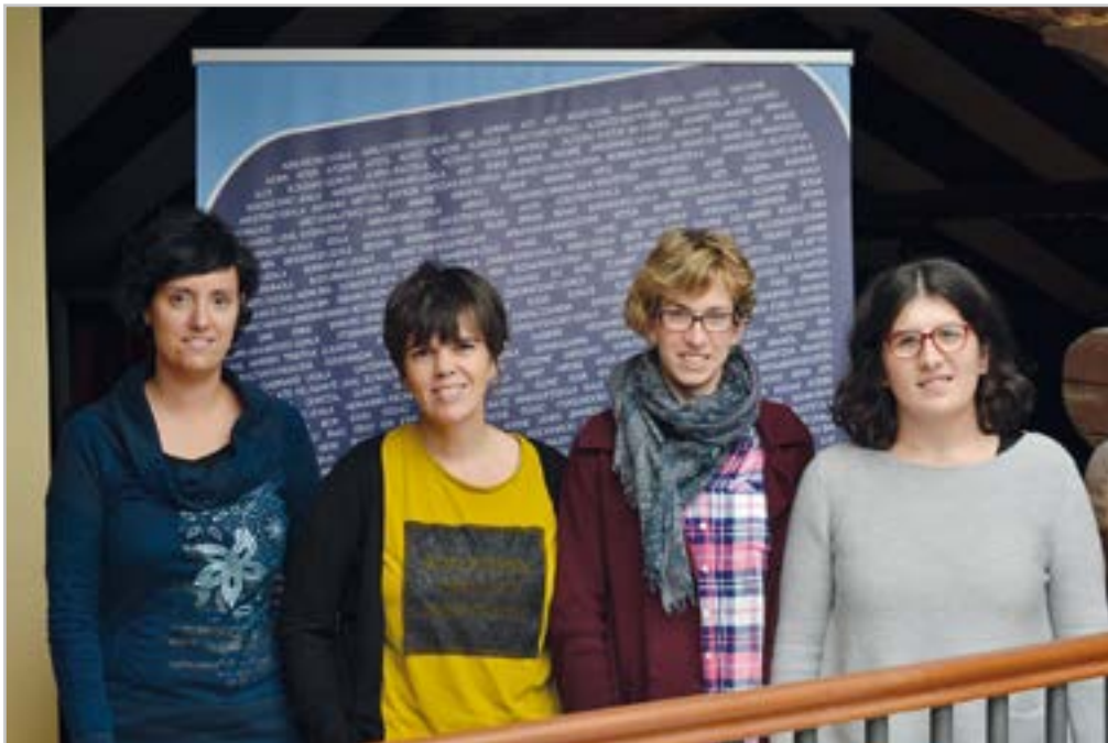
Badihardugu Euskara Elkarateak 20. urteurrena ospatu zuen

"Igarri barik etorri zaizkit 100 urteak, entretentuta egon naiz orain arte"