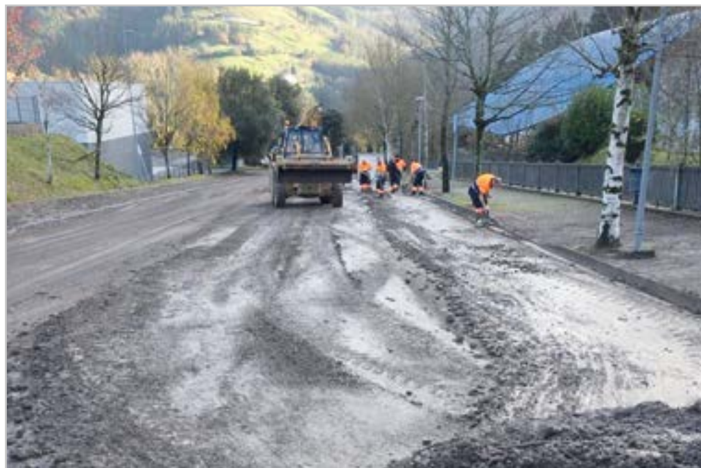
Euriteek kalteak sortu zituzten Eibarren eta Debarrena guztian.

“Boli Kostakoa esperientzia bikaina izan da”