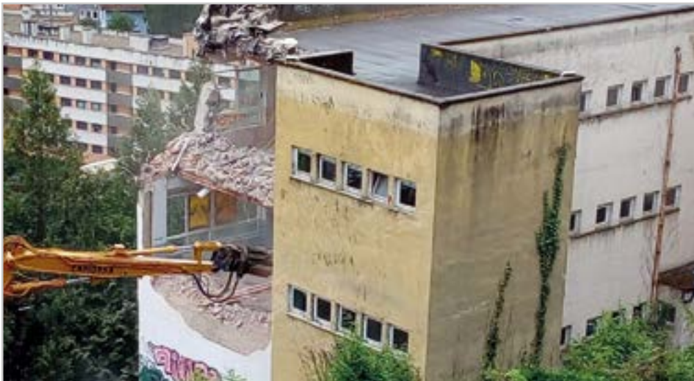
Alfa ikastetxearen eraikina bota zuten.