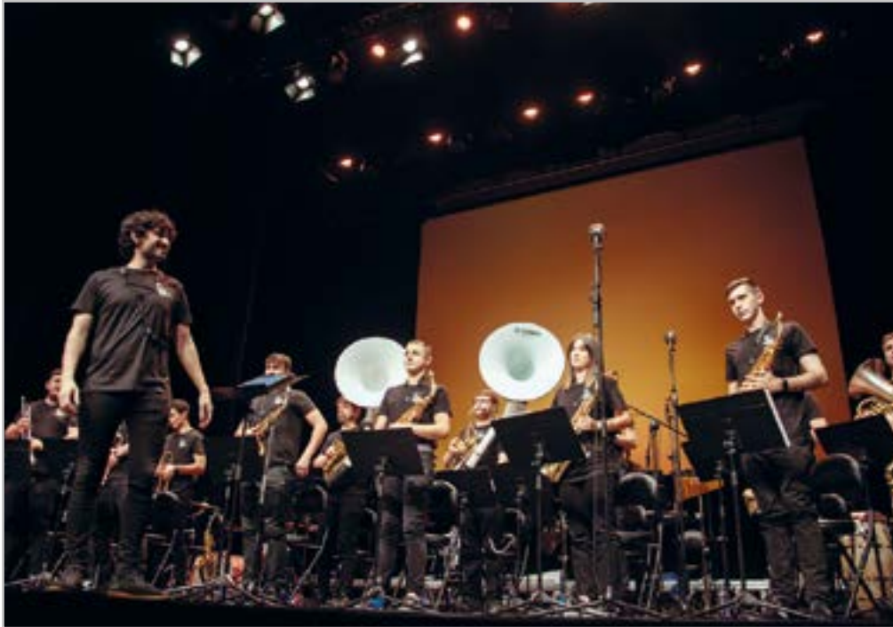
Ustekabe fanfarreak 'Eibarko kantak' izeneko diskoa aurkeztu zuen Coliseoan.