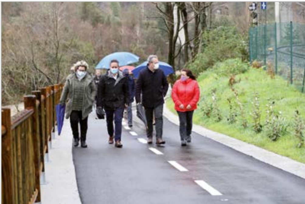
2020. urtearen amaieran inauguratutako Elgoibar eta Eibar arteko bidegorria estreinatu ahal izan genuen.

"Oztopoak daudenean aurrera egitea atsegin dut eta bizitza sentitzea gustatzen zait"