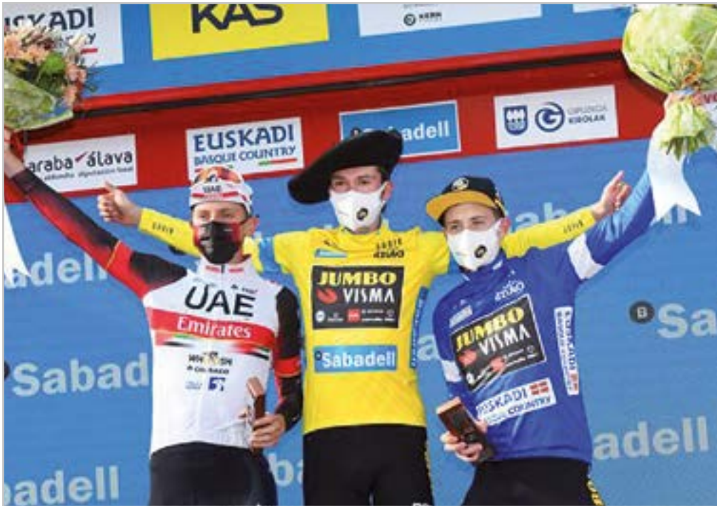
Goi-mailako txirindularitzaz gozatzeko aukera izan genuen.