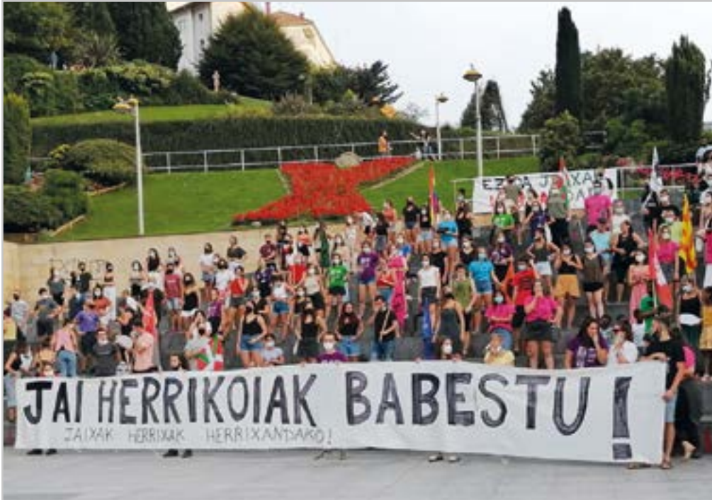
Arrateko Jaien egitaraua bertan behera laga ondoren, herriko eragileek protesta egin zuten.