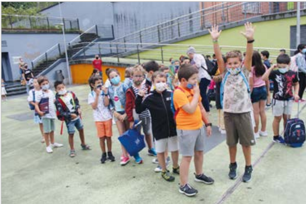
Herriko umeeek ikasturte berriari ekin zioten.

“Batzuk kirola egingo dute, beste batzuk idatzi... Nik beti jotzen dut musikara: triste nagoenean, pozik nagoenean...”