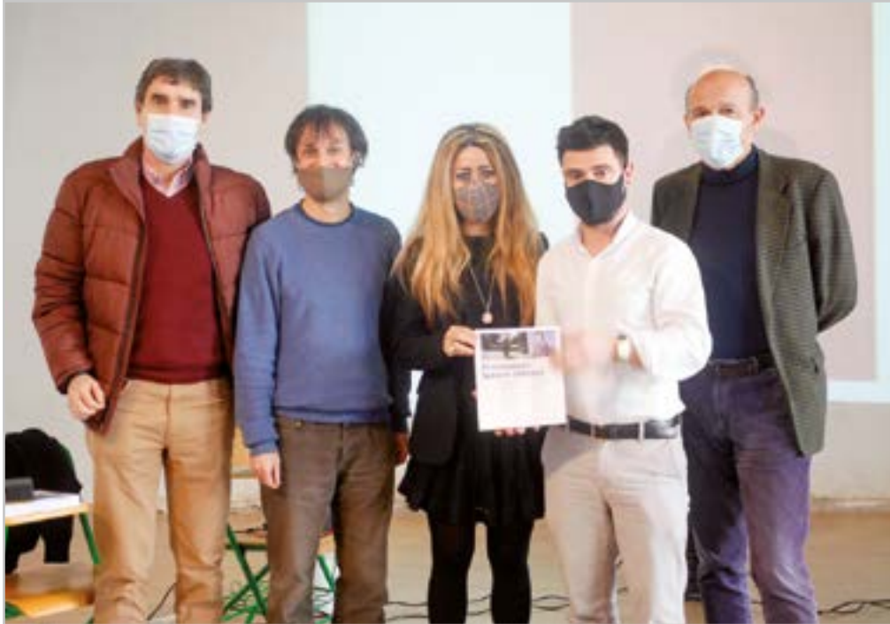
'El verdadero Zuloaga' liburua aurkeztu zuten Ignazio Zuloaga institutuan.