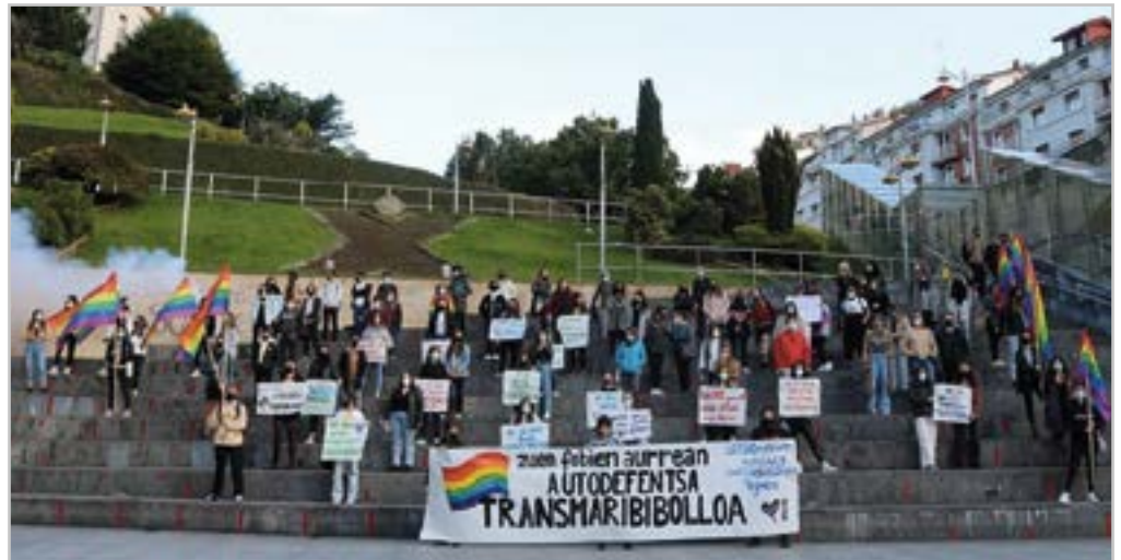
LGTBfobiaren aurkako eguna ospatu zen maiatzaren 17an.

Gipuzkoako pentsiodunek Eibar igaro zuten probintzia osoan zehar egindako bizikleta-ibilaldiaren barruan.