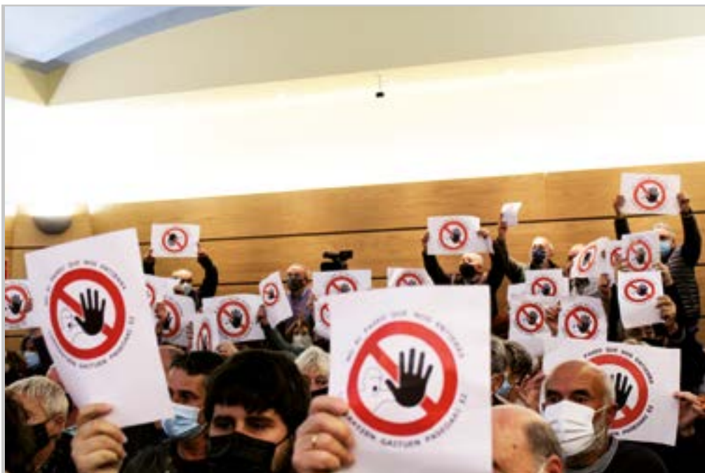
Barrena inguruan trenbidearen gainean paseoa egiteko proiektuak hautsak harrotu ditu.

“Erronkariko emakumeen oroimenak denboran aurrera jarraitzea lortu nahi dugu”