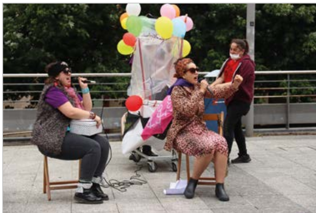
Mugak muga, San Juan jaiak ospatu ahal izan genituen.

“Lokalak hutsik ikusten ditudanean beti irudikatzen dut nire marrazki-negozia zabaltzea bertan”