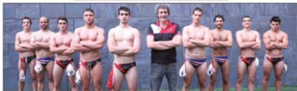
Urbat-Urkotronik senior mailako taldea