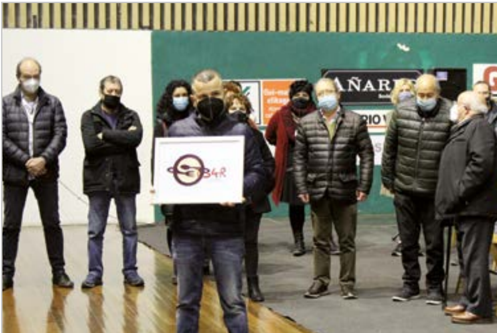
Herriko ostalariek San Andres Eibarko Ostalaritza Elkarte sortu zuten.

"Behar-beharrezkoa da gizonak inplikatzeko zaintza-sistema eraldatu nahi badugu"