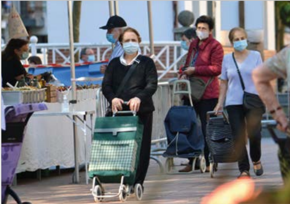
Pandemiaren lehen urteurrena bete zen martxoan.