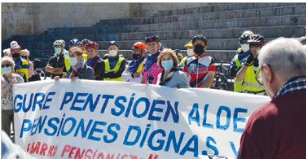
Gipuzkoako pentsiodunek Eibar zeharkatu zuten probintzia osoan zehar egindako bizikleta ibilaldian.

“Gaur egun esan dezakegu ez gara inolaz ere hartutako erabakiaz damutzen”