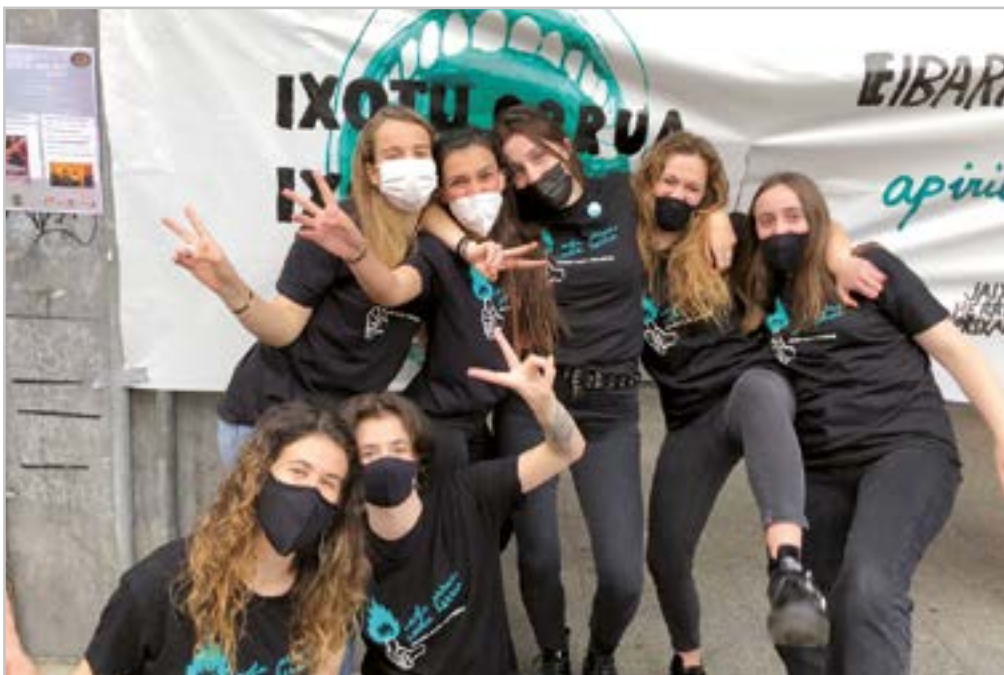
Gazte Topaketak egin ziren 'Ixotu orrua, ixotu herria' goiburuarekin.

“Gazte bat ondo gizarteratzen ez bada, patologia mentalekin amaitzen du ia beti”