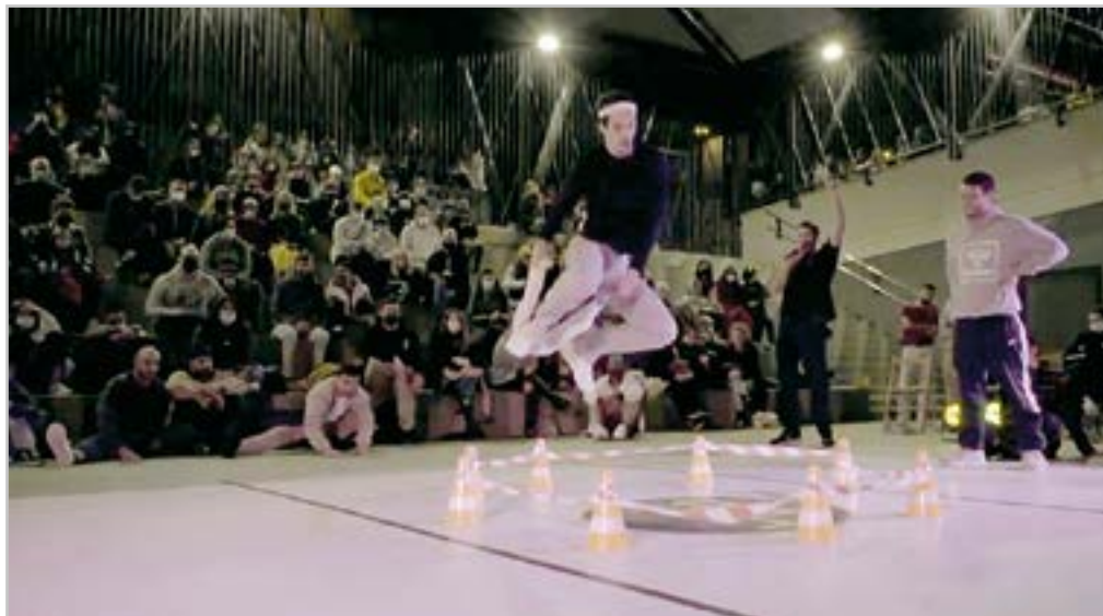
Breaking Eibar izeneko dantza-jaialdiaren seigarren edizioa egin zen Errebal Plazian

“Antzerkiaren edo zinearen munduan musika egiteko prozesua kolektiboagoa da”