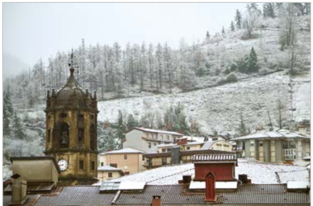
Elurpean hasi genuen 2021. urtea.

Gai zientifiko garrantzitsuena, ostera, COVID-19a izan zen. 2020a koronabirusaren urtea izan zen eta 2021ean bidelagun (ez desiratua) izan dugu. Birusari aurre egiteko asmoz, txertaketa egiten hasi genuen urtea Eibarren eta Astelena frontoia jarri zuten txertaketa-puntu bezala.