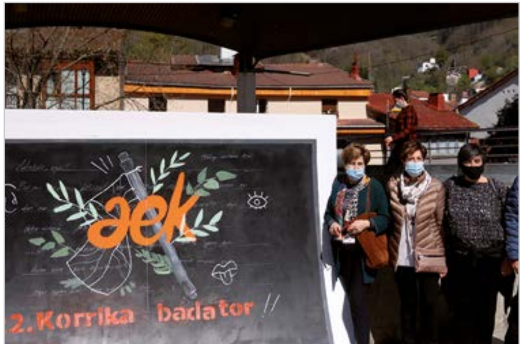
Ezin izan zen Korrika egin, baina AEK-k ‘Bultza Euskaltegiak! Bultza Euskara!’ egitasmoa antolatua zuen.

Hilaren amaieran Gazte Topaketak egin ziren, ‘Ixotu orrua, ixotu herria’ goiburuarekin.