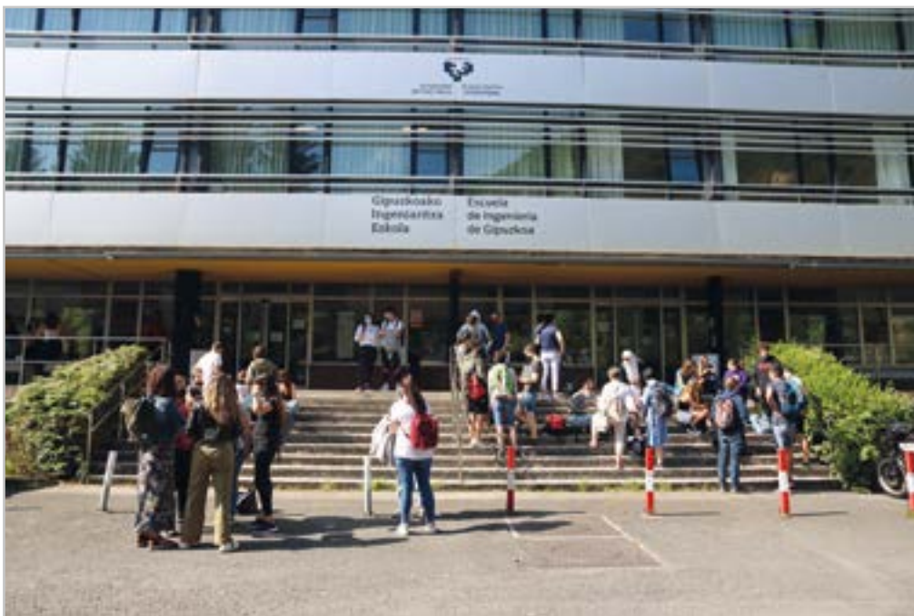
Euskadiko 12.000 ikaskek baino gehiagok egin zuten selektibitatea.

“Seme-alabak hona etorri arte ez dut bihotza lasai eta bakean edukiko”