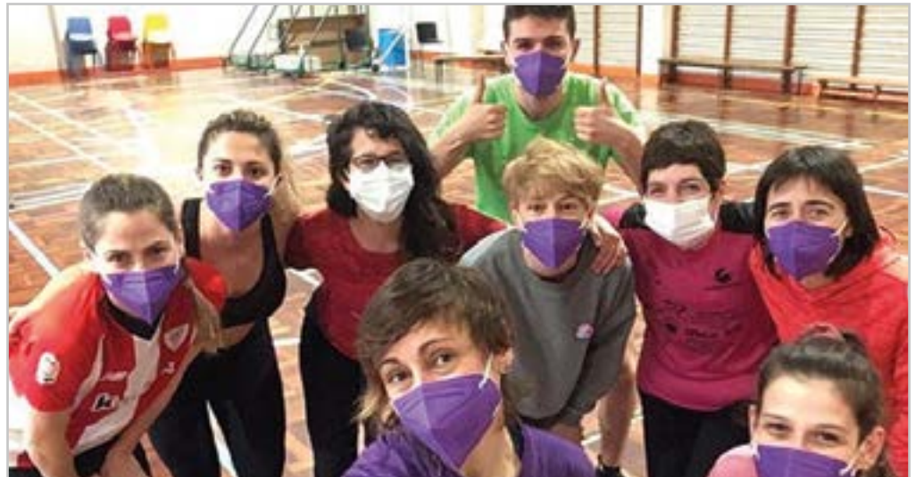
Hainbat ekintza egin ziren hilabete osoan zehar Martxoaren 8aren harira.

Udaberriaren hasierarekin, XI. Lore, Landare eta Zuhaitz Azoka antolatu zuten Urkizuko parkean. Erdialdera joz, El Casco eraikina botatzeko lanak hasi zituzten.