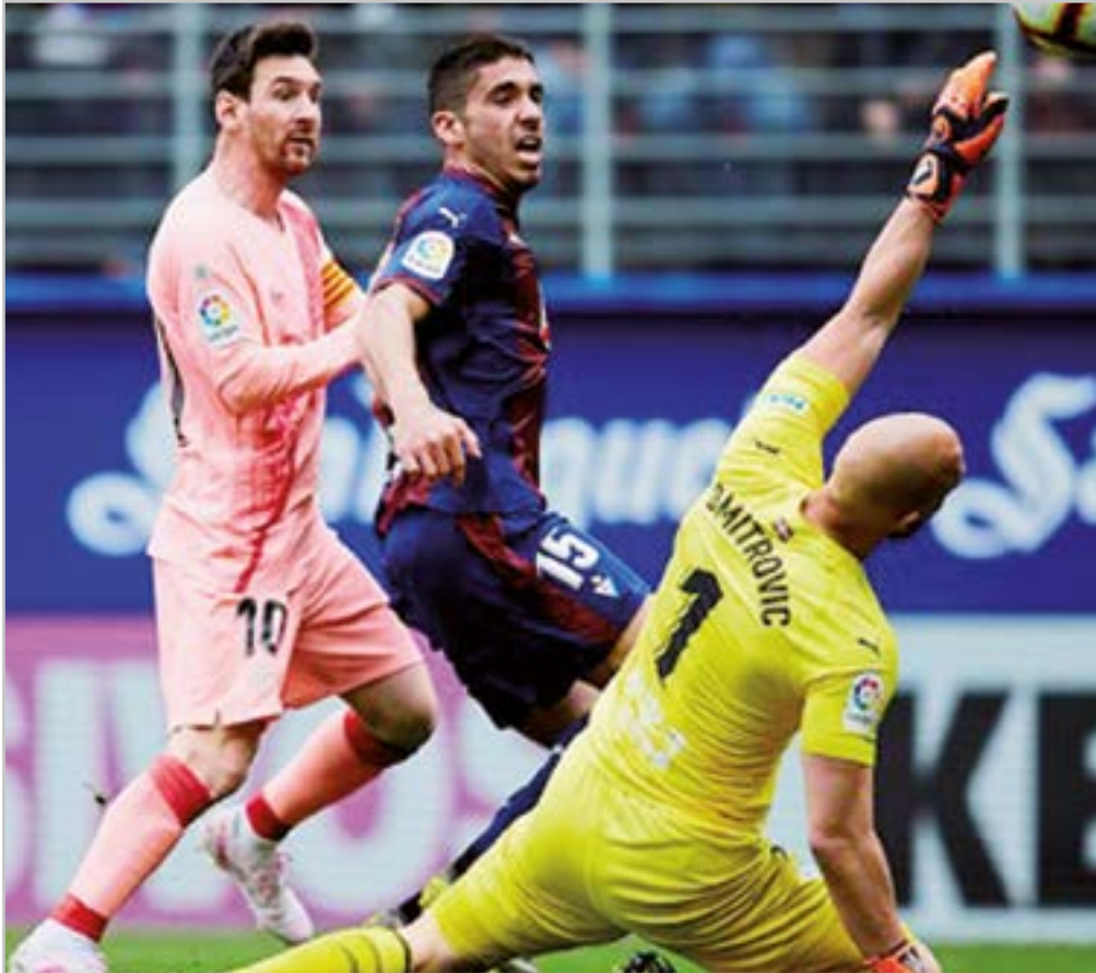
Eibar KE-k maila galdu zuen zazpi urteko ametsa bizi izan ondoren.