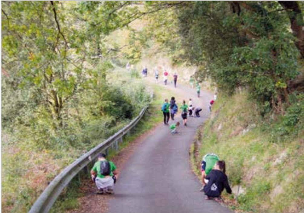
Baso Biziak taldekoek ezkur landaketa egiteko egitasmoa jarri zuten martxan.