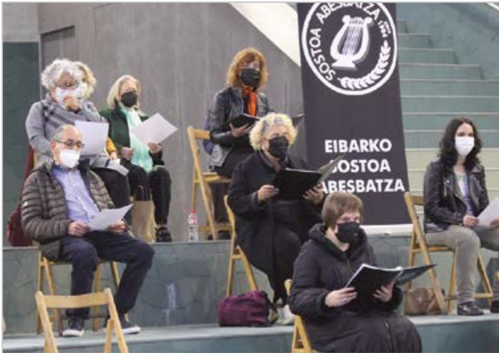
Urtebeteko geldialdiaren ondoren, Sostoa abesbatzak indarberrituta ekin dio bide berriari.