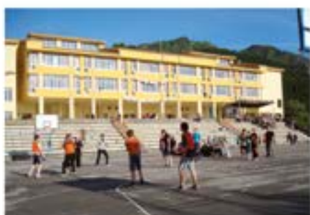
J.A. MOGEL IKASTOLA 943 20 84 87