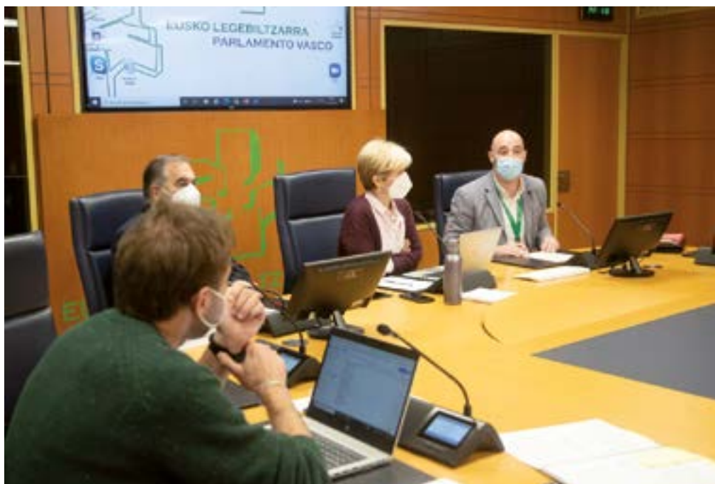
Aurreko astean azaldu zituen gure herriko alkateak bere asmoak Eusko Legebiltzarrean.