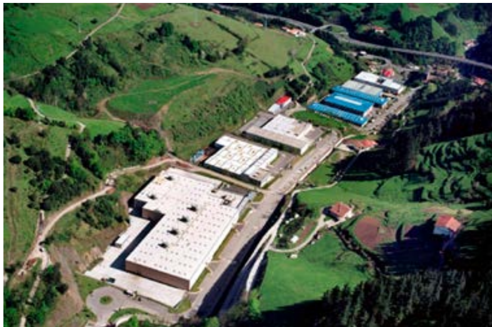
Azitaingo Industrialderako errepidea hobetzeko obren aurrekontua 800.000 eurotik gorakoa da.

urbanizazioa eta egokitzapena, 54.665 metro koadroko eraiki-garritasuna eta 15.400.000 euroko aurrekontua), Europako Next funtsak merezi ditzakeen proiektu gisa. Eskualdeko eta Eibarko espezializazio-eremu nagusiekin bat datozen teknologiei eta sektoreei (Industria 4.0, Mekatronika eta Doitasun Ingeniaritza) lotutako enpresa-proiektuak erakartzea izango litzateke handitze horren helburua.