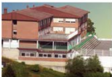
ARRATEKO ANDRA MARI 943 20 72 35