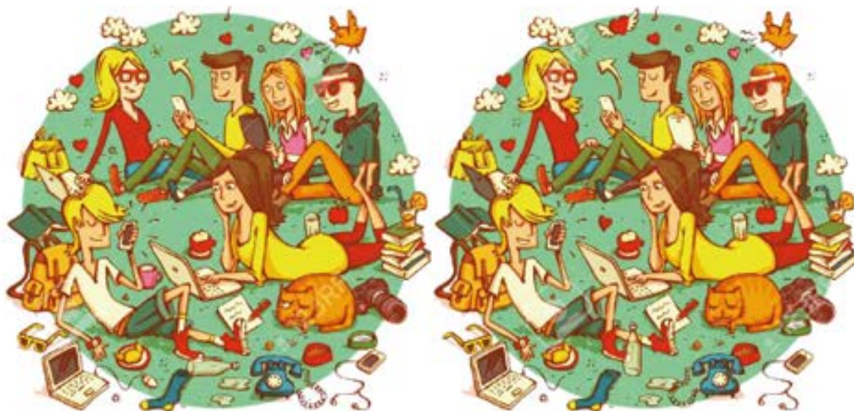
Aurkitu 10 DESBERDINTASUNAK irudi bi hauen artean