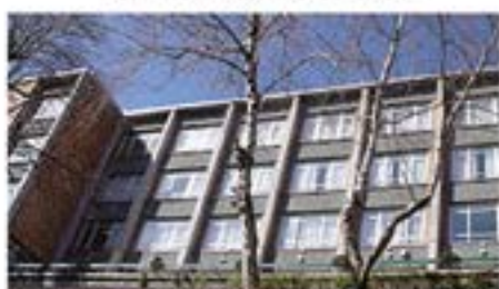
EIBAR BHI 943 89 92 62 JARDINETAK, 3 B www.eibarbhi.eus DBH 3, 4 + Babilergoak + ZIG