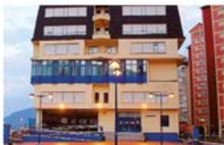
EIBAR BHI 943 89 92 21 ISASI, 37 www.eibarbhi.eus DBH1, 2 + Gautenako gela orokorra