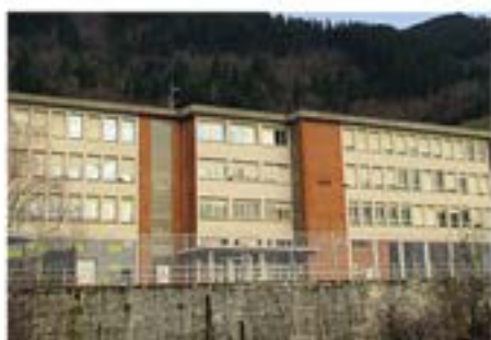
AMAÑA 688 68 72 89