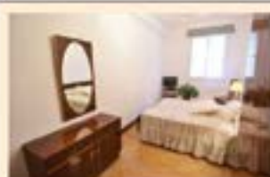
Isasi. Ref. 2020

3 logela. Igogailuarekin. Irisgarritasun ona.