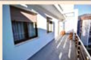
Barrena. Ref. 2066

4 logela, komuna, egongela, sukaldea eta terraza. Erreforma egiteko.