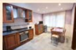
Urki. Ref. 2064

2 logela. 3 logela atera ahal zaizkio. Balkoia, trastelekua eta igogailuarekin.