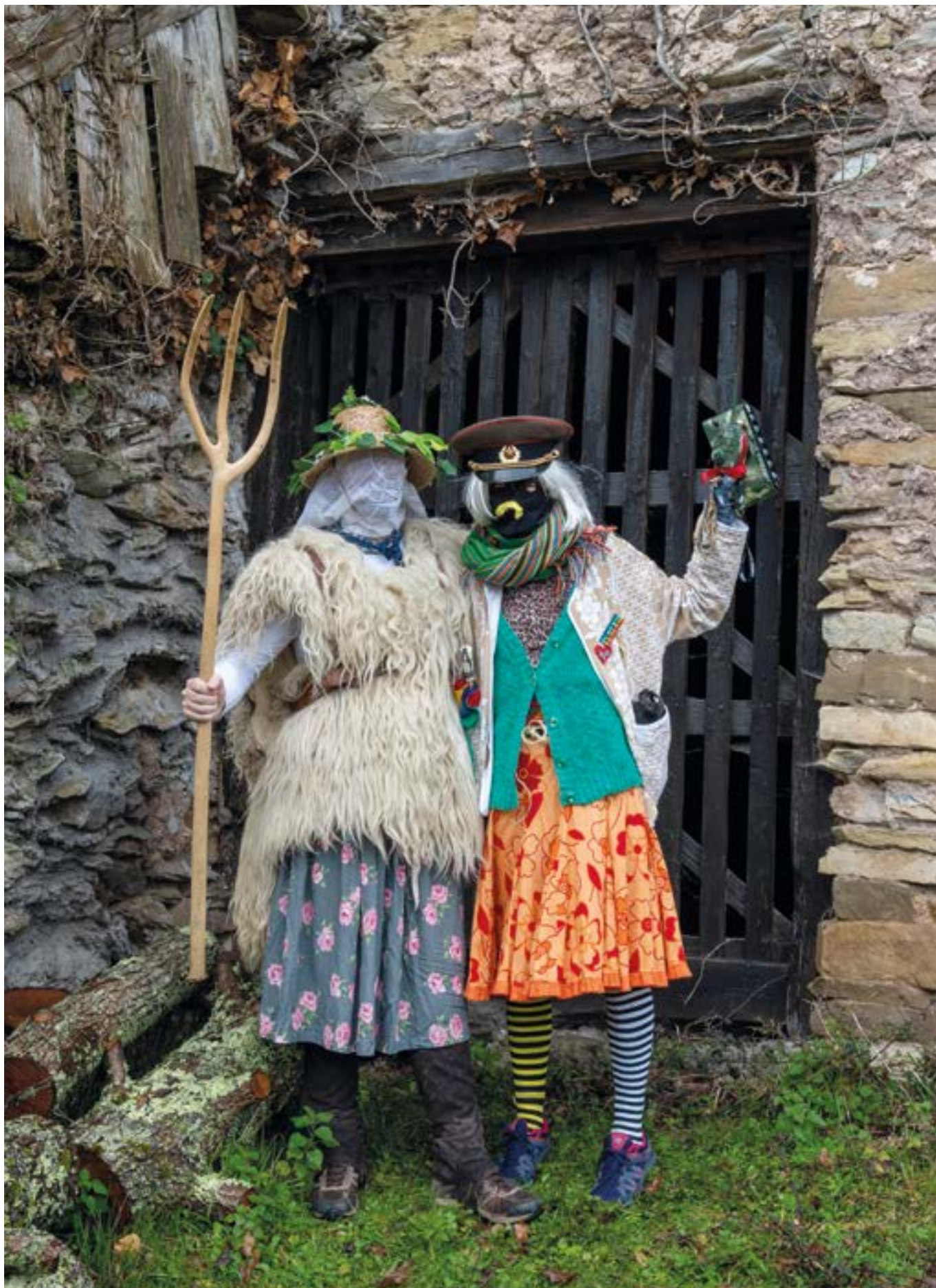
Koko-marru bihurriak. FERNANDO RETOLAZA