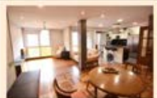
Urkizu. Ref. 2075

3 logela. Pisu altu, eguzkitsua eta argitsua. Guztiz berriak. Kalefakzioa eta igogailuarekin.