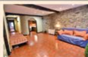
F. Calbeton. Ref. 2027

3 logela, 2 komun. Izogailua 0 kotara. Berriak.