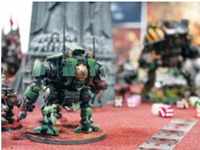
Joko mota asko dituzte Odisea elkarteko ludotekan. Horien artean Warhammer 40K da ezagunenetakoa. EKHI BELAR

sun txikienari ere garrantzia emanez. Beste batzuek, oster, ez dira gehiegi konplikatzten. Edonola ere, miniaturrek asko esaten dute pertsona baten inguruan eta esan daiteke miniaturrei gure izaera ematen diegula”, diosku Rodriguezek. Esan digunez, berak asko zaintzen du arlo hori.