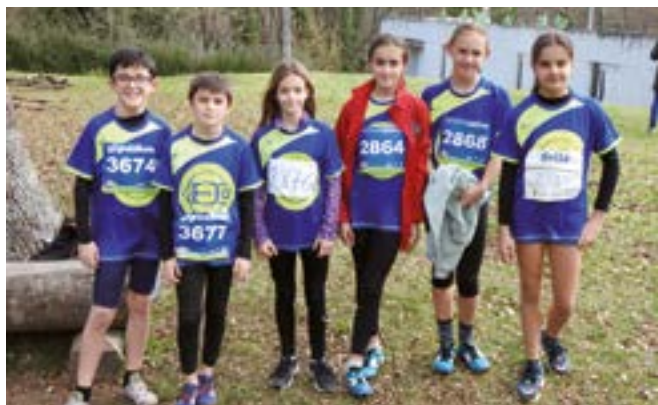
Alebin eta infantil mailetakoa Klub Deportiboko krosleriak.