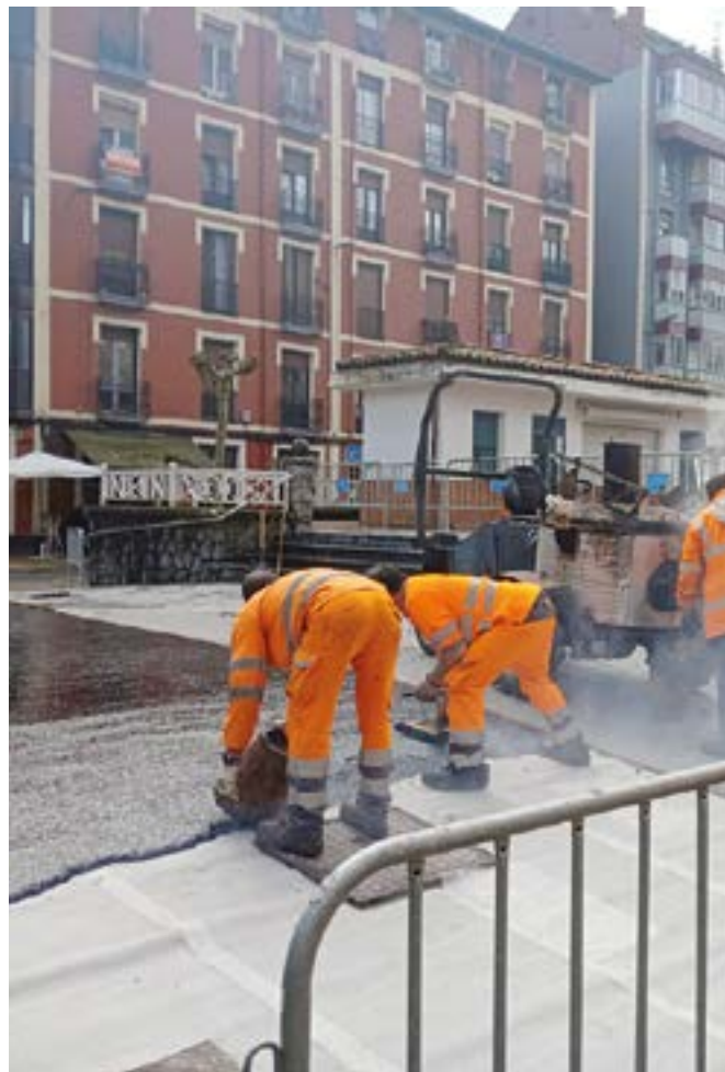
Aste honetan bertan hainbat asfaltatze-lan egin dira, Urkizun kasurako.

Gure herriko korporazioak hilaren 17an telematikoki egingako ezohiko Batzarrean 44.754.450 euroko aurrekontua onartu zuen aurtengo jardunetarako, aurrekoarekin alderatuta sei milioi euro handiagokoa. Kontuak aurrera atera ziren PSE-EEko (9) eta EAJ-PNVko (6) zinegotzien aldeko botoekin eta EH Bilduko (5) eta Podemos - Ahal Duguko (1) kontrakoekin. Inbertsioetarako 6.683.682 euro bideratuko dira, arlo horretako iazko aurrekontuetarako partidarekin (4.071.995) parekatuz %64 gehiago.