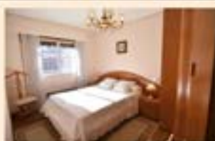
Legarre. Ref. 2076

www.aukera-inmobiliaria.com 943 12 13 95 Bidebarrieta 29