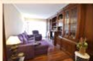
Ipurua. Ref. 2061