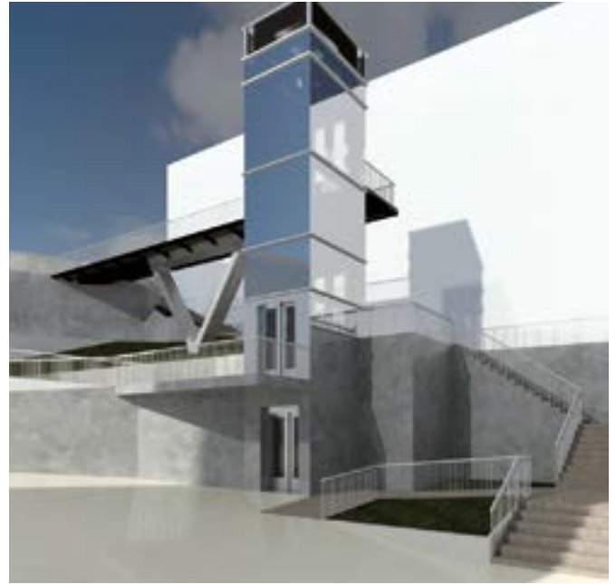
Ubitxa eta San Kristobal kaleak lotuko dituen igogailuak aurtengo inbertsioen partida garrantzitsua hartuko du.