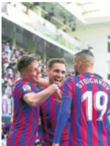
2. Mailako taldeak lidergoa sendotu du.