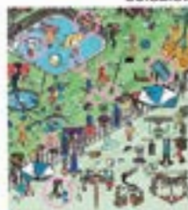
Aurreko astekoan 7 ziren ezberdintasunak