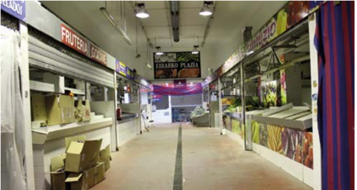
Hamabost urte eta gero, Rialtoeko eraikin barruan zeuden denda guztiak desagertzen joan dira, hutsik geratu arte. SILBIA HERNANDEZ

nahi diegu, merezitako omenaldia eginez, etapa berri honen hasiera aprobetxatuta”.