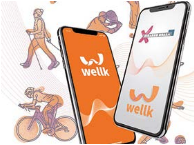
Wellk enpresa teknologiko gazteak sortu du aplikazioa.