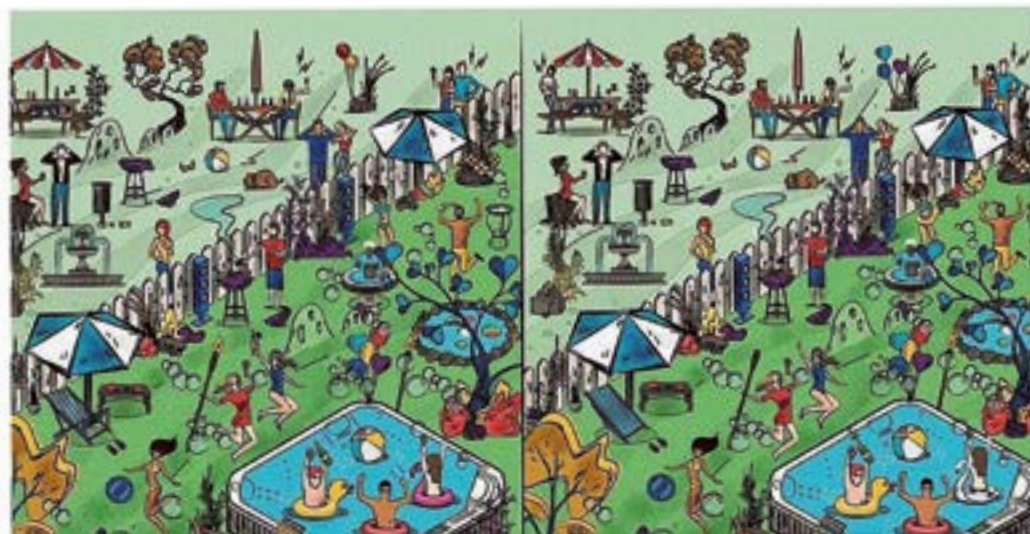
AURKITU 8 DESBERDINTASUNAK