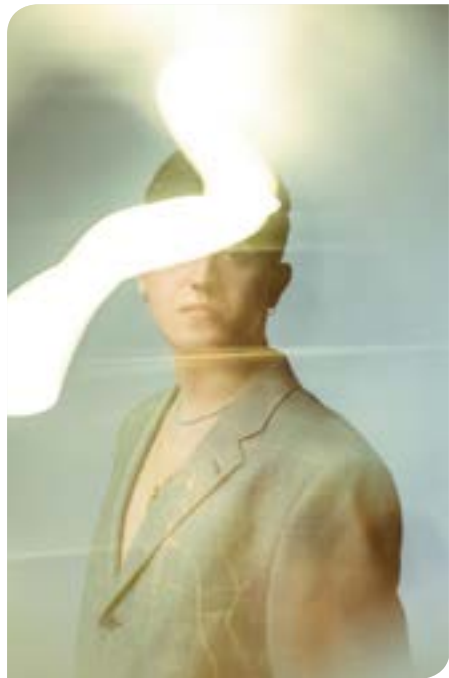
"Ixilduak" inflexio puntu bat da Julenen ibilbide artistikoan. MAITANE CAMPOS