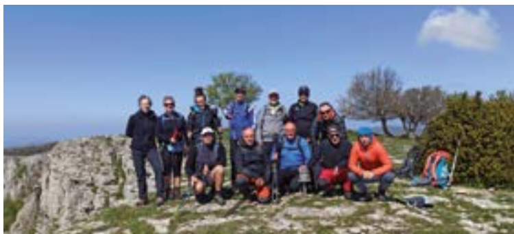
Mendizaleen azken irteerako irudia, Lokiz Natur Parkean.

berdindutako bi partiduak kenduta beste guztiak irabazi dituztelako. Igoera faserako taldea ondo presatzen diharduela beste seinale bat.