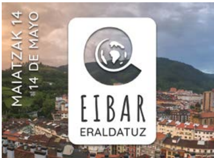
Egoaiziak 'Eibar eraldatuz' proiektua jarri du martxan. EGOAIZIA