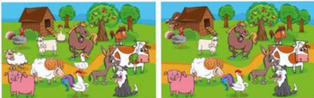
AURKITU 8 EZBERDINTASUNAK