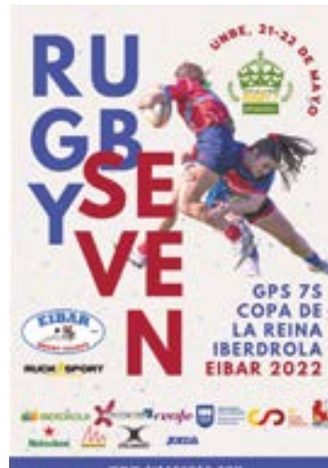
Eibarrek hartuko ditu azken jardunaldiak.

GPS 7s Reina Iberdrola Kopako finalak Eibarren jokatu dira datoren asteko asteburuan. Bi jardunaldiak 09:00etan hasiko dira eta egun osoan jokatu dira. Eibar Rugby Taldeak Rucksport agentziarekin antolatutako egitarauan entretenimendu-guneak prestatu ditu (jantzi-erdi, musika eta zozketak) "bertaratzen diren zaletu guztiek giro onenaz goza dezaten". Ohorezko mailako 12 taldek seven modalitatean jokatu dute Unben, zapatuan