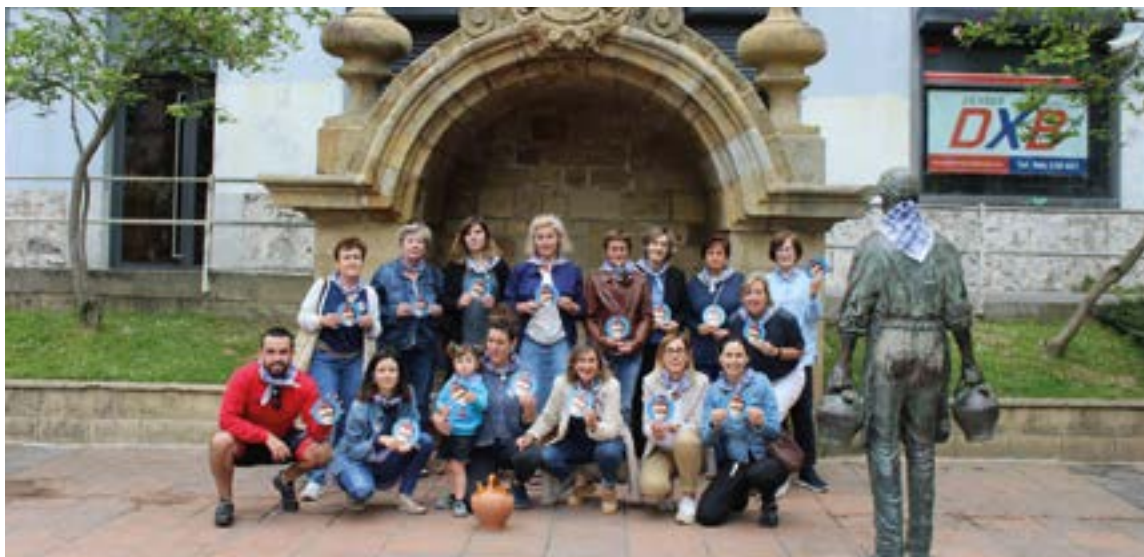
Eguaztenean aurkeztu zuen Eibarko Euskalgintzak aurtengo ekimena. SILBIA HERNANDEZ

gogotsu gaude”. Aurreko urteetan egindakoari jarraituz, eguerdiko 12:00etan Urkizuko iturrian gantxilla urez bete eta Untzagaraino eramango da, eskutik eskura giza katean, “eibartarrok euskaraz bizi nahi dugula aldarrikatzeko. Herriko elkarte eta taldeak gonbidatzen ari gara, baina ekimen irekia izango da, norbanako moduan ere edozeinek har dezake parte”. Jai-giroan egingo da euskararen olatua, “hankapaloak, trikitalariak, musika... Giro polita egongo da, hasieran, ibilbidean zehar eta baita amaieran ere”.