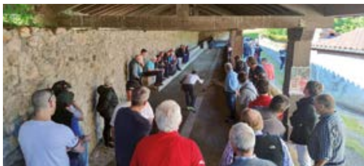
Leintz-Gatzagan jokatutako seigarren tiraldia aurreko asteburuan.

Bihar amateur eta eskola mailakoen txanda izango da Irunen jokatuko den Gipuzkoako txapelketan. Kadete, jubenil eta senior mailakoek Euskadiko txapelketarako txartelaren bila irtengo duten bezala, eskola mailako bi taldeak tituluaren bila kantxaratuko dira eskola-jokoetarako saillkapena lortzeko asmotan.