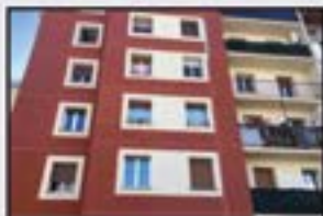
Urki 87.000 € Berritzeko. Igogailuarekin.