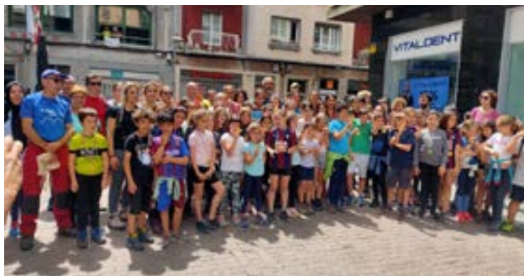
Goian, Finalista Eguneko sari-banaketa. Behean, Arlaban-Elgea irteerakoa.

Ekainaren 18/19ko astebururako iragarri dute Turón de Neouville eta Ref- de la Glere arteko ibilbide hori eta Deporrekoe Elgoibarko Morkaikoko mendizaleekin elkarlanean prestatutakoa da. Lehen egunean, zapatuan, 14 kilometroko ibilbidea osatuko dute, 1.660 metroko desnibelarekin. Tour nabop-etik Ref- de la Glereraino joango dira, bidean 2.506 metroko Pic Lurtet eta 2.547ko Hourquette Mounicot gaudituz. Bigarrenegun, domekan, Ref. de la Gleretik Plateau du Lienz-erajoko dute, tartean 3.035 metroko Turon de Neouville gaudituz. 16,5 kilometrotan 1.080 metroko desnibel positiboa gaudituko dute.