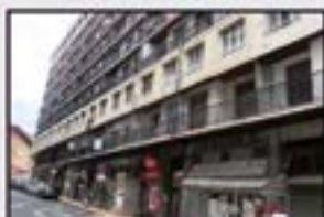
San Juan Kontsultatu Azken pisua. 4 logela, 2 komun. Igogailua kaletik.