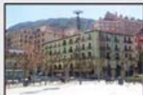
Untzaga 159.000 € Estreinatzeko. 3 logela, 2 komun.