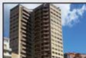
Untzaga Kontsultatu Guztiz berritua. 4 logela, 3 komun, jangela, sukaldea. Trasteroa. Egongela Untzagara begiratzen duen balkoiarekin.