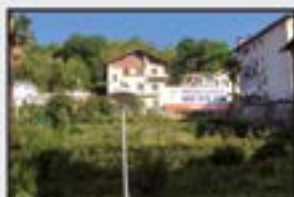
Mekola Kontsultatu Eraikitzen (entrega 2023an). 2 logela, 2 komun, sukaldea, egongela-terrazza (30 m 2 ) Garajea eta trasteroa.