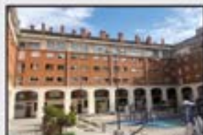
Egiguretarren Kontsultatu Pisu altua. 3 logela, 2 komun, egongela, sukaldea. Garaje itxia aukeran.