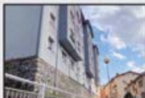
Legarre-Gain 84.000 € 2 logela. Bizitzera sartzeko moduan.