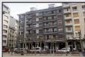
Untzaga Kontsultatu 3 logela. Igogailua eta berogailua.