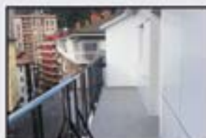
Txonta Kontsultatu Azken pisua, terrazarekin. 3 logela. Igogailua kaletik.