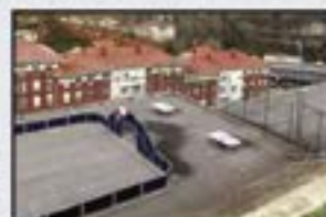
Sautxi Kontsultatu Estreinatzeko. 3 logela, egongela, sukaldea, 2 komun. Trasteroa. Garaje plaza 2.