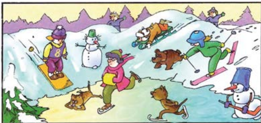
AURKITU 10 EZBERDINTASUNAK