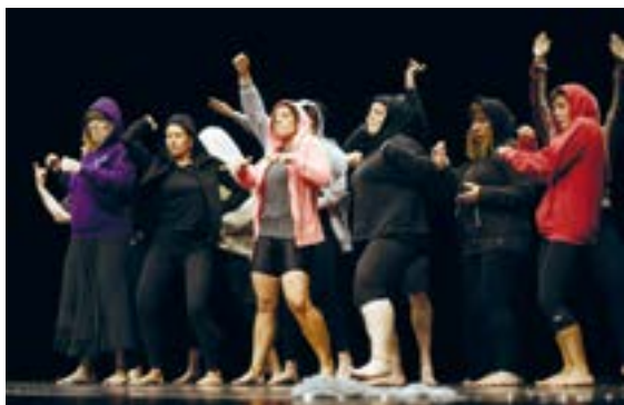
Umeen hiru talde igo ziren eszenatoki gainera. Ondoren, helduen hiru taldeen txanda izan zen.