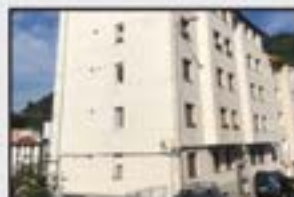
Amaia 95.000 € 2 logela. Bista paregabeak.