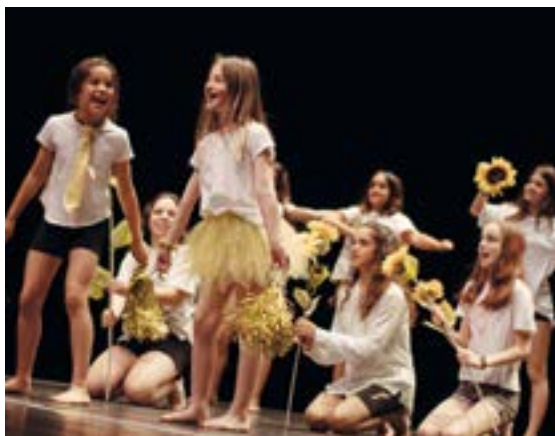
Txikiak hiru antzezlan eskaini zituzten eta primeran aritu ziren. MAITANE CAMPOS

Ikaragarriko esperientzia izan da, taldekideak ezin hobeak, eta irakaslea oso ona. Nahiko lotsatia naiz eta jendaurrean askatzen lagundu didate. Klaseak eta gero, gutako asko pote bat hartzen gelditzen ginen, eta elkar ezagutzeko aukera izan dugu", dio.