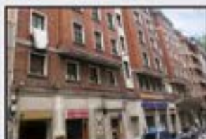
San Juan Kontsultatu 170 m 2 . Hegoalderako orientazioa. Guztiz kanpora begira. Igogailua kaletik.