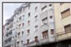
San Juan 148.000 € Pisu altua. Berritzeko. Oso argitsua. 108 m 2 . Igogailua eta ganbararekin.