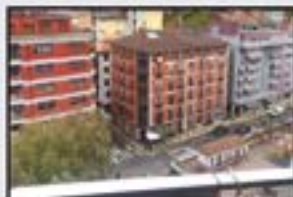
Urkizuko dorreak Kontsultatu Pisu altua. 4 logela eta balkoia. 105 m 2 . Igogailua kaletik.