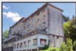
Iparragirre 85.000 € 3 logela, egongela, sukaldea, komuna. Oso eguzkitsua.