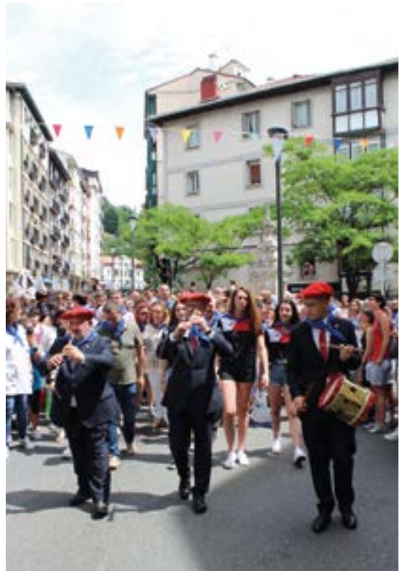
Bi urte eta gero, sekula baino harrera beroagoa egingo diete eibartarrek Lizarratik etorriko diren dultzaineroei.

Eibartar askorentzat bereziki hunkigarria izaten den ekitaldia are hunkigarriagoa izango da, gainera. Izan ere, 2019an izan genuen Lizarrako dultzaineroei horrela harrera egiteko azken aukera. Edozein modutan ere, beraiantzat ere une berezia izango da, askotan esan duten moduan, Eibar bihotzean daramate eta. Eta, ezer esango ez balute ere, nabari zaie gure artean gustora aritzen direla. Izan ere, pandemiak jaiak ospatzea galarazi dituen bi urteetan ere Eibarrera etorri dira, unean-uneko neurrietara moldatuta dultzainarekin eibartarrak alaitzeko asmoz.