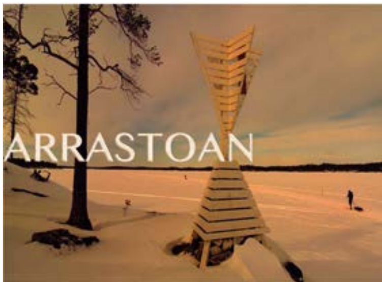
2018ko neguan lau lagunek Laponiara egindako bidaia jasotzen du Pablo Dendaluzeren dokumentalak.