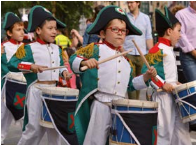
Haurren danborrada San Juan egunean izango da eta 19:00etan irtengo da Urkizutik, Ustekabe fanfarrearekin batera Untzagaraino joateko.