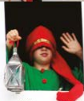
Olinpiada Txikia J-A. Magel Ikastolan 2022/06/11