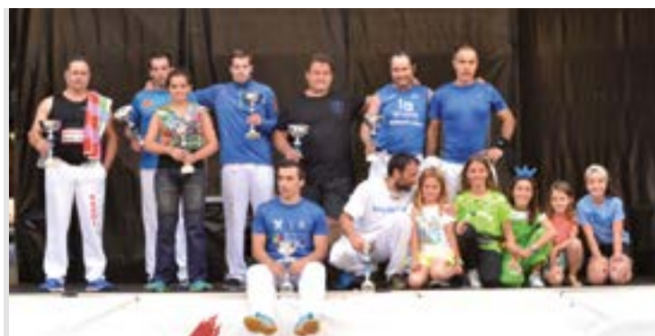
2019ko azken edizioan parte hartu zuten amaierako podiuma, sari irabazleekin.

Denetarik izango du oraingoan ere Euskal Jaialdiak, erakustaldiak eskaintzeaz gain lehiak ere izango duelako bere tarteak, jokoen amaieran erabakiko dena. Hasteko, “hainbat erakustaldi eskainiko ditugu, aizkorarekin zutika, aitzurraz baliatuz eta esku bakarrarekin”. Ondoren, “txingekin eta ingudearekin hainbat erronka prestatuko ditugu, Iparraldeko jokoeekin errematea egiteko”. Lehiaketa nagusia, bestalde, hiru talde osatuko dituzte, binaka aizkolariarekin, “eta harrijasotzeak, aizkora-lanak eta azkeneko korrikaldiak” osatuko dute proba hori.