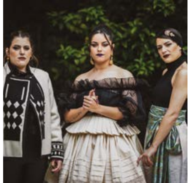
Mundu guztiko doinuak izango ditugu entzungai Sanjuanetan.

eskutik. Afrikar jatorriko taldeak herriko kaleak girotuko dira bere erroetako doinuak eskainiz.