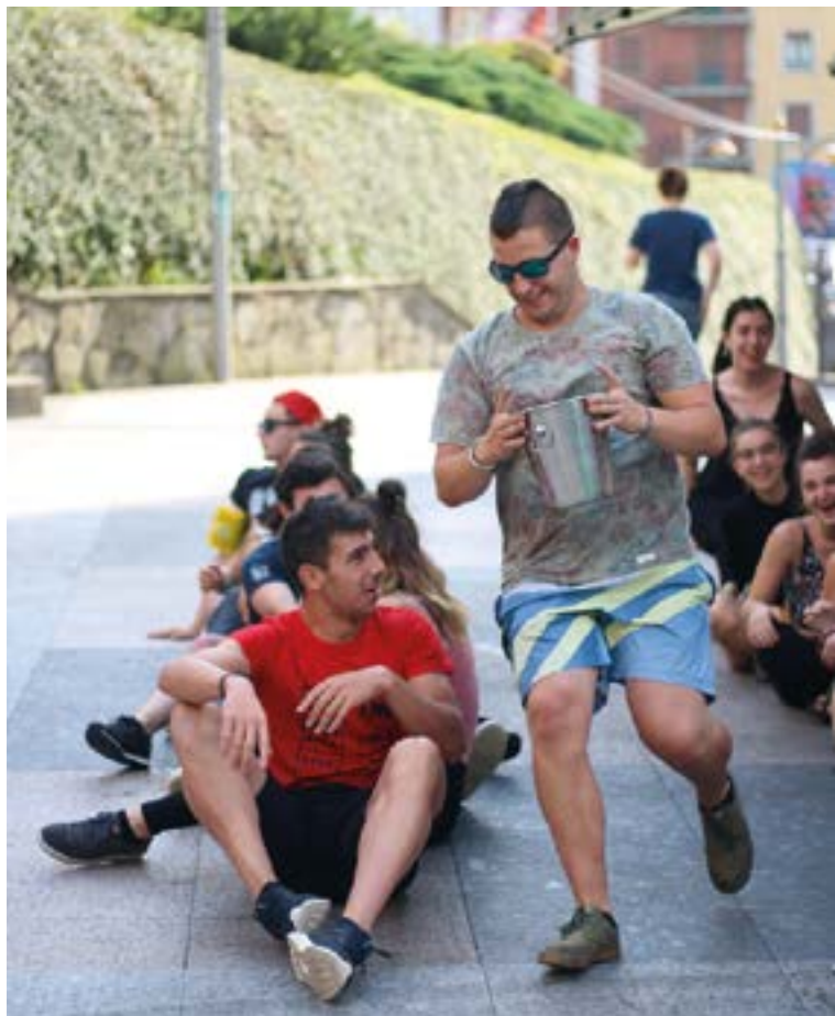
la denetik egin ahal izango da Eibarko Jai Batzordeak prestatu duen egitarauarekin.

Zapatuan, presoen aldeko bazkariaren ondoren, 17:00ak inguruan, Zumarragako Alarma Morea hirukoteak bazkalostea gi-