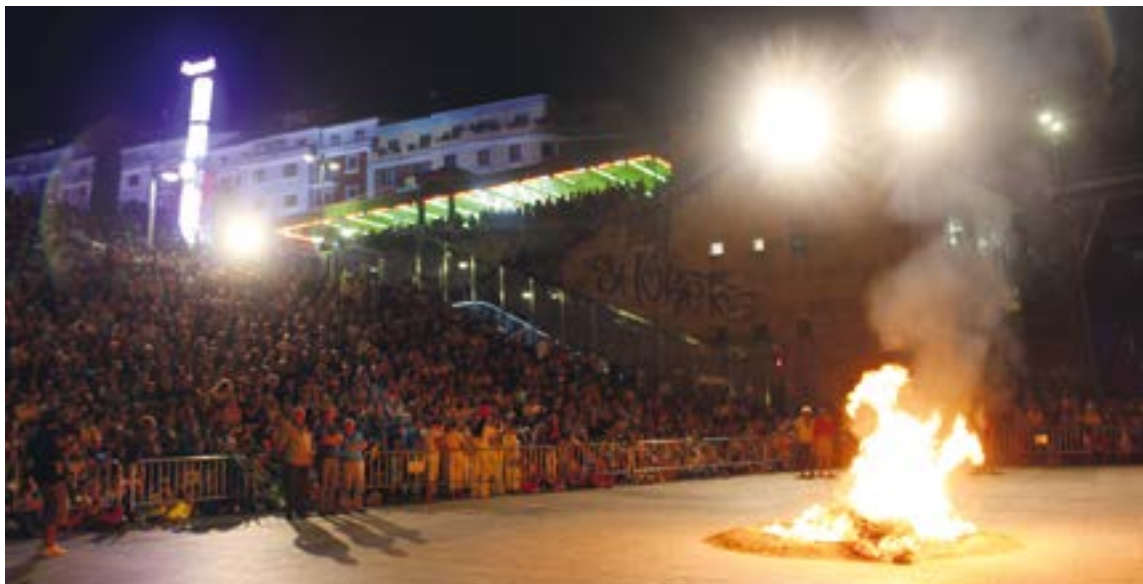
San Juan bezperan ehundaka lagun bilduko dira Untzagan San Juan suaren inguruan. MALEN JAINAGA

hona pasiatzen. Dantza horretan eztanda egingo dugu eta konfinamendua etorriko da ondoren. Maskarak agertuko dira, gure bizitzan beste elementu bat bezala agertu ziren konplementuak, eta pandemiaren ondorioz hil direnak gogoratuko ditugu. Horren ondoren, Fenix hegaztia azalduko da eta, egundoko musikaz lagunduta, gimnasia erritmikoko neska bat zinta gorri batekin irtengo da. Orduan, Neomak taldekoen laguntzarekin sorginak ekarriko ditugu eta, azkenik, goian amaituko dugu Su Ta Gar-en musikaren laguntzarekin”, aurreratu digu.