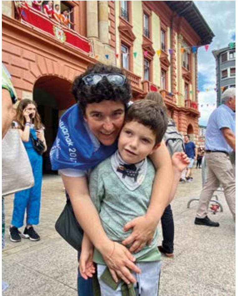
Erabiltzaileek, familiek, profesionalak eta boluntarioek izugarriko pisua daukate Aspacen, eta hori azaldu dute "50 urte inklusioa bermatzen" erakusketa ibiltariaren bitartez. A. GARIN

Bisibilitatea eta normalitatea funtsezkoak dira Aspaceko umeentzat, eta "herrietako ekitaldi desberdinetan, adibidez multikiroletan edo festetan, edozein ume bezala parte hartu beharko lukete. Agintariei helarazi nahi diegun mezua da gure eskola beste edozein eskola bezalakoa dela, Eibarkoa, herrikoa. Askotan ez dira konturatzeko eta gogorarazi egin behar zaie. Umeak konturatu egiten dira, eta ikustea modu inklusibo batean parte hartu dezaketela... horrek ez dauka preziarik. Eskerrak gizarte