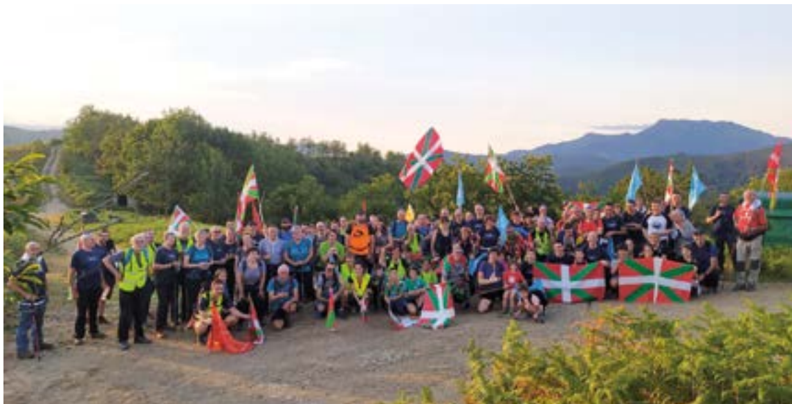
Soraluzetik, Debatik, Itziartik eta Eibartik berrehun lagun inguru abiatu ziren Etxalar aldera, Kokori mendilerroa argizatuzera. EGOITZ UNAMUNO