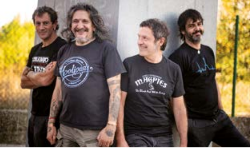
Evaristoren Tropa do Carallo talde berriaren kontzertu bakanetakoa izango da gaur.