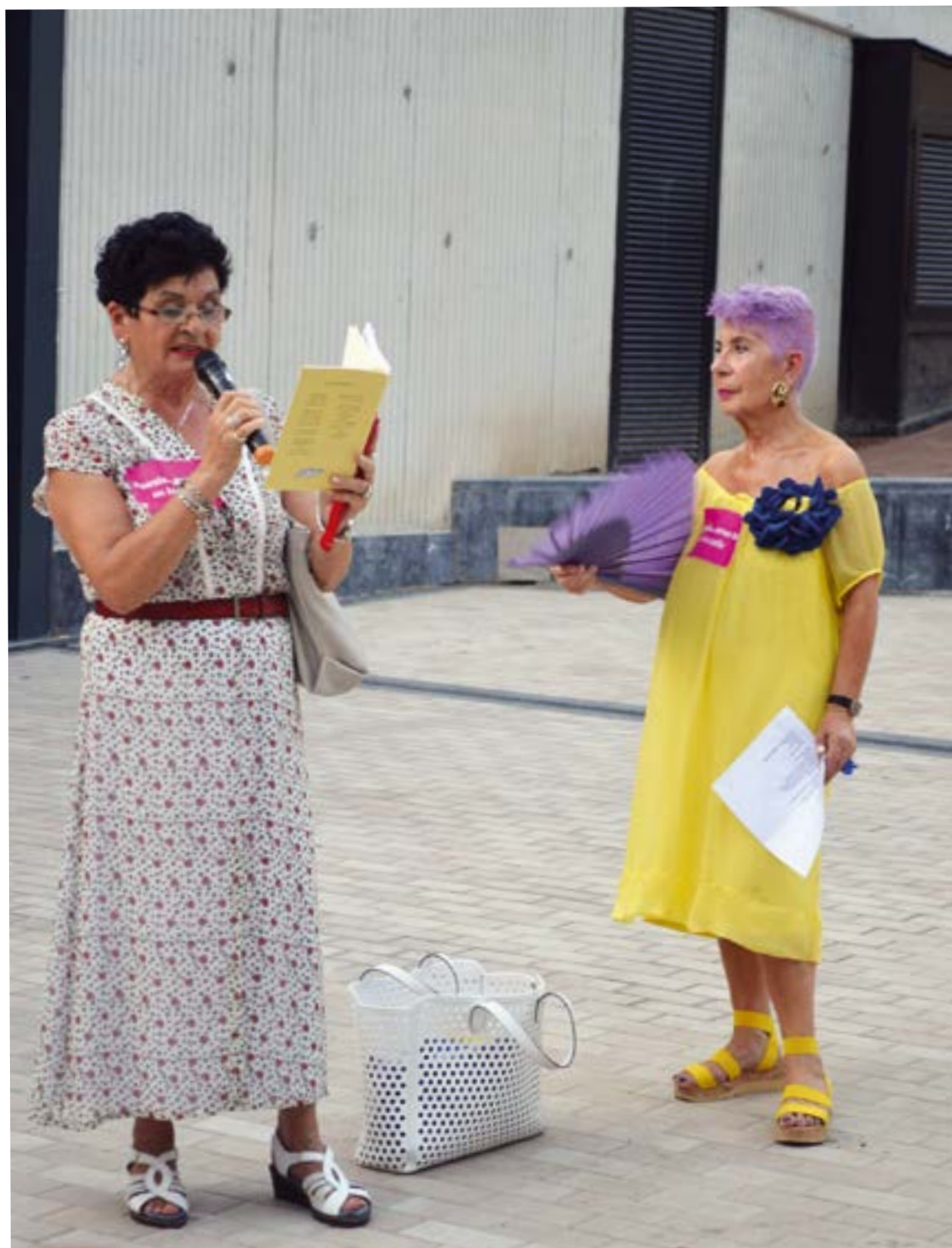
Poesiak ere badu interpretaziotik. POESIA...ERES TÚ