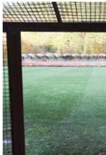
Atxabalpe, aurrendenboradiko gune.

2. Mailako liga hasierako hainbat partiduk ere badute, dagoeneko, euren ordutegia. Horrela, Garitanoren taldeak Tenerife hartuko du Ipuruan abuztuaren 13an, zapatuan, 17:00etatik aurrera. 1. Mailara igotzeko ateetan geratu ziren bi taldeen arteko lehia izango da denboraldia hasteko. Ligako bigarrenen eibartarrek Villarreal B igo berriari egingo diote bisita, abuztuaren 19an, 19:00etan. Eta hirugarren jardun-