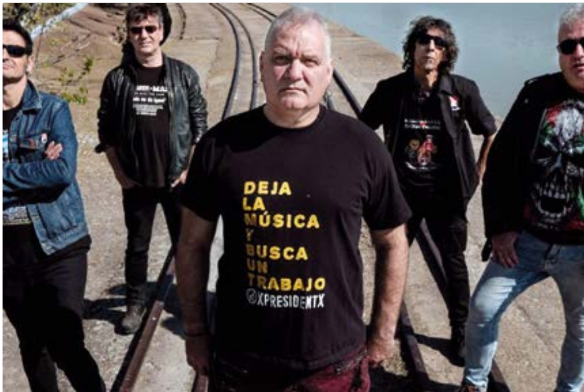
Reincidentes taldeak emango dio amaiera gaurko musika emanaldiari. REINCIDENTES

Izan ere, musika egiten duen taldea baino gehiago zarete, jarraitzaile sutsuak dituzuelako eta komunitate handia sortu duzuelako zuen inguruan. Hori sentitzen duzue?