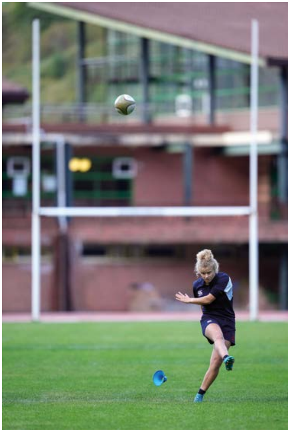
Tiro batekin bi txori hegan. RAMONBEITIA