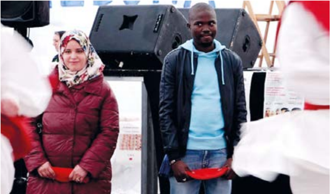
Immigrazio teknikariak zenbait jarduera berreskuratu nahi ditu eibartarron bizikidetzaz sustatzeko.

orduan ondo legoke Udaleko Ingurumen Sailekoekin elkarlana egitea.