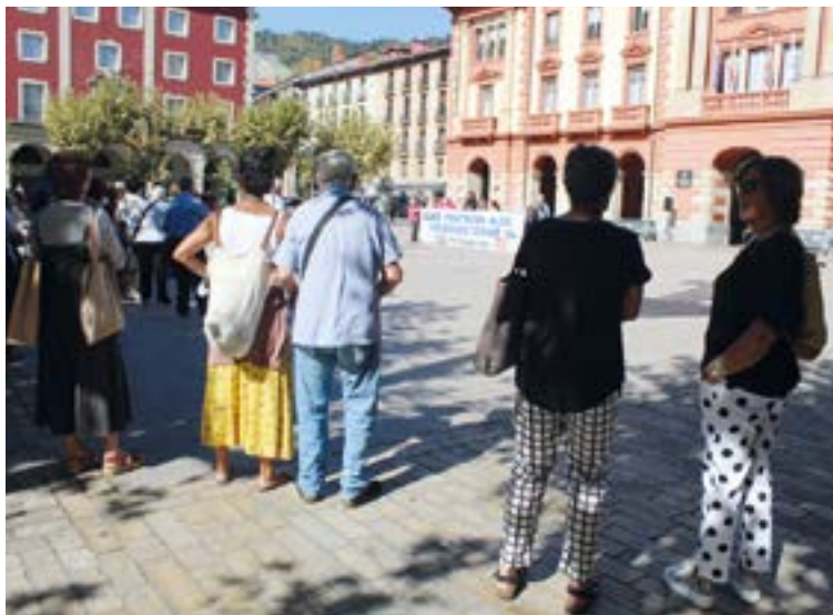
Eibarren ere astelehenero egiten dute protesta, 12:00etan Untzagan. SILBIA