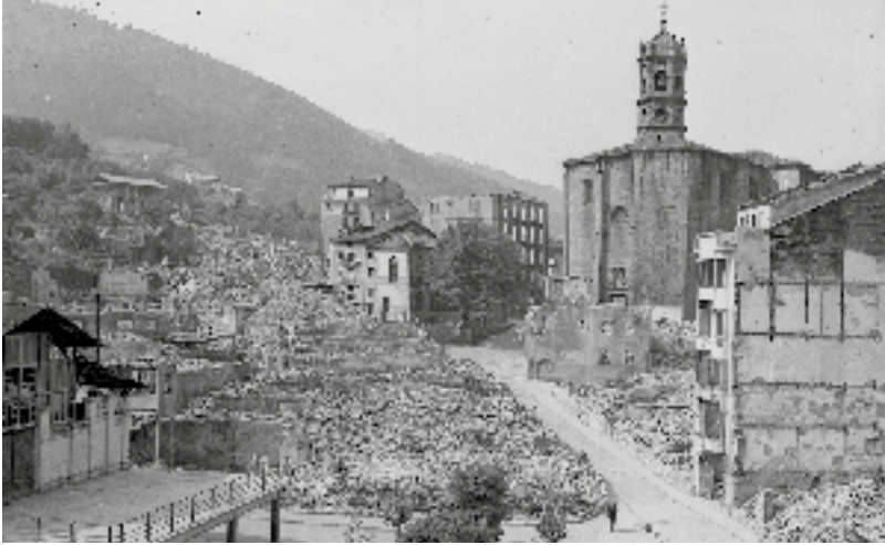
Barrenkale eta Arraindegikale kaleak suntsituta, bonbardaketa eta gero (1937). INDALECIO OJANGUREN

Arraindegi kalea nolakoa zen. Iturria, okindegia, tailerrak, Kalixtoren arotzeria, bainuetxea... Potxotxaneko labaderoa eta beste okindegi bat. Taberna. Barrenkalean, sastreria. Parean, eliza eta parkea.