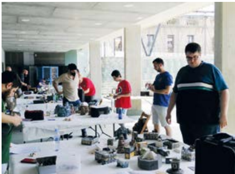
Aurtengo San Juan jaietan ere hainbat joko ezagutzera ematen egon ziren Odisea elkarteak Errebal Plazan, egitarau apalago batekin.