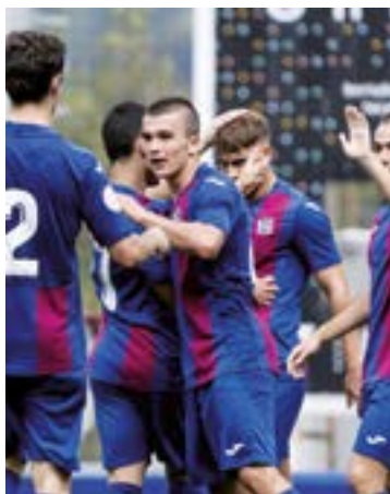
Vitoria filiala bere multzoko liderra da.