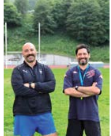
Ibarburu eta Young, taldeko arduradunak.

Domekan Unben Rioja hartuta hasiko duen lehenengo fasean Eibar Rugby Taldearen partiduak honakoak izango dira: etxean, Arrasate (urriak 16), Getxo B (azaroak 6) eta