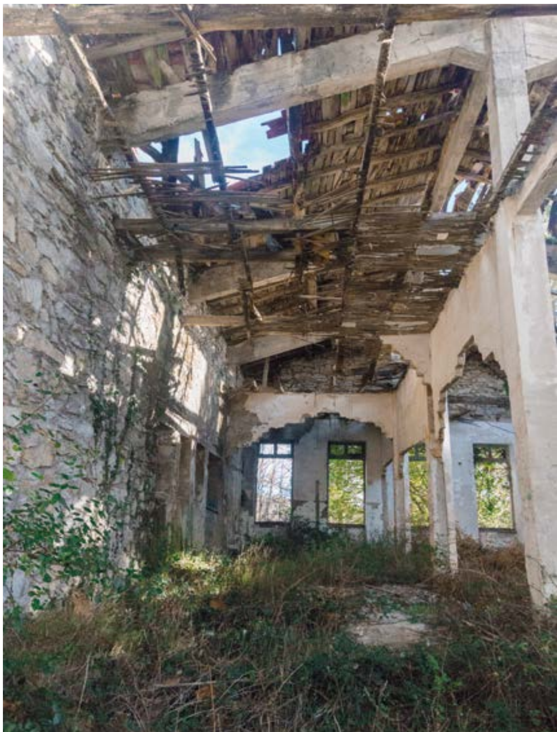
Santa Kurutzeko eskola. FERNANDOSOLANA