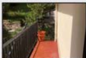
Jardineteta 95.000 € 3 logela, egongela, sukaldea, komuna. Bi balkoiarekin. Oso eguzkitsua.