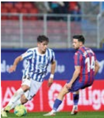
Eibar FT-k asteburuan Malaga bisitatuko du.

Astelehenean Espainiako Foball Federazioaren egoitzan egindako Kopako lehen kanporaketaren zozketak Eibar FT-k Las Rozasen jokatzeko erabaki zuten berriro. Partidu bakarrera jokaturako den kanporaketa izango da eta azaroaren 12an, 13an