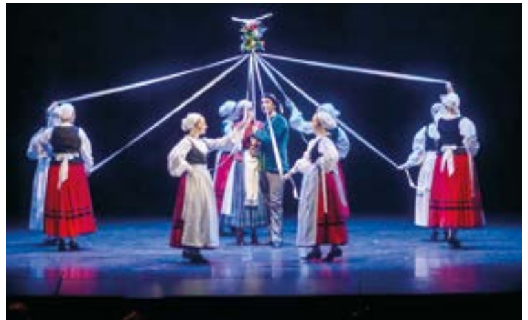
Goian, Martin Zalakain antzezlanean parte hartu duten Kezka Dantza Taldeko kideetako batzuk.