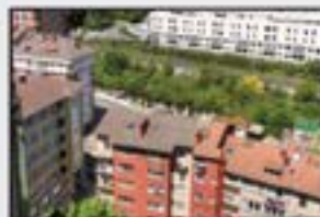
Iparragirre 75.000 € 3 logela, egongela, sukaldea, komuna. Guztiz kanpora begira. Bista paregabeak.