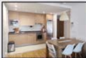
Toribio Etxebarria Kontsultatu Eraikin ia berria. 3 logela.