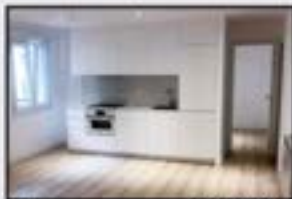
Urki 159.000 € Estrenatzeko. 2 logela. Igoailua 0 kotan.