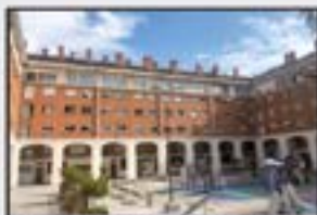
Egiguretarren 215.000 € Pisu altua. 3 logela, egongela, sukaldea, 2 komun. Eguzkitsua. Igogailua eta berogailua.