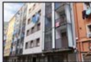
Urki Kontsultatu Bizitzera sartzeko moduan. 2 logela, egongela, sukaldea, komuna. Igoailua 0 kotan.