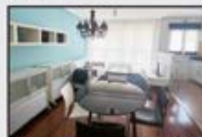
Sautxi 145.000 € Bikaina. 2 logela, egongela, sukaldea, 2 komun. Trasteroa eta garajea.