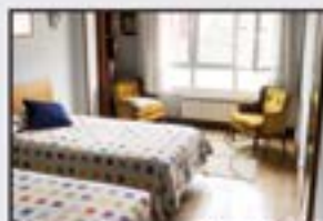
San Juan Kontsultatu Azken pisua. 4 logela, egongela, sukaldea, 2 komun. Igoailua 0 kotan.