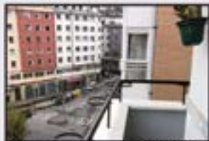
Sostoaatarren 108.000 € 70 m 2 . Balkoiarekin. Bizitzera sartzeko moduan.