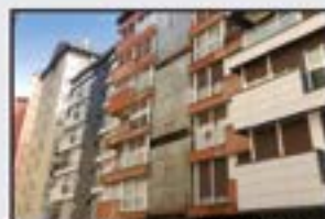
Romualdo Galdos Kontsultatu 3 logela, egongela, sukaldea, komuna. Balkoiarekin. Igoailua, berogailua eta ganbara.