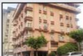
Miguel de Aginaga Kontsultatu 3 logela, egongela, sukaldea, komuna. Ganbararekin. Igoailua 0 kotan.