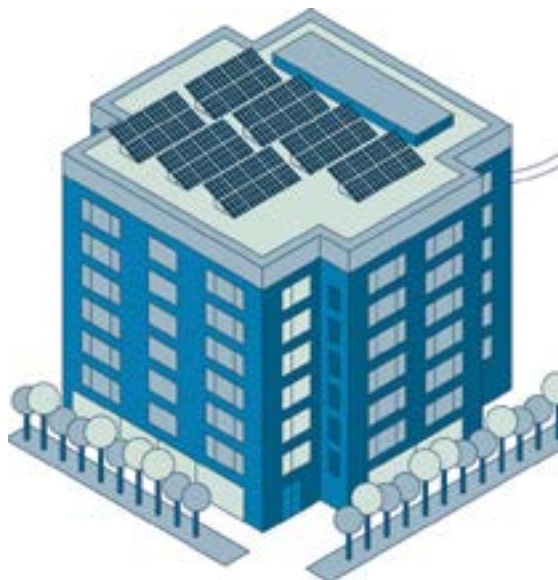
Energia Bulegoan gero eta kontsulta gehiago jasotzen dituzte eguzki-plaka fotovoltaikoaren instalakuntzaren inguruan.

Berotze-sistemen inguruan galdetzen digute nagusiki. Gasaren eta elektrizitatearen egoera