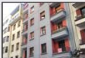
Bidebarrieta 198.000 € 150 m 2 . Bi etxebizitza egiteko aukera. Igogailua.