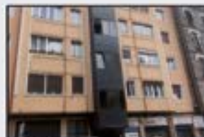
Barrena 120.000 € 3 logela, egongela, sukaldea balkoiarekin, komuna. Berriztua. Igogailua 0 kotan. Gas natural berogailua.