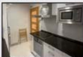
Muzategi Kontsultatu Erdiguneko apartamentua. Primerakoa.