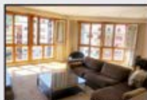
Muzategi Kontsultatu 125 m 2 . 3 logela, egongela handia, sukaldea, 2 komun. Garaje ibxia eta ganbara handia.