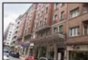
San Juan Kontsultatu 170 m 2 . Eguzkitsua. Guztiz kanpora begira. Igoailua 0 kotan.