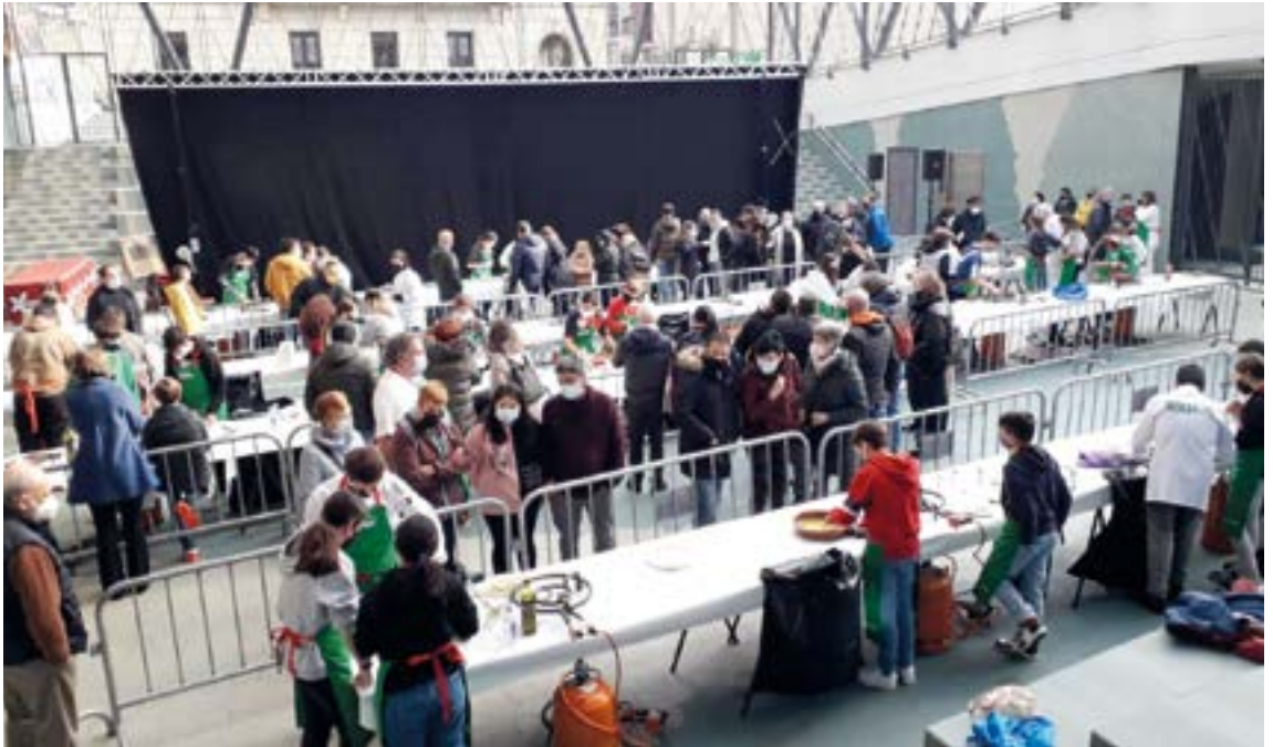
Domeka goizean Errebal Plazan egingo den San Andres Eskolarteko XVIII. Bakailao Txapelketan 32 bikotek hartuko dute parte.