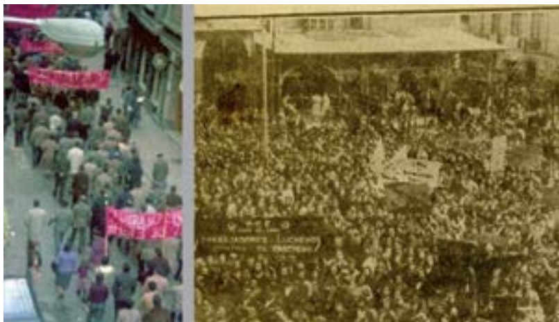
Eibarren jai horren ospakizunari buruz Udal Artxiboan ditugun lehen albisteak 1904koak dira.

Umetan maiatzaren 1a nola ospatzen zuten gogoratzen du: bandera gorriak manifestazioetan, etab.