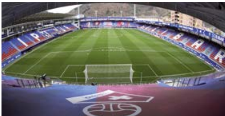
Sarrerak astebete lehenago agortuta, Ipuruak inoiz baino zaletu gehiago bildu ditzake etzi.

Domeka arratsaldean, 19:00etatik aurrera, jardunaldiko partidu interesgarriena jasoko duen Ipurua zelaiak inoiz izan duen sarrerarik handiena izan dezake. Partidu horretarako sarrera guztiak agortu ziren astelehenerako, eta domekan Ipuruan 7.000 lagunetik gora biltzea espero da. Ipuruak 8.164 ikusleen aforoa du eta horietatik 6.000 jarlektatik gora abonatuena dira. Alavesekoei 306 sarrera bidali zitzaizkien eta, gehiago eskatu badituzte ere, Eibar FT-k ezingo die gehiago bidali. Partiduak interes berezia du, batez ere igoerari begira, eta Alaves 2. Mailako Liga SmartBank-eko liderra da gaur egun; eibartarrak lau puntura daude eta garaipenak arabarrendandik puntu bakarrera lagako lieke Garitanoren mutilei.