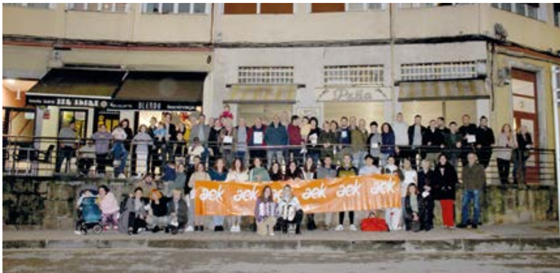
Urtero bezala, aurten ere euskaltegi parean dagoen Paloma tabernan elkartu ziren ikasle eta irakasleak, beraiekin Gaztaiñerre ospatzera animatu zirenekin batera kalejira eta ondra-janak egiteko. SILBIA HERNANDEZ