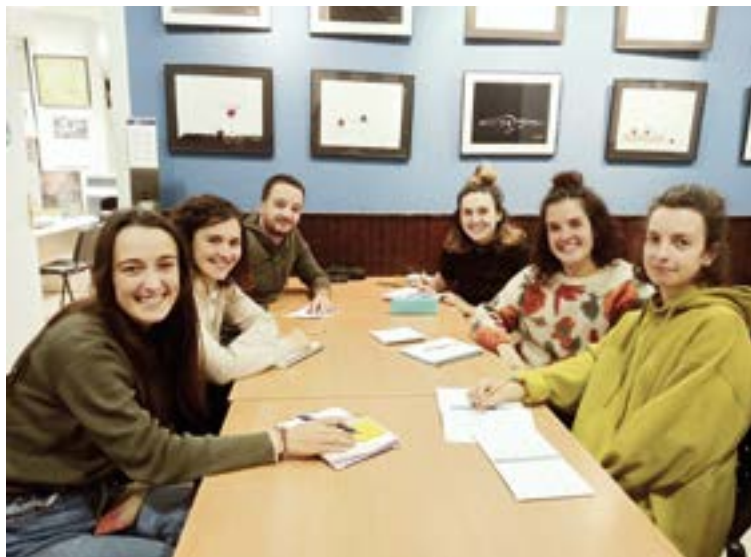
Martitzenean egin zuten egitaraua lotzen joateko bilera, Klub Deportiboan. SILBIA HERNANDEZ