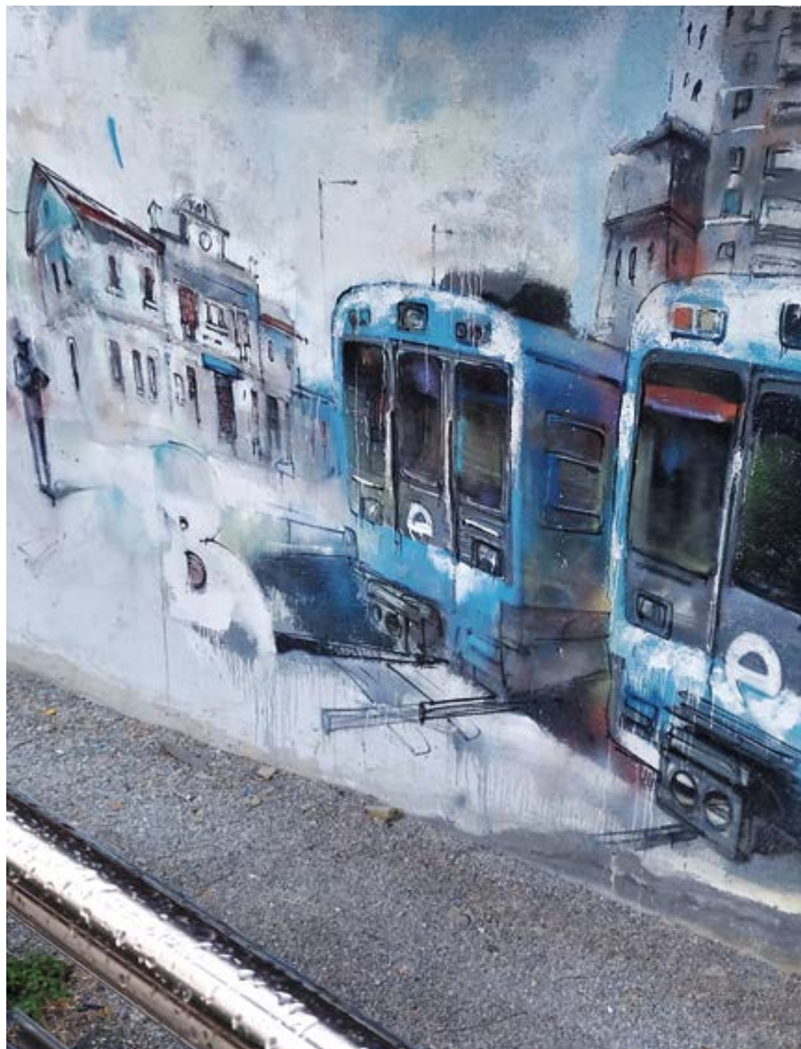
Trenbideari atxikitutako tren parea. BAKARNEELEJALDE