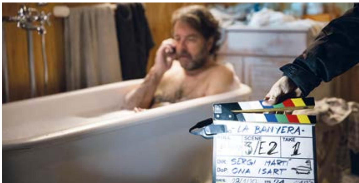
'Sari nagusia irabazi duen La banyera' film laburraren grabaketaren irudia.