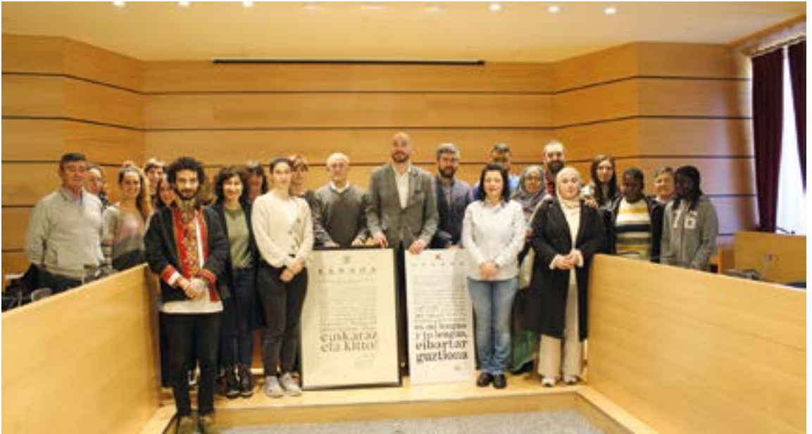
1982ko alkatea eta 2022koa, bando zahar eta berriarekin. Ekitaldian, euskararen alde lanean diharduten kideekin batera, jatorri ezberdineko herritar talde batek hartu du parte, Eibarren dagoen hizkuntza-aniztasunaren ordezkari gisa. SILBIA HERNANDEZ