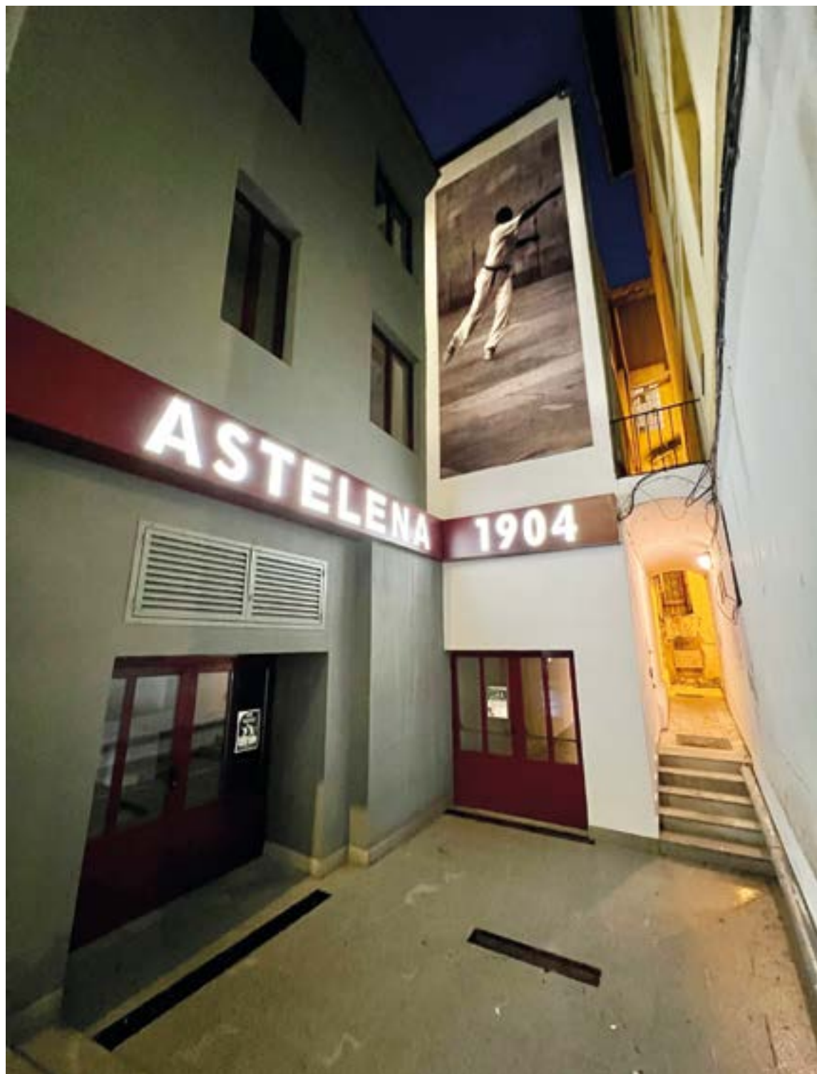
Katedralaren atari berria. RAMONBEITIA