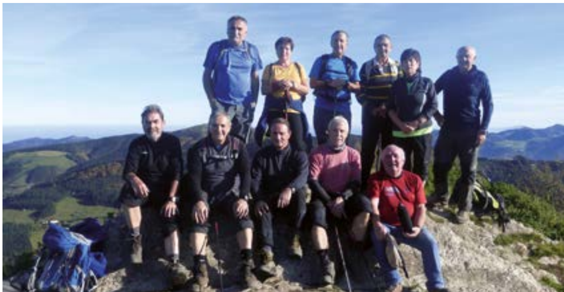
2017ko azaroaren 16an osatu zuten Krabelin taldekoek lehenengo "EHko 100 Mendi Ederrenak" Urko igoera eginez.

metro batzuk eskumara gelditzen da. Igoerekin jarraituz pista batera iritsi gara eta, gora eginez, Elorreta Goikoa baserrira hurbildu, hau ezkerrean utzi eta lurrezko pistatik altura hartzen segitzen dugu; honek laster ezkerretara egiten du eta, pista hau utzi gabe, Urrestiko (10:25) lepora ailegatu gara. Mendi gandorrean gaude, eskumara hartu eta, bidezidorra utzi gabe, Urkoko (795 m) (10:45) tontorrera heldu gara. Eguraldi oso garbia daukagu eta Gipuzkoako eta Bizkaiko mendi nagusiak gure aurrean ikus ditzakegu. Jaisteko, Eibar aldera doan bidea hartu dugu (Hego) ezkerrean jotzeko eta, Ixuako norabidea erakusten duen karteltxo bati kasu eginez, lagatzen dugu (11:00), langatxo bat pasatuz. Bideak Ixuako mendatera garamatza eta, hau gurutzatuz, errepide batek Usartzara igotzen gaitu; horiturria eta mahai batzuk dauzkagu. Gunea pasa eta berehala bidegurutzte batean gaude; ezkerretara doan pista hartu eta 20 bat metro aurrerago, gure eskuman, pinudi batean gorantz egiten duen bidezidorra hartuko dugu Akondiako (749 m) (11:55) tontorretaino.