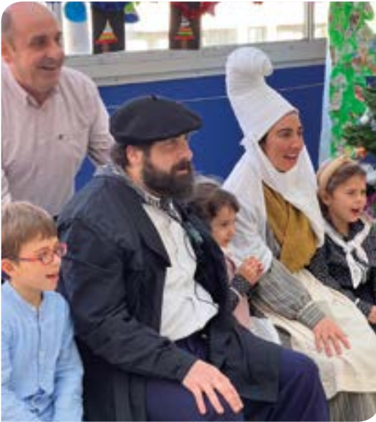
Mari Domingi eta Olentzero herriko eskoletan egon dira azken egunotan. EKHI BELAR