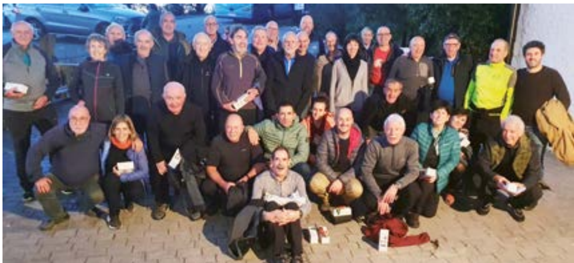
Deportiboko Mendi Batzordekoen azken irteeran parte hartu zutenek bazkari batekin agurtu zuten denboraldia Deban.

Trena hartu dugu goizeko 9etan Eibartik Ermura joateko, eta geltokitik bertatik hasi gara oinez (9:13), gorantz, ambulatorio aldera doan errepidetik; laster (9:20) gure ezkerrean ikusten dugun bidezidor batek abiatuko gara, aldapa pikoak Artarraira (406 m) (9:40) garamatzala. Bere buzoi berezia bidezidorretik