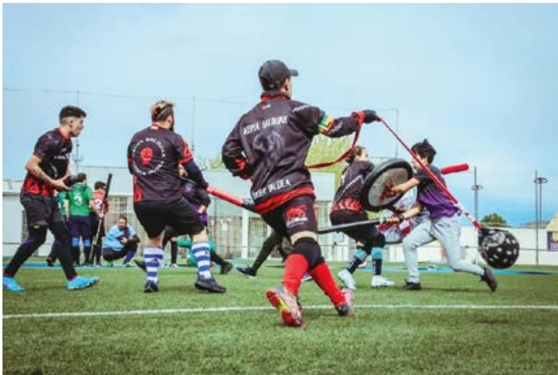
Taktikek eta estrategiek berebiziko garrantzia dute juggerrean. ARIMAGALDUAK

Entrenamenduak domeketan egiten ditugu, Bergaran. Aldagelak eta gauzak lagatzeko tokia ematen dizkigute eta, tira, horrekin moldatzen gara. Gainera, taldekideak nongoak garen ikusita, guztiontzat da erraza bertara heltzea. Lehen Txaltxa Zelaian entrenatzen genuen, jende artean eta, euria bazegoen, kioskoan, baina horia ez dago lekurik. Bestetik, normalean hilean behin jokatzen dugu txapelketaren bat penintsulako iparraldean. Hiru-lau orduko bidaiak egiten ditugu jokatzeke. Datorren hilean Neguko Kopa jokatuko dugu Murtzian, baina hori izango da egingo dugun bidaiarik luzeena. Txapelketa horretan Arima Galduakeko hiru kide ibiliko gara, eta Bilboko beste lagun bat eta beste toki batzuetako jokalariek batuko zaizkigu taldera. Taldea betetzeko gutxieneko jokalariek ez baditugu, beste talde batzuei jokalariek eskatu eta taldea osatzen dugu. Beti dago talde batean finko ez dagoen jendea. Lagun giroa da nagusi, beraz? Edo badago lehia suitsua? Partiduetan lehia dago, baina baita barreak, txantxak eta besarkadak ere. Gero, kamisetak trukutzen ditugu eta elkarrekin bazkaltzen dugu. Kirol-legez jokatzen dugu.