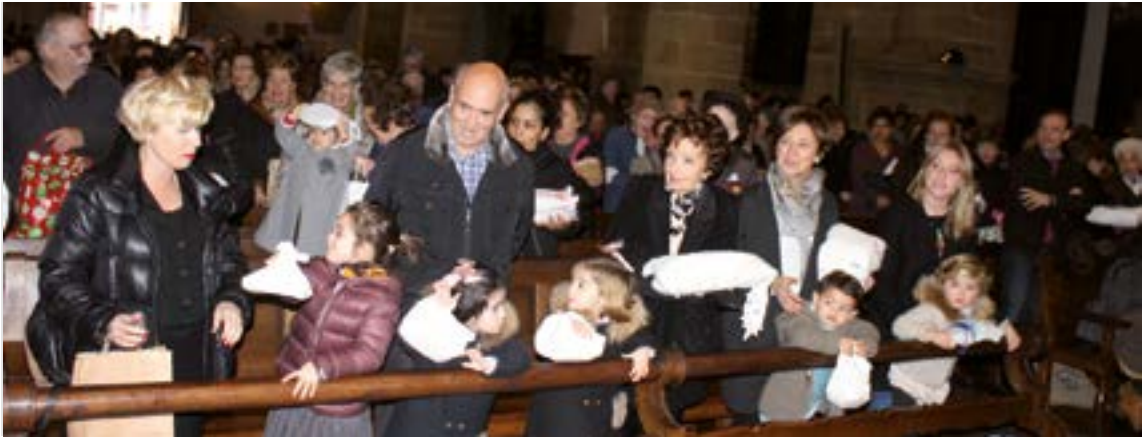
Belaunaldiz belaunaldi transmititzen joan den tradizioa dugu San Blas egunekoak.

joaten ginen, opilak ez ezik, laranja ere eramaten genituela. Maiz zalantza larrian irteten ginen, bedeinkazio orduan opilak eta laranja ahelik goren altxatzen genituen arren ia ur-bedeinkatu tantarik heltzen zitzagun ala ez; haurrok uste baikenuen beharrezkoa zela urak ikutzea”. San Blas egunez goizetan eskoletan jai egiten zen orduan.