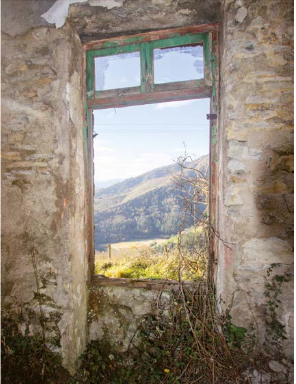
Barru zein kanpo, naturak jango gaitu bapo. FERNANDOSOLANA