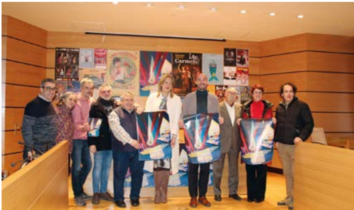
Astehenean udaletxeko pleno aretoan egindako aurkezpen ekitaldian, agintari eta antolatzaileez gain, edizio honetan parte hartuko duten hainbat lagun ere egon ziren.