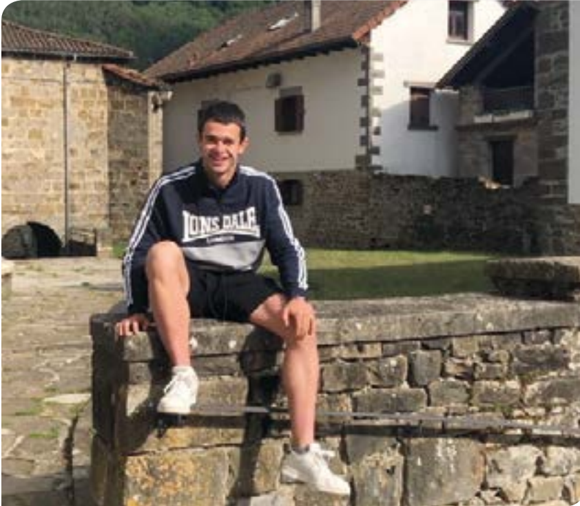
Deba bailarako GKS-ko kideek mobilizazioen berri eman dute eskualdean. GKS

“Gure helburua langileriaren interesak erdigunean jarriko dituen programa sortzea da”