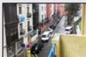
Jardineteta 98.000 € 2 logela (bat balkoiak), egongela, sukaldea balkoiak, komuna, ganbara. Bizitzera sartzeko. Gas-kalefakzioa.