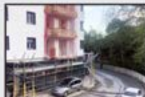
Errekatzu 118.000 € 2 logelako etxe kapritxosoa. Guztiz berrituta.