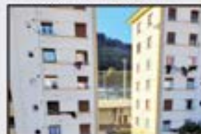
Romualdo Galdos 140.000 € Pisu altua. Guztiz kanpora begira. 3 logela, egongela, sukaldea, komuna. Ganbara. Igogailua 0 kotan.