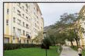
Santa Ines 105.000 € 3 logela, sukalde-jangela, komuna. Guztiz kanpora begira. Kalefakzioa eta igogailua.