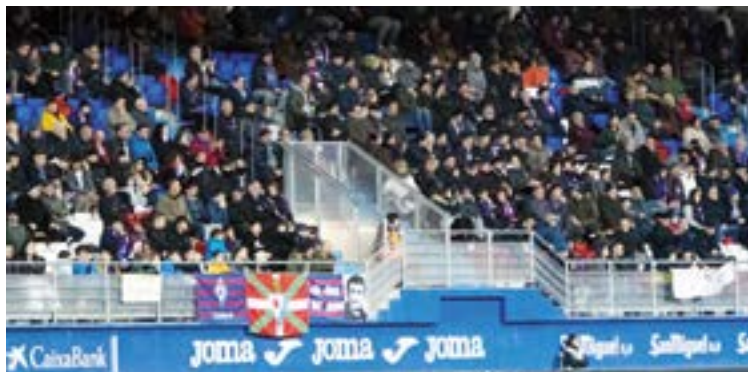
Eibar FT-k zaletuen laguntza ere izango du gaur Ipuruan jokatu den neurketan.