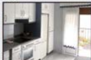
Urki 112.000 € 2 logela, egongela, sukaldea balkoiarekin, komuna. Gas-kalefakzioa. Igogailua 0 kotan.