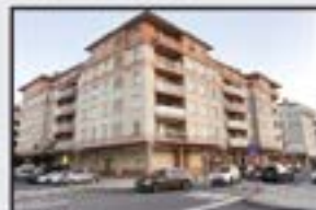
ZUMAIA Etxebizitza bikaina. 3 logela, egongela terrazarekin, sukalde handia, 2 komun, ganbara. Garaje-plaza. Igogailua 0 kotan.