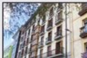
Bidebarrieta Kontsultatu Pisu altua. 3 logela, 2 komun, sukaldea, egongela. Ganbara handia. Garajea (eta trasteroa). Etxerako sarrera zuzenarekin.