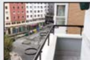
Sostoaarren 108.000 € 3 logela, egongela, sukaldea, komuna. Gazteentzako egokia. Bizitzera sartzeko moduan. Gas-kalefakzioarekin.