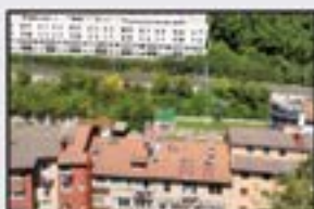
Iparragirre 75.000 € Pisu altua. Eguzkitsua, guztia kanpora begira. 3 logela, egongela, sukaldea, komuna. Kalefakzioarekin.