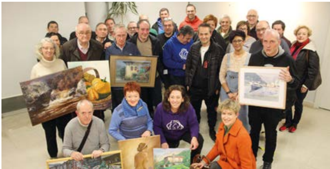
Zaporeak elkarteari laguntzeko erronka antolatu eta laguntza eskaini duen jendea. SILBIA HERNANDEZ

behar baitzaio jaten”, diote ekimenaren antolatzaileek.