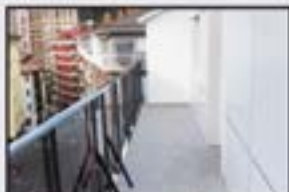
Txonta Kontsultatu Atikoa terrazarekin. 3 logela, egongela, sukaldea, komuna. Igogailua 0 kotan. Kalefakzioa.