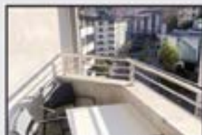
Ego-Gain Kontsultatu Atiko bikaina. 3 logela (batean terraza, beste bat duplexa). 2 komun, sukalde-jangela. Garaje itxia aukeran.