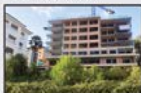
Mekola Kontsultatu Eraikin berria. 2 logela, 2 komun, sukaldea, egongela. 32 m 2 ko terraza. Trasteroa eta garajea. Aurten amaitzeko.