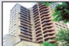
Untzagako dorreak Kontsultatu 146 m 2 . Guztiz berrituta. Terrazarekin. Igogailua 0 kotan.