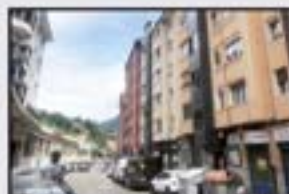
Barrena 120.000 € 3 logela, egongela, sukaldea balkoiarekin, komuna. Berrituta. Igogailua 0 kotan.