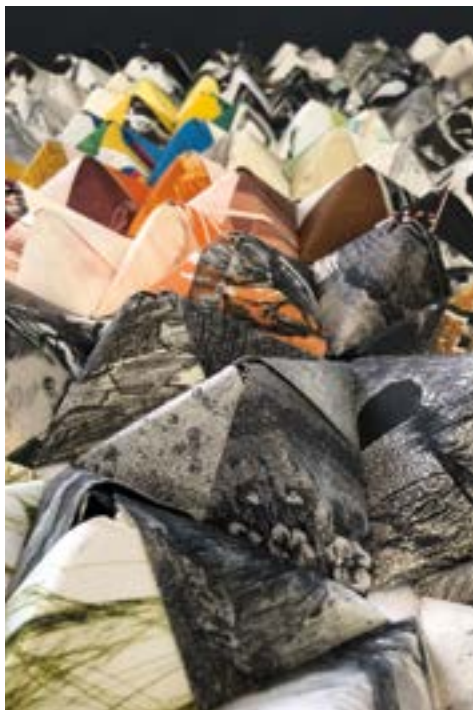
Erakusketako pieza bat.. ARTEKOM