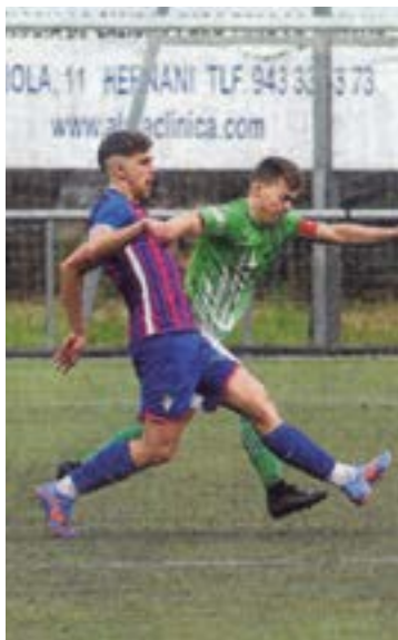
Eibar Urkok lidergoa eskuratu du.

Eibar FT-ko filiala eta bigarren taldea, euren ligak amaitzeko jardunaldi gutxiren faltan, denboraldiari amaiera bikaina jartzen ahaleginduko dira. Ez da lehen aldia lurraldeko Ohorezko Mailan jokatzeko duen taldea, liga irabazi eta gero, ezin igo geratzen dela justu irabazitako mailan, 3. RFEF-n, Vitoria filiala dagoelako; horregatik, beharrezkoa izango litzateke azken horrek ere mailaz igotzea, biek ezin dutelako maila berean jokatu. Une honetan, nahiz eta denboraldia kaxkar samar hasi, Eibar B-k lidergoa eskuratu du dagoeneko, atzetik duen Añorgari lau puntu atereaz, Hernaniri bost, Elgoibarrerri sei eta Oiartzuni zazpi; azken honi, gainera, 5-0 irabazi zion azken jardunaldian Unben. Liga