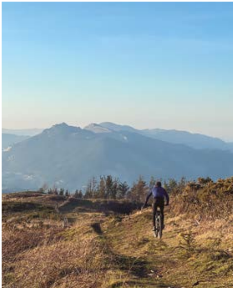
Kalamua mendian Markina-Xemeini dagokion gunea ezarri dute eolikoak jartzeko gune optimo bezala.

eraikitzeke pieza erraldoiak: Elosutik garraiatuko lituzkete, horretarako, mendi gainean zehar 5 metro zabal eta 8 kilometro pasatxo lituzkeen errepidea eraikiz, aerosorgailuak ezarriko lituzketen kokalekuraino. Horrekin batera, aurreproiektuan aipatzen ez zuen “dorre meteorologikoa” eraikitzeke asmoa ere azaltzen da ingurumen txostenean. Hirugarren dorre hori 101 metro garai izango litzateke eta txostenean diotenez, eraikitzeke, “gutxienez” 520 m 2 -ko plataforma eraiki behar-ko lukete. Bestalde, txostenak dorre eolikoak muntatzeko era-