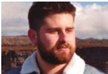
DANEL DE PRADO ENERGIA BERRIZTAGARRIEN INGENIARIA

Debabarrean energia berriztagarrien kuota areagotu beharra agerikoa da; hidraulikoak eta olatu-energiak osatzen dute (autokontsumoaz gain) 2,5 MWko potentzia instalatuko sorkuntza ahalmena, energia-menpekotasuna handia delarik. Gaur egun, aerosorgailu bakar batek potentzia hau erraz hiru-