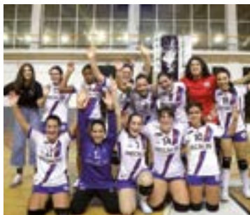
Kadete mailako nesken taldeak garaipen handia lortu zuen, Bidasoari 20-29 irabaziz.

Mecalbe Eibar Eskubaloiko bi talde nagusiek eskualdeko aurkariak izango dituzte asteburu honetan. Ohorezko Zilarrezko mailan jokatzen duen emakumezkoen taldeak Lauko Ermuko Errotabarri taldearen bisita izango du bihar arratsaldean, Ipurua kiroldegian 18:00etan hasiko den partiduan. Ermukoak sailakpenaren erdialdean daude, eibartarren aurretik, eta ez da erraza izango garaipen-