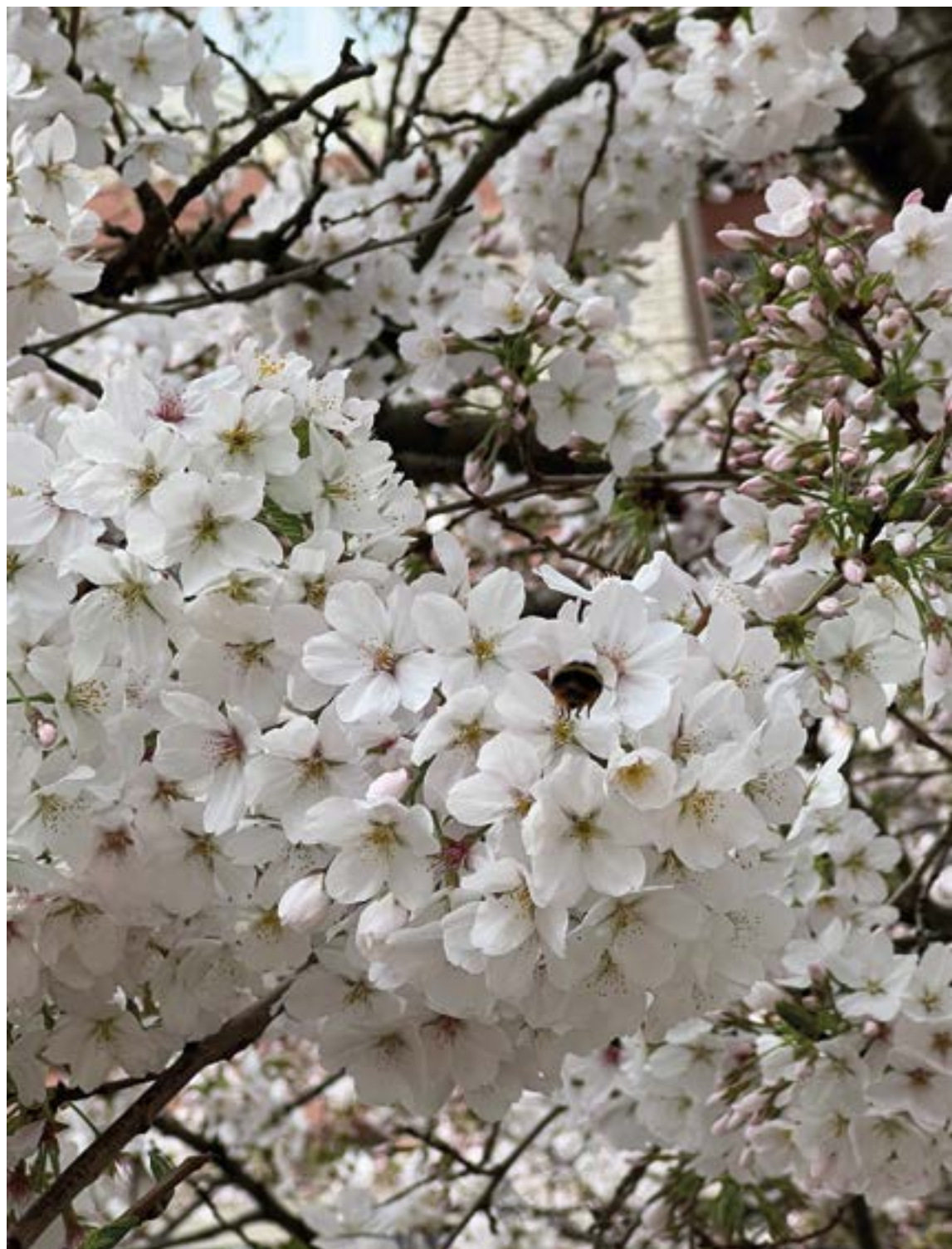
Urkiuko zuhaitzak loratzen. EKHI BELAR