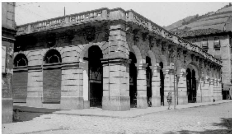
Eibarko sozialistek Untzagan egindako Herriaren Etxearen fatxada. INDALECIO OJANGUREN