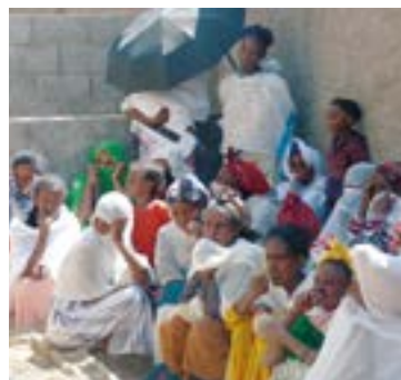
Lankidetzaren proiektuaren helburu nagusia kaltetutako landa-komunitateen errehabilitazio sozioekonomikoan laguntzea da.

du eta bizitzen jarraitzen du. Gure laguntza oso ondo hartu zuten, bi urtetan ez baitute kanpoko laguntzarik jaso. Bereziki hunkigarria izan zen bortxaketak jasan zituzten emakumeen testigantza zuzena jasotzea”.