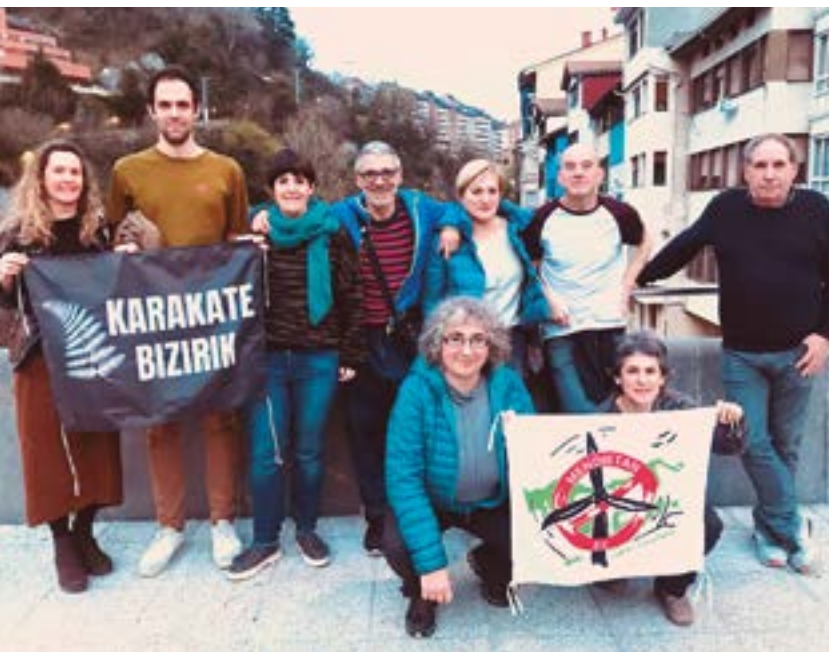
Karakate Bizirik plataformako hainbat kide.