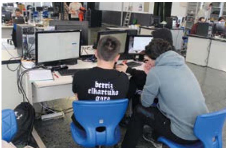
Erdi eta Goi Mailako heziketa zikloak eskaintzen dituzte Armerian eta UNIn. ANAIZPURUA

Zalantzarik ez dago azken urteetan aldaketa handiak eman direla Lanbide Heziketan, oro har, eta baita euskarari dagozkion aspektuetan ere, eta eboluzio horretan irakasleagoa eta ikastetxeetako barne funtzionamendua ahaztu ezin diren faktoreak dira. "Lehen irakasleek gaztelaniara jotzen zuten, eta hori aldatzen joan da. Lanbide Heziketako irakaslegoaren eskalduntzeak sekulako gorakada izan du azken 10 urteetan, ezagutzari eta jarrerari dagokionean. Gainera ikastetxe barruan dagoen dokumentazio guzti-guztia euskaratuta dago. Azkenean gauza batek bestea dakar", diote.