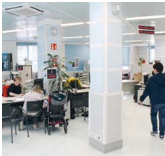
Aitortpena euskaraz egiteko hainbat aukera daude.