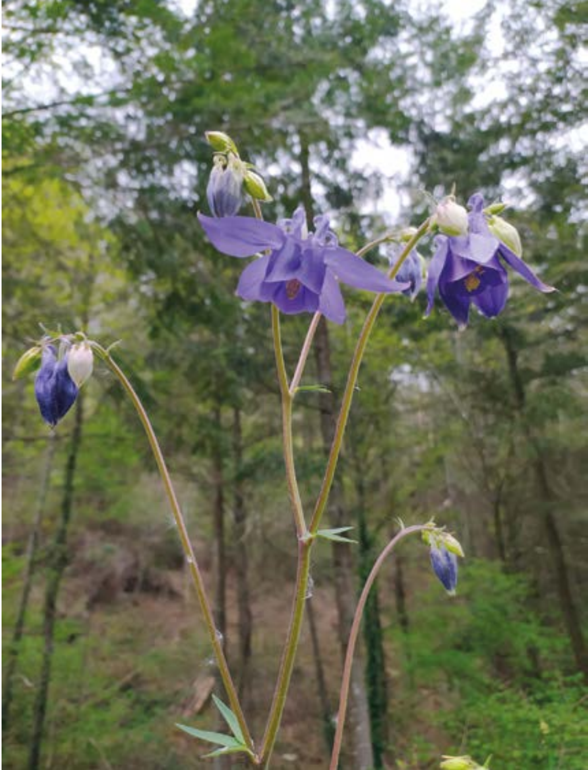
Kukua kantuan eta kuku-belarra loretan. LEIREALBERDI