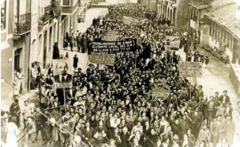
Manifestazioa Eibarren, 1930. urte inguruan.