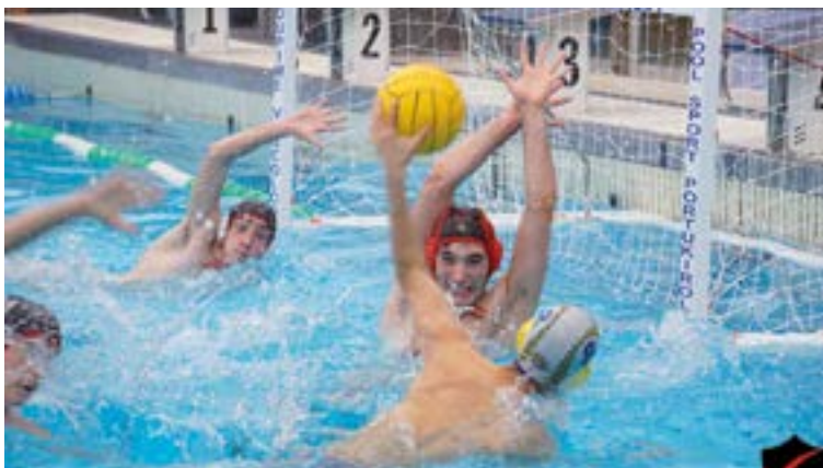
Atsedendian 7-3 galtzen ari zen partidua iraultzeko gai izan zen Urbat, 9-11 irabazteko.

Senior mailan ere, baina emakumezkoen taldearen kasuan, horiek finalerditik kanpo geratu ziren, Santoñarekin berdindu ondoren, penaltietan 16-17 galdu eta gero. Orbeakoek beste partidu bat ere jokatu zuten, Askartza indartsuaren aurka, 5-18 galduta ere “etorkizunera begira ondorio aberatsak