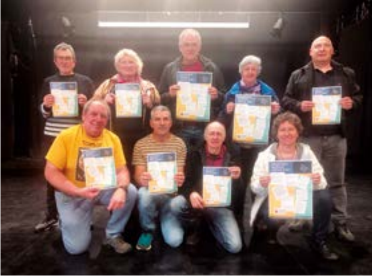
Herri ezberdinetako taldeek osatzen duten Baso Biziak Plataformak Elgetan, Espaloia kafe antzokian, egin zuen bi urteko ibilbidearen berri emateko agerraldia.