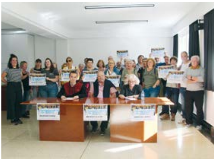
Eibarko Pentsionista Taldeak, Ernai gazte erakundeak eta Matraka eta Nalua talde feministek deitu dute bihar 12:00etan Untzagan hasiko den manifestazioa.