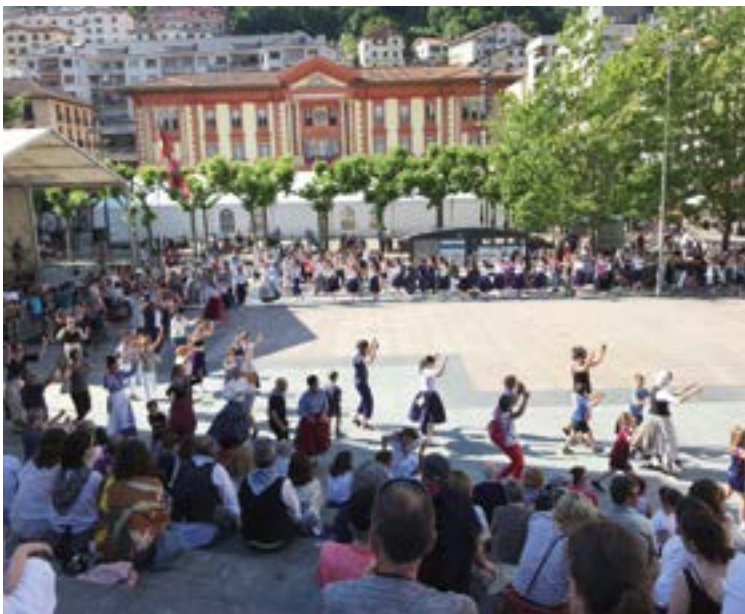
Erromeria eta Larrain-dantza saio biek amaituko dira aurtengo Euskal Jaikak.

Ahaztu baino lehen, eta antolatzaileek dioten bezala, “asteburu osoan, ekimenak dauden bitartean behintzat, barra egongo da, Ernai eta Nalua taldeen eskutik”. Badakizue, beraz, joan prestatzen zuen baserritar jantziak! Kaletik egun horietan dotore-dotore ibiltzeko!!