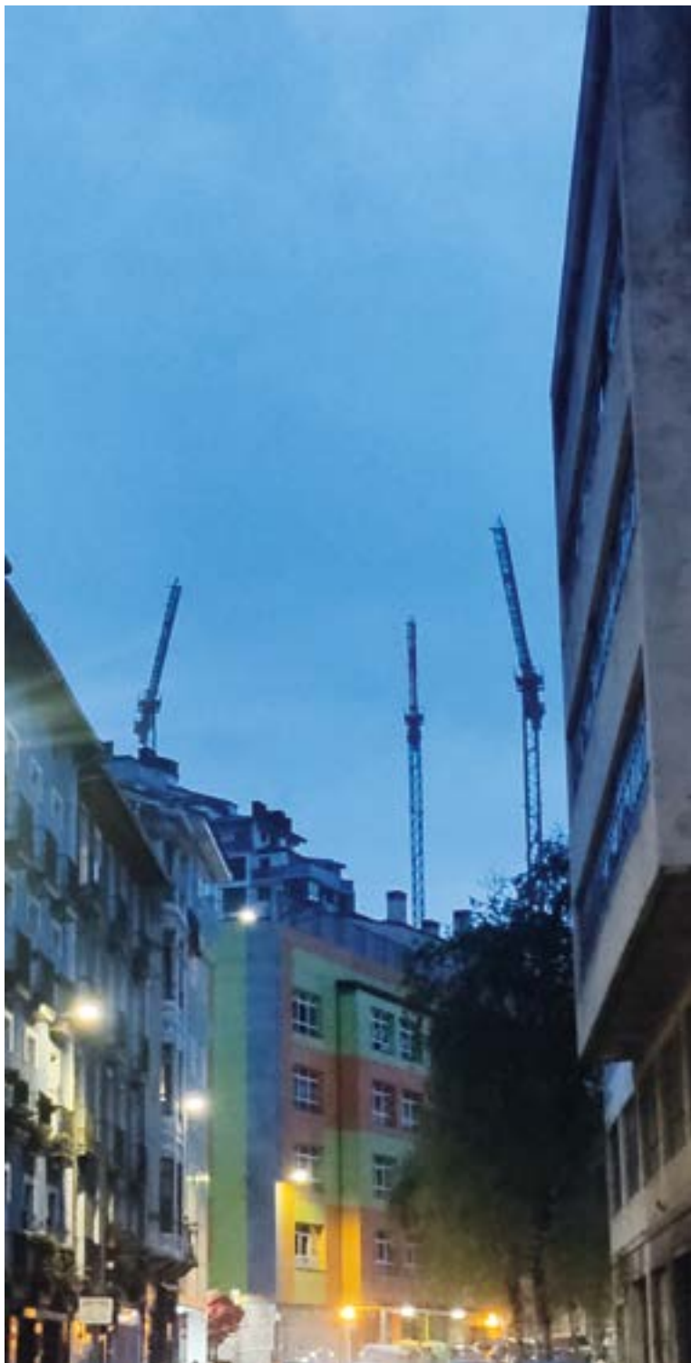
Eibar "hazten" ari da?. ESTEBAN VOUILLOZ