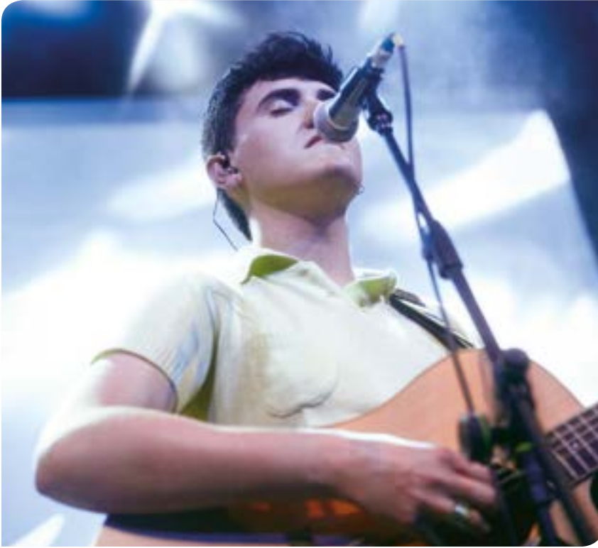
Arlo artistiko ezberdinak batzen dituen proiektua da 'Julen'. JULEN

“Liburuan gure ibilbidea kontatuko dugu, kantuei irudia emango diegu eta sortu dugun mundu hau zer den azalduko dugu”