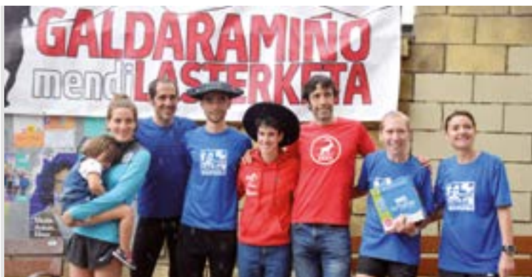
Eibartarrak ere izan genituen lasterketaren podiumetako postuetan.