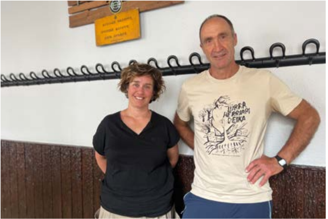
Deporreko artxibo digitala eta irudi berriua aurkeztuko dute martitzenean.