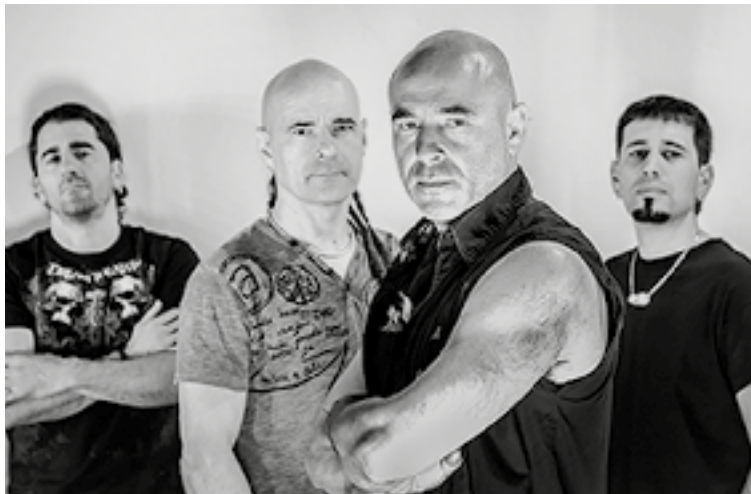
Gaurko kontzertua oso berezia izango da Su ta Gar taldearentzat, etxean bertan jotzeaz gain aspaldiko lagunekin partekatuko duelako eskenatokia.