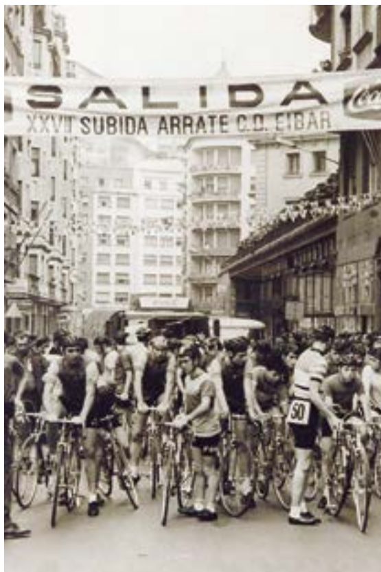
1967 urteko Arrate Igoeraren irteera Dos de Mayo kalean.