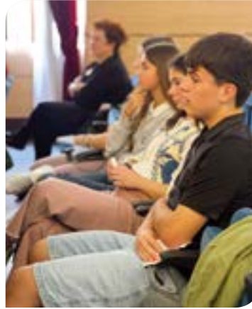
DBH-ko ikasleek taldeka azaldu zituzten euskararen inguruan egindako hausnarketak. EKHI BELAR