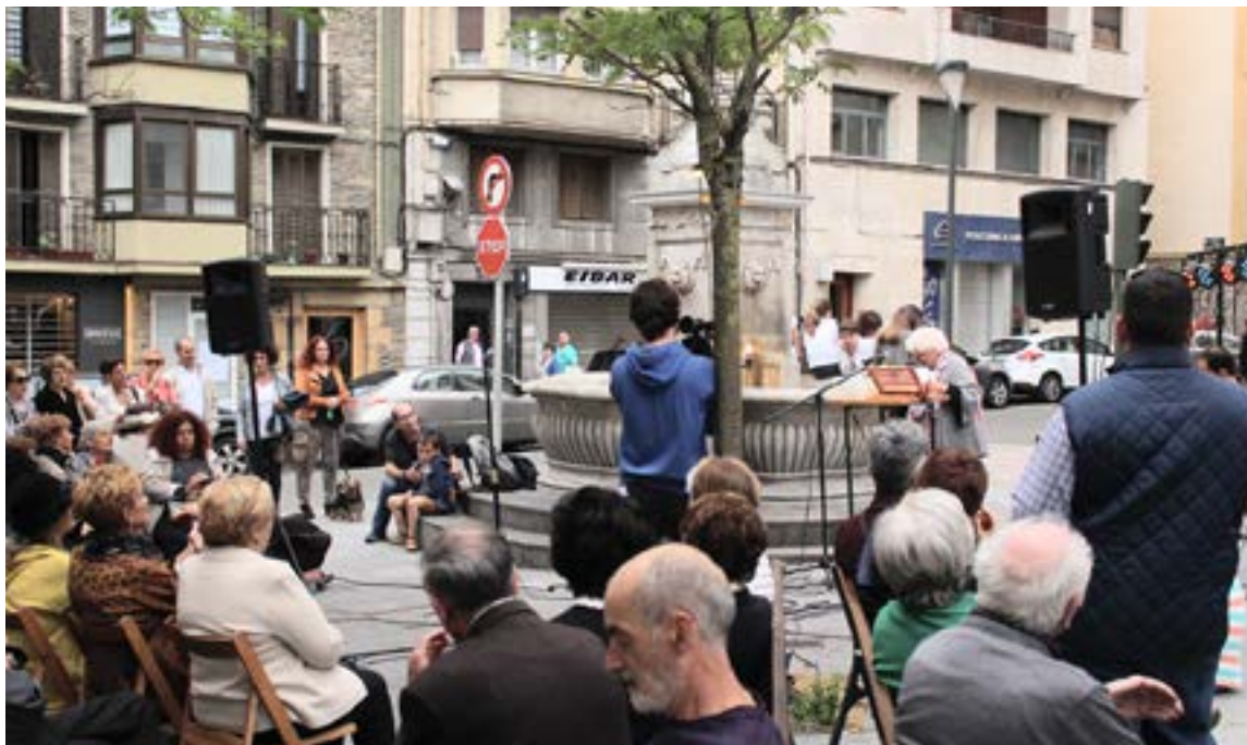
Publikoak oso ondo erantzun du orain arte egin diren bederatzetako edizioetan.

>>> Euriarengatik eta pandemiarengatik beste toki batzuetan egin behar izan dute batzuetan, baina Ibarkurutzen egin ohi da beti saioa