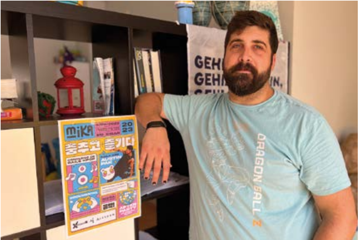
Mika Fest jaialdia antolatatu du Udalko Kultura sailak Hego Koreako kultura herrira hurbiltzeko. EKHI BELAR

berba egin eta hilabeteetan buruari bueltak eman ondoren, baiezkoa eman nion. Izan ere, aukera hau berehalakoa da. Orain hartuko ez banu, agian inoiz gehiago ez nuke aukera bera izango. Orduan, pentsatzen dut, Eibar nik maite dudak bezala maite duenak herriaren alde gauzak egiteko aukera badu, zerbait egin beharko lukeela, eta horregatik eman nuen baiezkoa. Herriarentzat gauza on asko egitea, berritzea eta jendearen gustokoa izatea nahiko nuke.