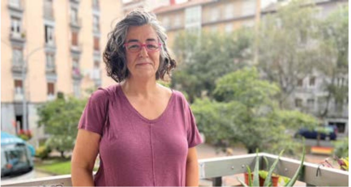
Gure herriko kazetariak gertutik jarraitu du Australia eta Zeelanda Berriko Mundiala. Pozik nabaritzen zaio bitzitakoarekin. EKHI BELAR

selekzio guztiek. Oraindik oztopo haundiak gainditu behar badituzte ere, teknikoki asko egin da aurrera eta ezin da ahaztu nutrizionista, psikologo, sendagile eta beste hainbat arlotako laguntza.