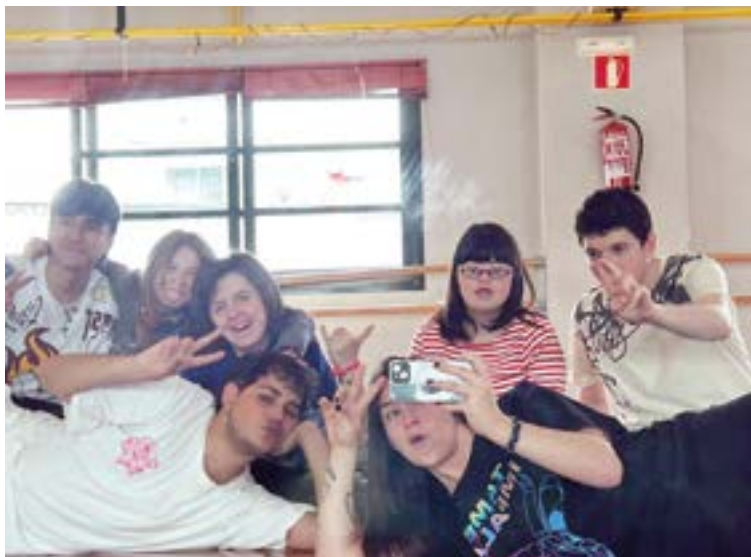
Domekako saioa Portalean izango da, 11:00etan hasi eta 13:00etan amaitzeko.