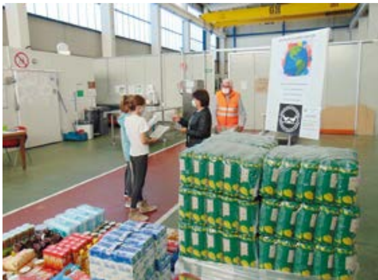
Iaz jasotako guztia Bergaran kokatuta dagoen Elikagaien Bankura joan zen.