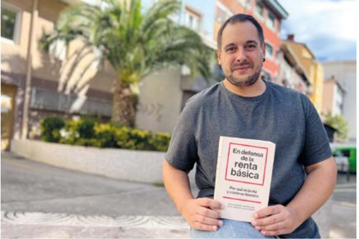
Oinarrizko errentaren aldeko argudioak modu zientifikoa islatzen saiatu dira liburuan. EKHI BELAR

mundu mailako ospea duena. Doktorea eta irakaslea da Bartzelonako Unibertsitatean, eta nire doktoretza tesiaren zuzendaria izan zen.