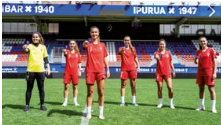
F Ligara igo den emakumezkoen taldeak Ipuruan jokatu du denboraldi honetan.

denboraldia du Euskal Ligan. Eta honek ere orain arte jokatu-tako partidu biak irabazi ditu (Ugaon 2-3 eta Unben 3-2 Anaitasunari) eta lidergoan kokatu da. Maila gazteagoetara jaitxita, kadeteetako Ohorezko Mailakoak 9-0 erraz irabazi zion Leioako Emakumeak taldeari azken jardunaldian.