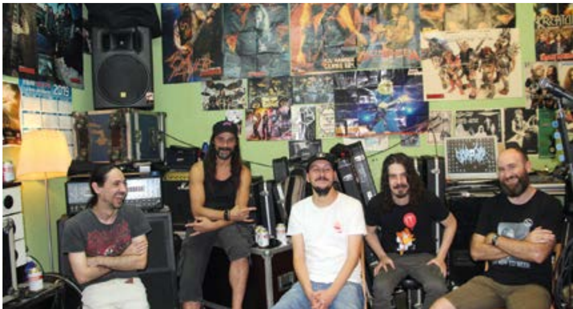
Talde gehienek urteak daramatzate Legarreko lokaletan eta beraien arteko harremana oso ona da.