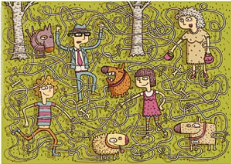
LOTUIZU JABE BAKOITZA BERE TXAKURRAREKIN