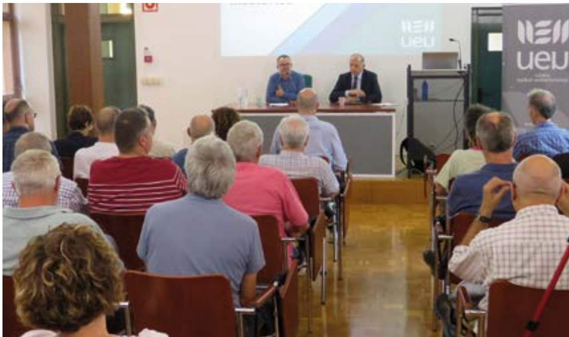
UEUren 2023/2024 ikasturtearen hasiera ekitaldia egin zen aurreko astean Eibarren, unibertsitate, euskalgintza, administrazio eta UEUko komunitateko kideen aurrean. UEU

ez fidatu, ondo begiratu behar dira testu horiek. Eta badaude beste arazo batzuk: bazterketaren arazoa (genero edo arrazari dagozkionak esaterako), desinformazioaren hedapen masiboa, enpleguak ezabatzeko aukera, gizartearen eraldaketa (hezkuntza, adibidez), energiaren kontsumo altua... Eta ezin dugu ahaztu botere kontzentrazioa: oso enpresa gutxiren esku dago informazioarekin zerikusia daukan teknologiarik ahaltsuena. Gauza guzti horiek hor daude. Eta horregatik dago suntsiketarena, entretenitzeko eta horrelako gauzetaz gutxiago hitz egiteko".