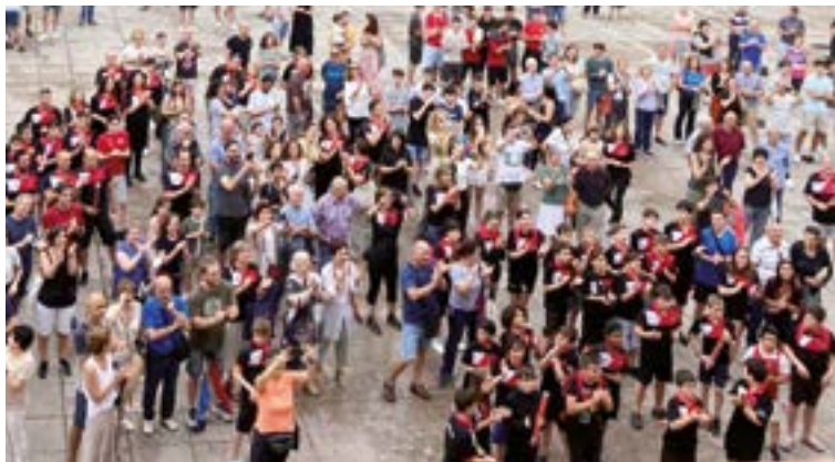
Urbatekoek omenaldia jaso zuten 2. Nazional mailara igotzerakoan.

Urbatetik jakinarazi digutenez, "maila berri horretako partiduak jokatzeko igerilekuak 25x12'5 me-