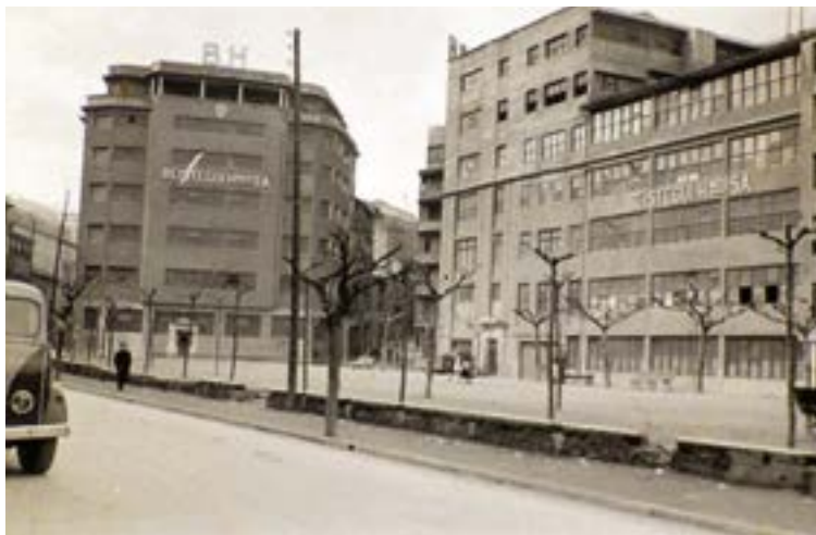
Beistegui Hermanos enpresak Urkizuko bi eraikinak erabili zituen bizikletak egiteko. Argazkian, eskuman, zabaldu zuten lehen lantegia daukazue. 1951n eraiki zuten bigarrena.