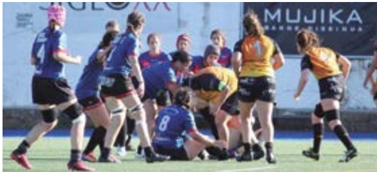
Eibar Rugby Taldekoek irabazi egin zuten Ordizian jokatu duen partiduan.

Maila bat beherago jokatzeko duen Burgosko Pinguinas taldea izan zuten aurkari eibartarrek Ordizian, eta armaginak 27-19 nagusitu ziren. Urriaren 8an izango dute FER Kopako hurrengo partidua, hor ere Ohorezko B Mailako beste baten aurka, Unben: Getxo. Multzoko laugarren taldea Eibar Rugby-ren maila berean dagoen A Coruñaiko CRAT da. Bestalde, Liga azaroaren 12an hasiko da, eibartarrek Unben Sevillako Universitario txapelduna hartuta.