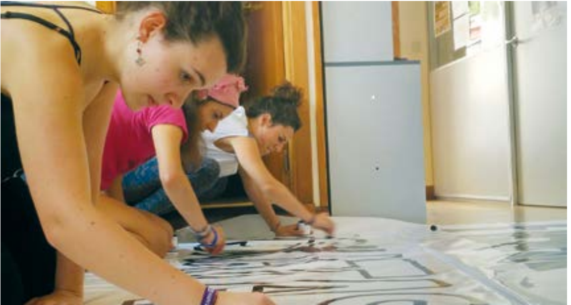
Naluak ekintza ugari egin ditu Eibar feministagoa bilakatzeko helburuarekin. NALUA

feministaren indar erakustaldi handien lekuko. Naluaren lehenengo martxoaren 8an, photocall bat jarri genuen Untzaga plazan. “Feministak gara” zioen, eta lelo horrekin argazkia ateratzera animatu nahi genituen herritarrak. Askok esan ziguten beraiek ez zutela feminismoarekin bat egiten, hitz hori ez zitzaizela gustatzen, eta nahiago zutela “berdintasuna”. Ariketa polita izan zen gaur egun iritziz aldatu duten feminis-