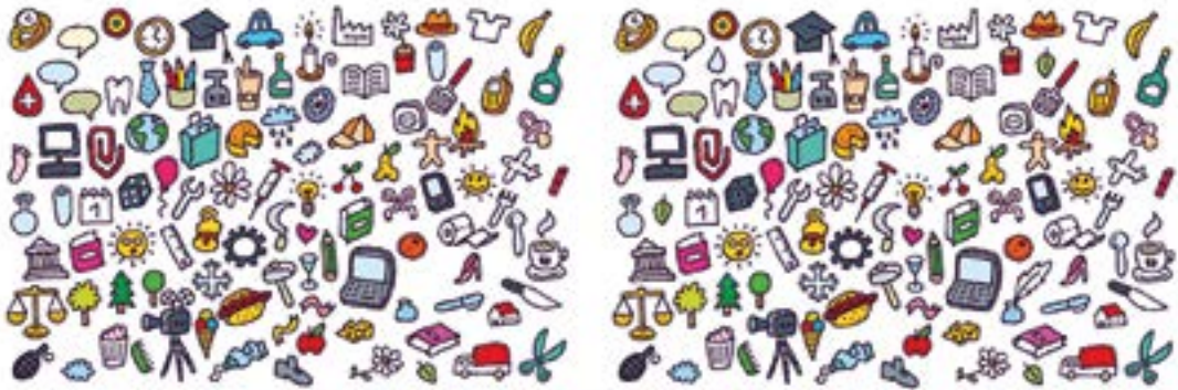
AURKITU 10 DESBERDINTASUNAK