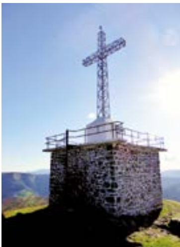
Irimotik pasatuko dira azken tartean.

Zapatutik domekarako gaueko ibilaldi berezi hori Elgoibarren hasi eta Urretxun amaituko da, tartean Irukurutzeta eta Irimoko gainak