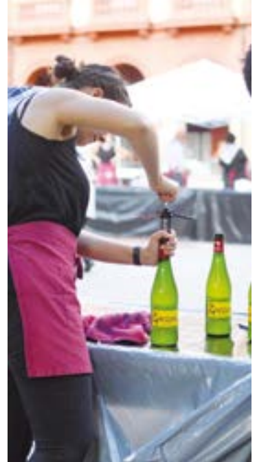
Bi milatik gora botila zabalduko dira urriaren 7ko Sagardo Egunean.

Goizeko saioa eguerdiko 12:00etan zabalduko da eta, txotx! egitearekin batera, euskaltzale-tasunari eskainitako saria jasoko