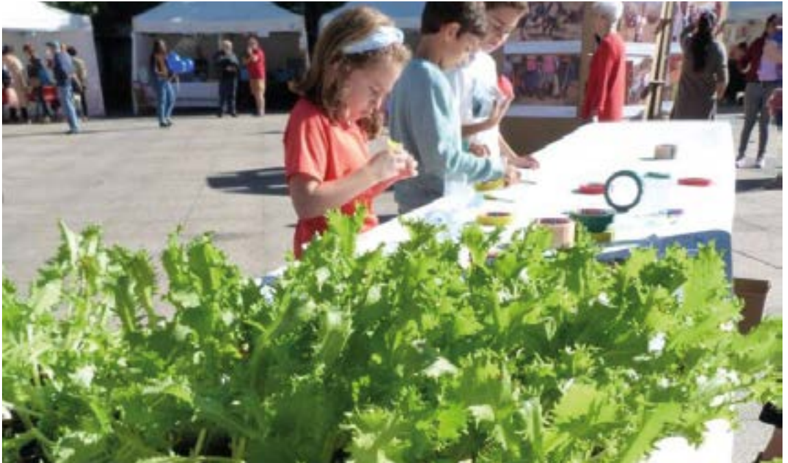
Musika, tailerrak, salmenta, errezetak... ekintza ugari prestatu dituzte domekarako. EGOAIZIA

Eskune egongo da, eta baita osasun emozionala eta gorputz terapiak garatzen dituen Sustrai zentroa ere. Guztira 20 proposamen ekarriko dizkigute Egoaizia eta Biolur elkarteko kideek, 10:30etik 14:30etara Untzagan egingo den azokan.