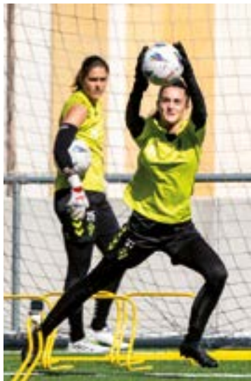
Atezainen entrenamendu saioa.