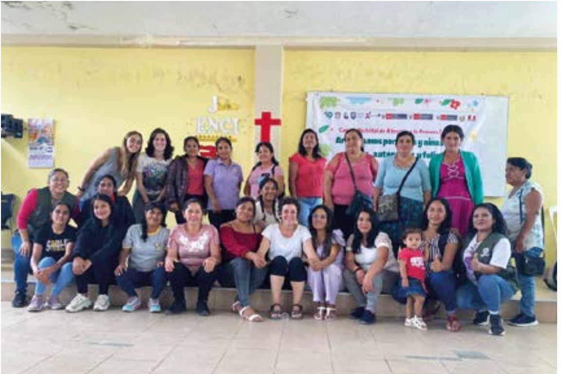
Helenek (goian ezkerrean) eta Zaloak (erdian) Piurako (Peru) errealitatea gertutik bizitzeko aukera izan dute.

da. Hau da, horren aurretik babes bat egon behar da eta horren falta handia somatu dugu. Emakumeen eta umeen egoera oso gogorra da, ez dute babesik.