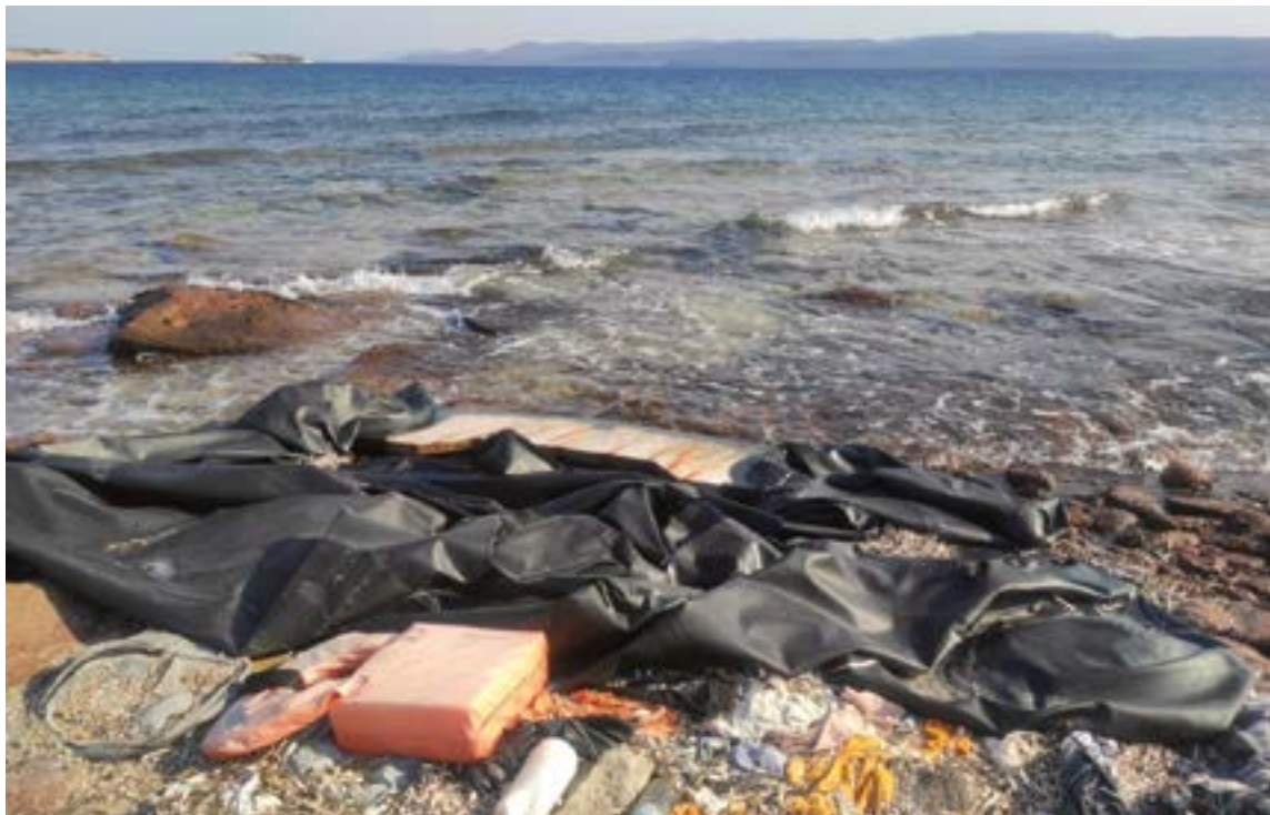
Lesboseko hondartzetan iheslarien arrastoa nabaria da. Ahal duten moduan hartzen dute lurra, behin kostaldea harrapatuta.