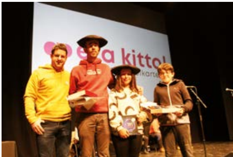
Irabazleek, urterokoari jarraituz, San Andres Bertso Jaialdian jasoko dituzte sariak.

Urriaren 3an hasi eta azaroaren 3ra arte luzatuko da San Andres bertso-paper lehiaketara lanak entregatzeko epea. Maila bi izango ditu aurten ere: 16 urtetik gorakoen mailan Euskal Herri osoko lanak aurkeztu ahal izago dira. Gaia eta doinuak libreak izango dira, eta lau puntu edo gehiagoko 6 bertso gutxienez eta gehienez 10 aurkeztuko dira. Lanaren 3 kopia entregatuko dira gaitzizenarekin sinatuta, eta gutunazal itxian gaitzizena identifikatzeko datuak (izen-abizenak, bizilekua eta telefonoa). Bertsoak postaz bidaliko dira edo norberak eraman ditzake, beranduenez azaroaren 3rako, ondoko helbidera:... eta kitto! Euskara Elkarte. Urkizu 11 solairuartea. 20600 Eibar. 16 urtetik beherakoen maila, berriz, Eibarko ikasleei zuzenduta dago.