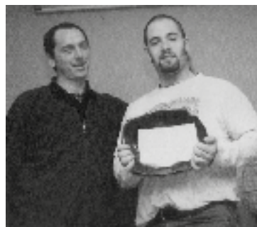
Urtzik errugbi modalitateko saria jaso zuen Eibarko Kirol Sarietako 3. edizioan

diñon lanean ari zela hildako errugbi jokalaria-ohiak eta bere heriotzak samin handia sortu du errugbi-zaleen eta, orokorrean, eibartarren artean.