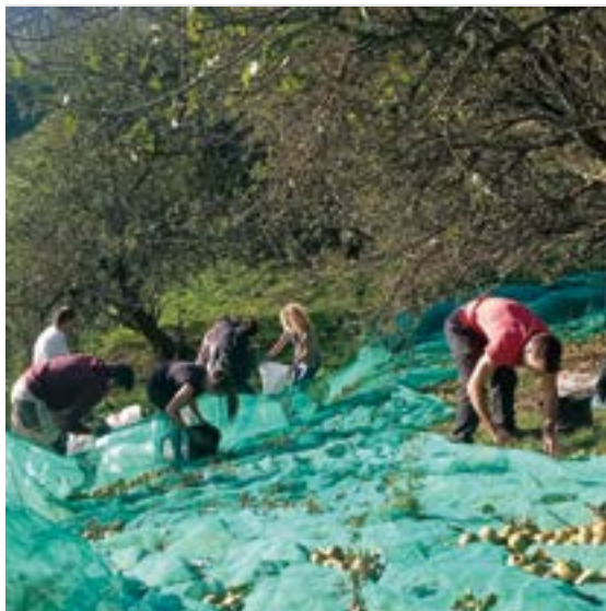
Hasteko, sagarrak batu zituzten parte-hartzaileek. ITZAMNA

Txikitzea, ahal den heinean, gauez egiten da, sagar pastak erreposatu eta zukua aska dezan, hurrengo egunera arte, prentsatzeko-prozesua hasten den arte.