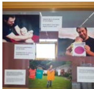
"Zer gertatzen zaigu gizonoi? Maskulinitatearen erronkak" erakusketa egongo da asteburu honetan.