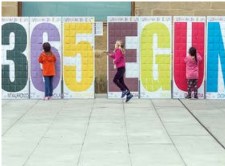
Donostian orain dela urte batzuk egindako ekimenaren antzekoa egingo da Eibarren.