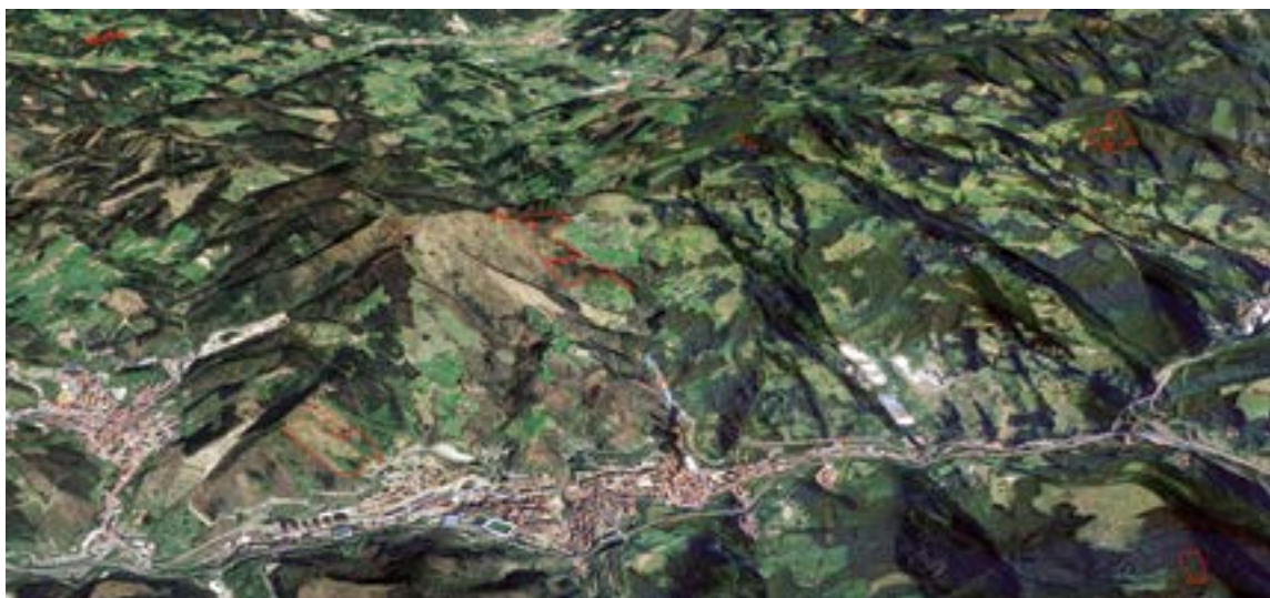
Gorri markatutako gunek dira Udalak erositako lursailak, guztira 23'5 hektareako azalera hartzen dutenak.

Udalak 173.324,21 euro inbertitu ditu baserria eta lursailak erosteko, eta, horretarako, Gipuzkoako Foru Aldundiko Ingurumen eta Obra Hidraulikoetako Departamentuaren 35.000 euroko dirulaguntza jaso du. Halaber, beste dirulaguntza bat eskatu dio Eusko Jaurlaritzari baso autoktonoa berreskuratzeko proiektu honetarako.