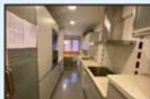
Urkizu dorreak Ref. 199

75 m 2 . 3 logela. Eguzkitsua. Bizitzera sartzeko. Igogailua. 185.000€