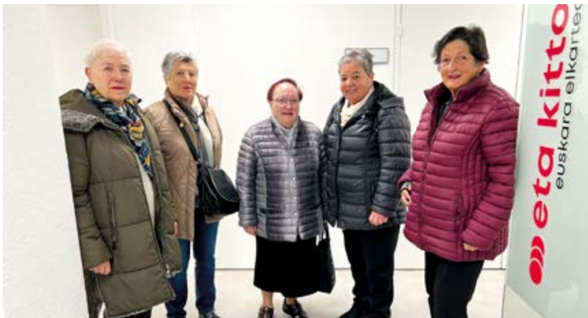
Gurera etorri ziren Altzoako kideak. EKHIBELAR

arazoak ikusten, baina arazoak hor daude eta elkarteok gehiago mugitu beharko ginateke”.