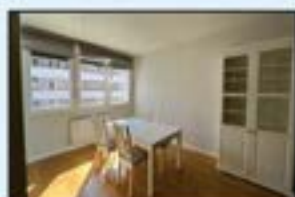
Legarre ingurua Ref. 176

3 logela. Berriztua. Igogailua. 179.000€