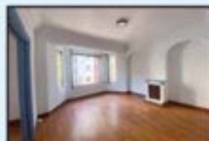
J. Etxeberria Ref. 175

70 m 2 . Balkoiarekin. Berritzeko proposamena. Igogailua. 149.000€