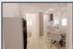
Bista Eder Ref. 246

79 m 2 . 3 logela. Berriztua. Balkoiarekin. Bistak. Igogailua. 215.000€