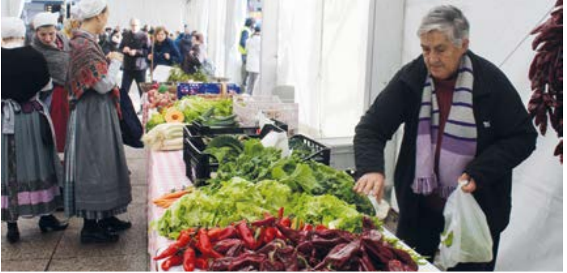
San Andres Azokaren 44. edizioan parte hartuko duten 45 baserriar eta ekoizleen postuak bi karpatan banatuko dituzte: fruta eta barazkiak Untzagan, udaletxeko plazan egongo dira, eta gainerakoak Txaltxa Zelaian. SILBIA HERNANDEZ

da, 11:00etatik aurrera, Untzagan. Aurten 35 bikotek hartuko dute parte.