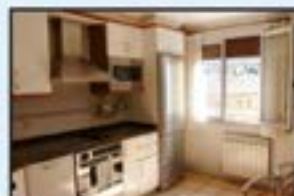
San Kristobal Ref. 196

Eguzkitsua eta zabala. Dotorea. Guztiz jantzita. Igogailua. 189.000€