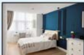
Urkizu ingurua Ref. 204

Adosatua. Lorategi eta baratza. 4 logela. 2 komun. Kontsultatu