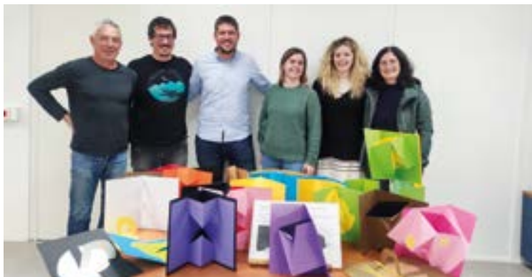
Oteizaren tailerreko taldea euren lanekin.

kitto!-tik. Ikastaroa elkartearen egotzian egingo da 18:30etik 21:30era. Izena emateko deitu 943200918 telefonora edo mezua idatzi elkarte@etakitto.eus helbidera (5€). Bestetik, joan den martitzenean, Oteiza mai-sua gogoratu tailerra egin zen ...eta kitto!-n. Parte-hartzaileek XX. mendeko euskal artistarik esanguratsuenetarikoa izan zenaren lana ezagutu zuten, hain ospetsuak diren Kutxa Hutsen antzeko eskulturak sortuz.