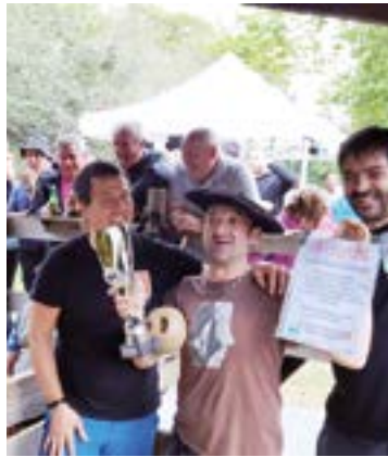
Sergiok badaki lehendik ere zer den tiraldiak irabaztea.

Bikoteka ere podiumean izan ziren Asola Berriko ordezkariak: Bit-