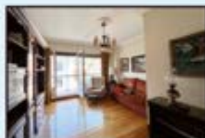
San Juan Ref. 172

85 m 2 . 3 logela. Altua, balkoiarekin. Argitsua eta eguzkitsua. 255.000€