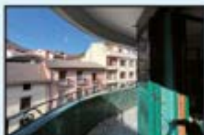
Ibarkurutze Ref. 229

3 logela. Eguzkitsua. Bistak. Balkoiarekin. Igogailua. 145.000€