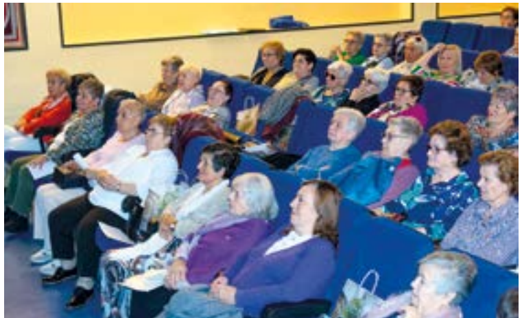
Joan den zapatuan FEVI-ren urteko batzarrean egon ziren Altzoakoak. YANIRE SAGREDO