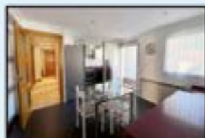
Ipurua ingurua Ref. 129

85 m 2 . 3 logela. Altua, balkoiarekin. Argitsua eta eguzkitsua. 255.000€