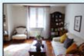
Pagaegi Ref. 139

Eskaintza zabala lokal, garaje eta trasteroetan. Kontsultatu