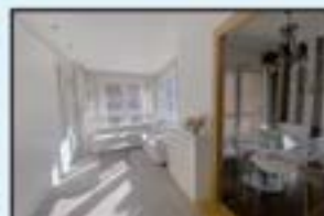
F. Calbeton Ref. 170

Pisu altua. Terrazarekin. Partekatze zona berriztua. 390.000€