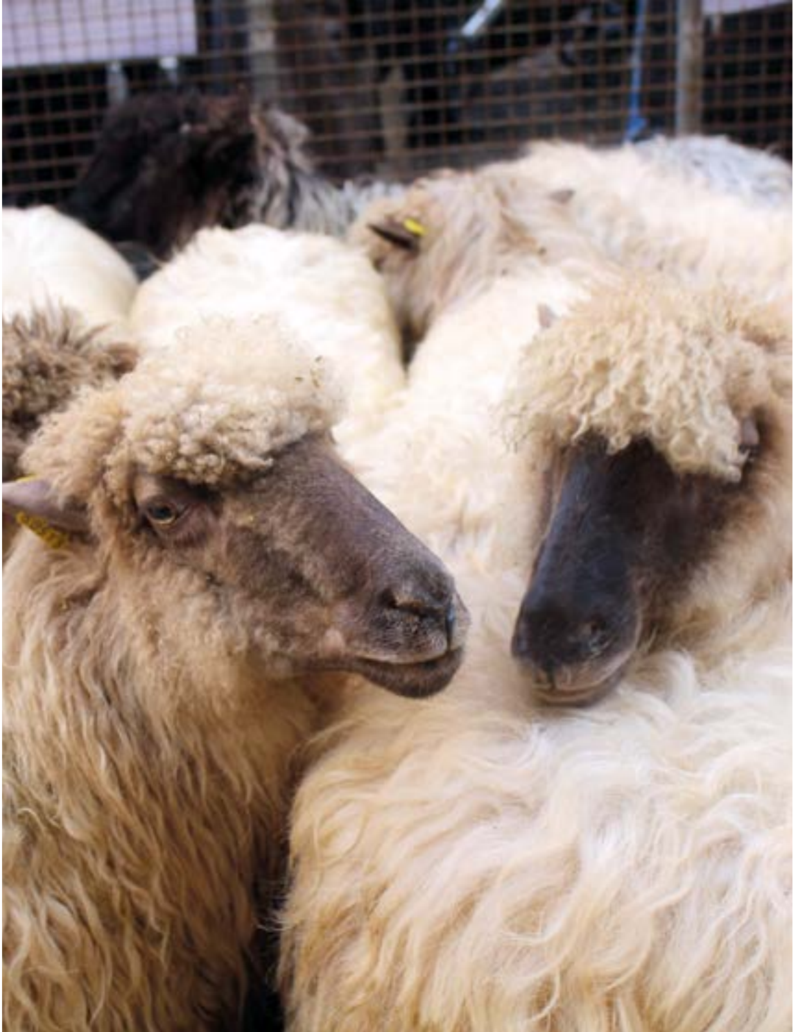
Hónek kaletarrok sano egongo dittuk/dittun? SILBIAHERNANDEZ