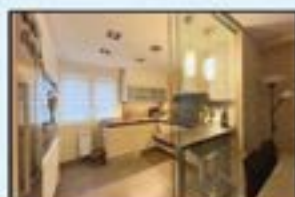
Ipurua ingurua Ref. 171

101 m 2 . Erdigunean. Pisu ederra balkoiarekin. 250.000€