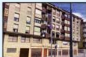
Amaña Ref. 249

2 logela. Balkoiarekin. Pisu altua eta eguzkitsua. 118.000€