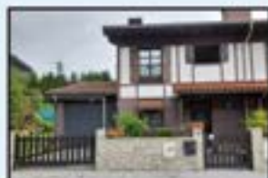
Elgeta Ref. 145

3 logela. 2 komun. Igogailua. Erostea aukera. 170.000€