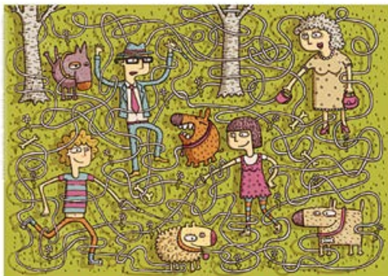
LOTUIZU JABE BAKOITZA BERE TXAKURRAREKIN