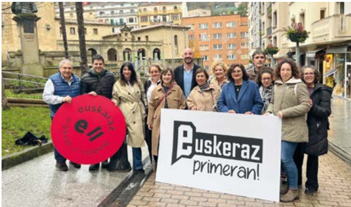
Eibarren zerbitzuen sektorean euskararen erabilera bultzatzeko helburua duen "Euskeraz Primeran!" egitasmoa berrikuntzekin dator 2024ra begira. EKHI BELAR

Hauexek dira aipatutako markak eskuratzeko irizpideak: