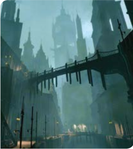
Mundu zirrargaria asmatu du Zarrauk 'The silent swan' bideojokoan.