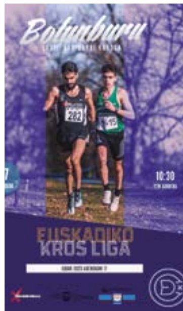
Aurtengo edizioako kartelaren irudia.

Aipatutako bederatzi probak honakoak dira, hasiera ordua eta distantziari jarraituz: 10:15ean, emakumezko sub 16 eta mastezkoak (3.400 metro); 10:40an, gizonezko sub 16 eta mastezkoak (3.400 metro); 11:00etan, sub 18 eta sub 20 (4.400 m.); 11:30ean, absolutu eta sub 23 (8.200 m.); 12:10ean, infantil neskek (2.400