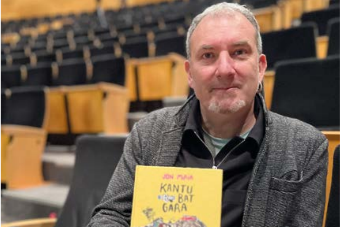
Urtarrilaren 12an zuzeneko ikuskizuna eskainiko du Coliseo antzokian. EKHI BELAR