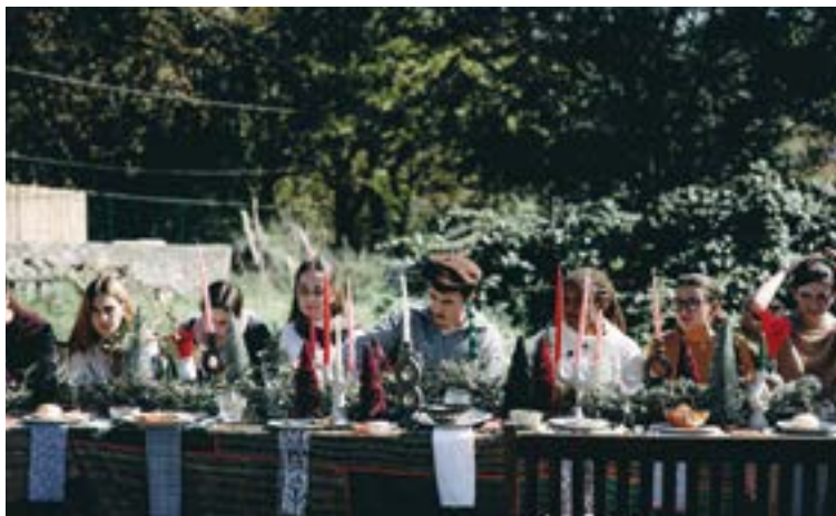
Eibarko Koro Gazteak bideoklipa grabatu du diskoko abesti batekin. MAITANE CAMPOS

>>> Gabon kantak ardatz hartuta, abeslari gazteek proiektu oso bat garatu dute, maitasun eta dedikazio handiz, formatu ezberdinetan