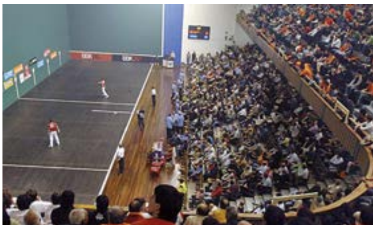
Ohikoari jarraituta, Astelena frontoiak irudi bikaina eskaini zuen Aspek antolatutako gabon inguruko hiru jaialdietan: abenduaren 25ean eta urtarrilaren 1ean eta 6an.