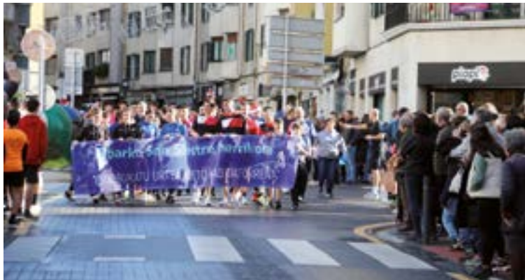
San Silbestre eguerdiz jokatu zen bigarren bezala, Kirol Sarien ekitaldia amaitu eta jarraian, Errebaletik abiatuta Eibarko kaleetatik adin guztietakoekin parte-hartzearekin.