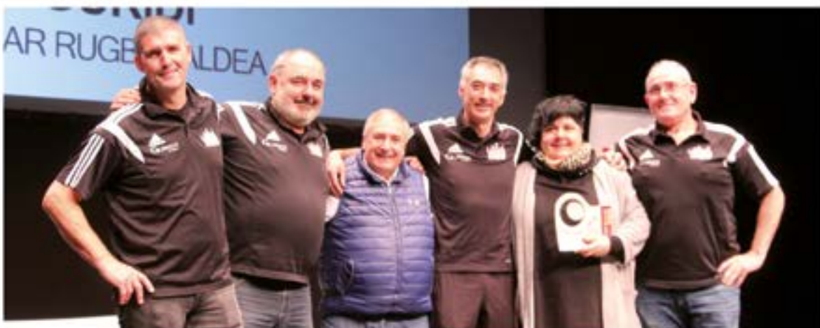
Guridi Rugby Taberna SUSTAPENA