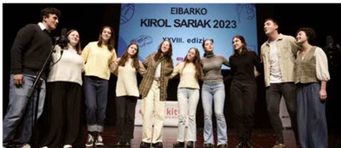
Eibarko Koro Gazteak ukitu berezia eman zion ekitaldiari "Neguko ahotsak" diskoko abestiekin.