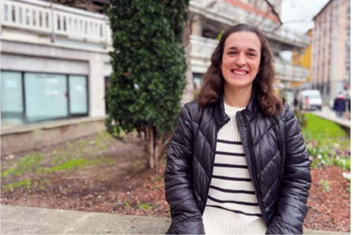
Maialen Ortek Gabonak Eibarren pasa ditu Kanariar Uharteetan ikerketa hasi aurretik.

Nebulosen argazkiak asko gustatzen zaizkit, txikitatik, baina nebulosak ikertzean haien konposizioa eta bestelako gauzak ere asko gustatu zitzaizkidan eta arlo horretan aritzea erabaki nuen.