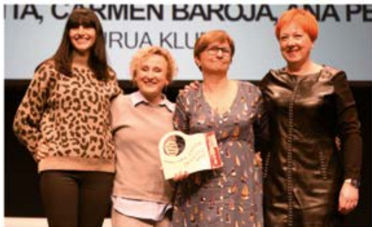
Ipurua Klubeko Zuzendaritza GIMNASIA ERRITMIKOA