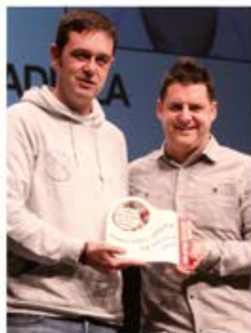
Iker Badiola TIRO OLINPIKOA