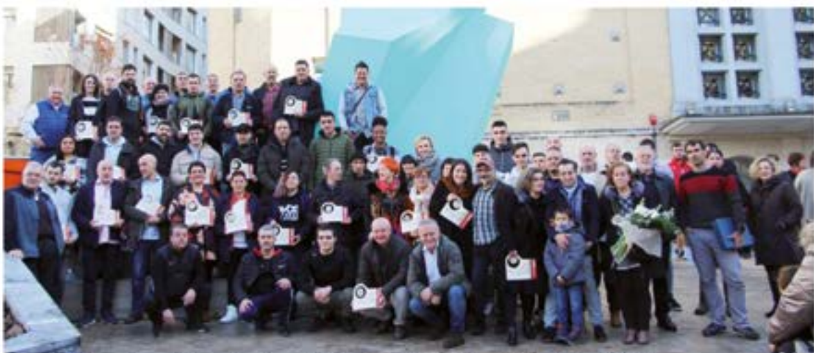
Saridun eta sari-banatzailleen talde-argazkia, Gabon Zaharreko ekitaldiaren amaieran.