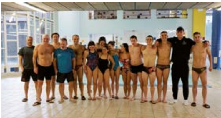
Kaleetako San Silbestrearekin batera, aurretik izan zen Uretakoa ere, urtero bezala.