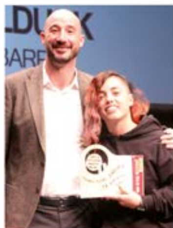
Arima Galduak ERREKONozIMENDUA