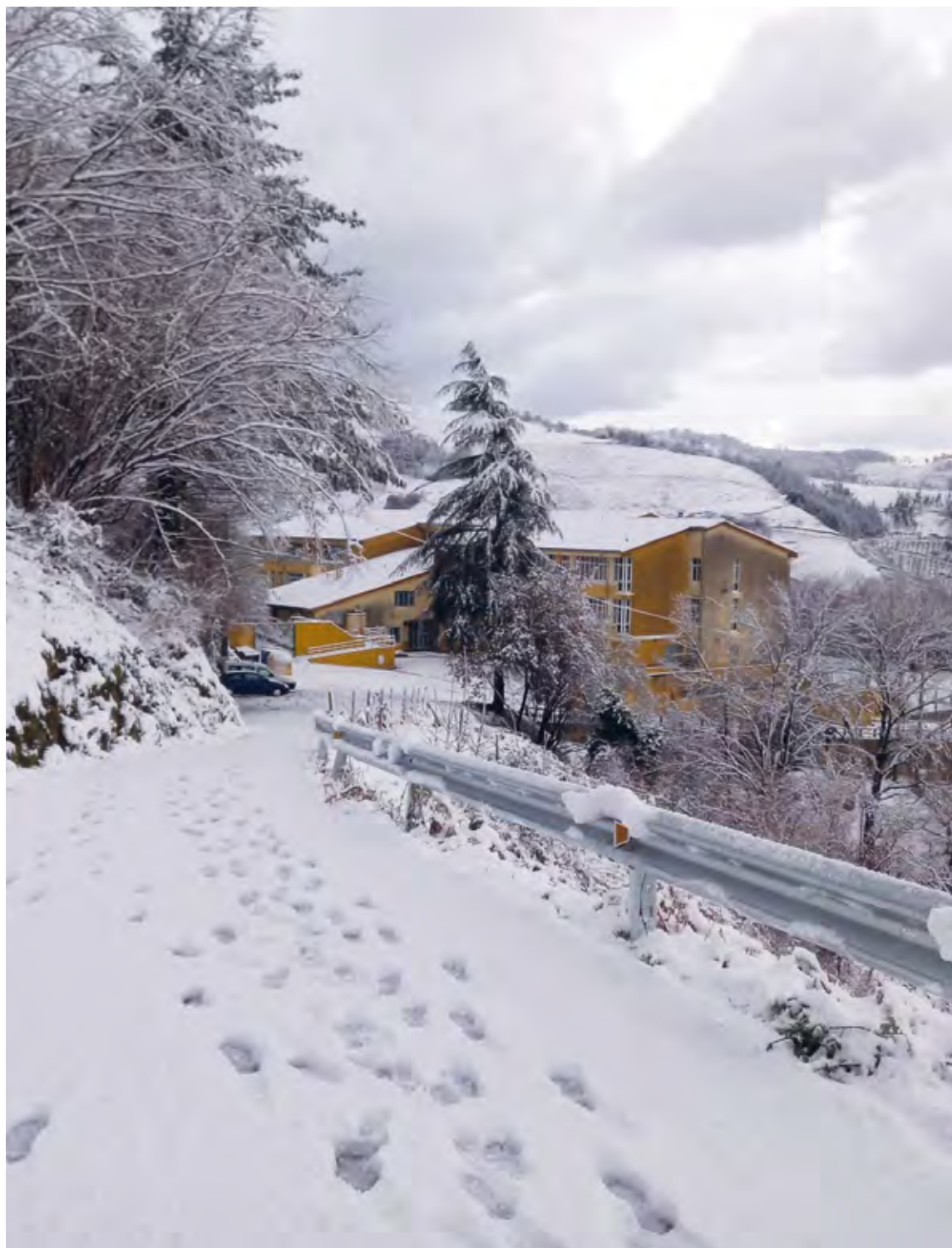
Gutxitan ikusten den erakargarritasuna. AITZOLARRILAGA