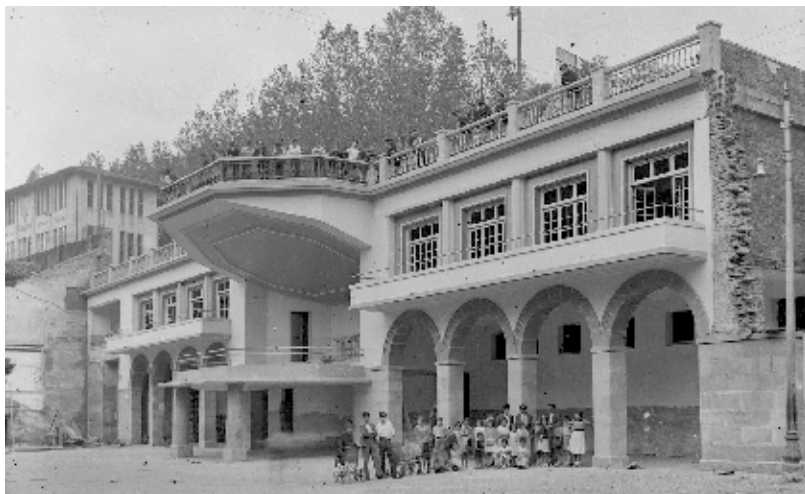
Untzaga plazako musika kiosko berria gerra aurretik, 1932an.