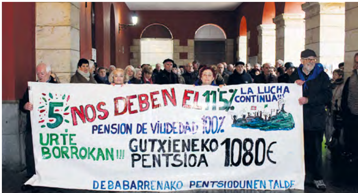
Astelehenetan Untzagan egiten dituzten elkarretaratzeetan 120 eta 150 lagun inguru elkartzen dira astero. SILBIAHERNANDEZ

Hala ere, asteleheneko elkarretaratzeetan bildutakoek bazuten zer ospatu: “Euskal Herriko Pentsiodunen Mugimenduak lortutakoa ospatzen dugu: 2013ko PPre reformaren PEIa (0,25) indargabetu dugu. Pentsioen Sistema Publikoa guztiz bideragarria dela frogatu dugu, estatuak bere gain hartzen baditu Gizarte Segurantzari dagozkion kudeaketan sartu arren, Estatuko Aurrekontu Orokorrekin ordaintzekoak direnak. Iraunkortasun Faktorea indargabetu da, eta gure pentsioak erdira murriztu nahi zituzten erabaki berriak hartzea saihestu dugu”.