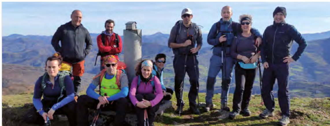
Aurreko zapatuan egindako "Herri Txikiak"-en lehen etapak oso erantzun ona izan zuen. Hilaren 28an bigarren etapa duzue zain.