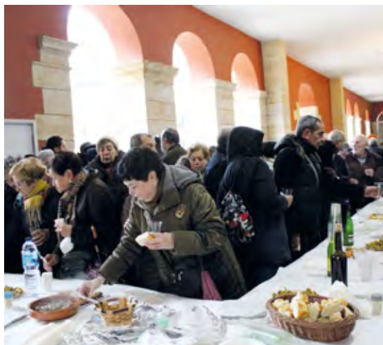
Asteroko aldarrikapenek pintxo batzuk jan eta zerbait edateko tarteari tokia egin zioten astelehenean.