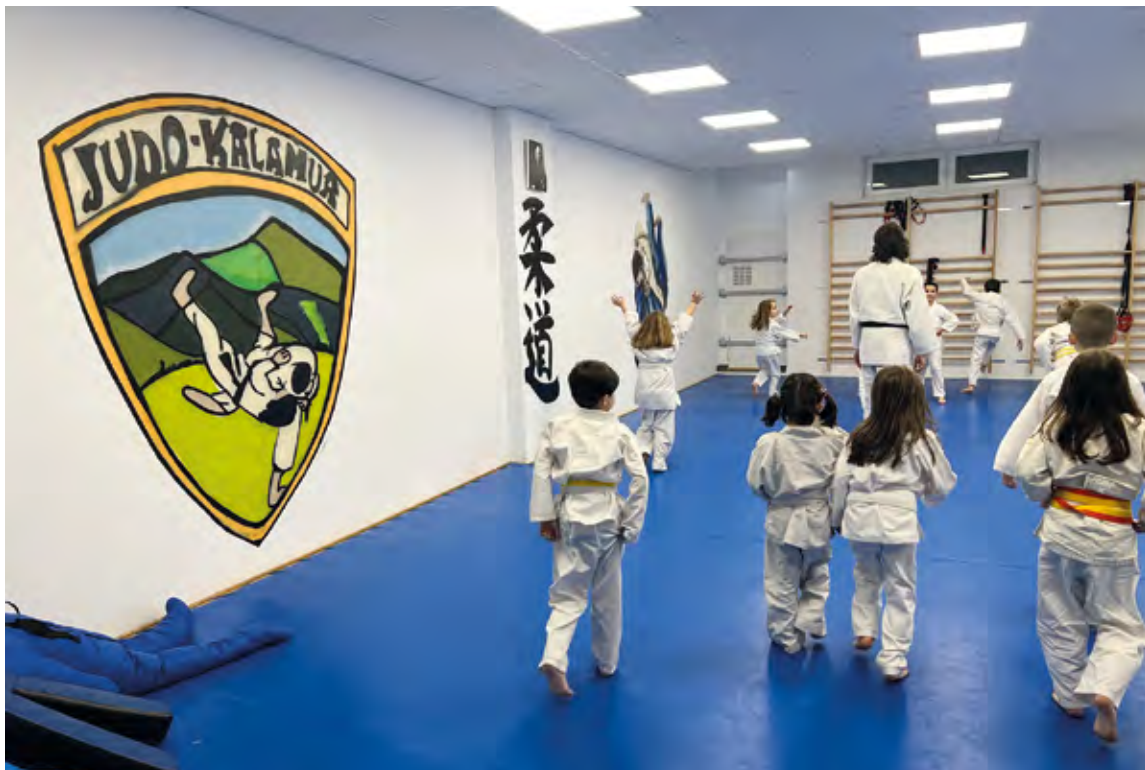
Txirio-kalen dago Kalamua Judo Taldearen egoitza. EKHI BELAR

Izan ere, kirola izateaz gain, judoak badu beste alderdi kultural bat edo, zuk esan bezala, balore jakin batzuen alderdi bat.