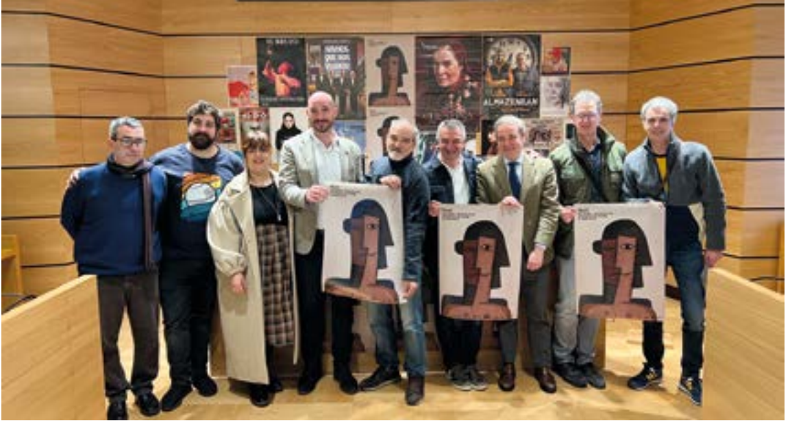
Golden Apple Quartet taldeko kideak egon ziren martitzeneko aurkezpenean. EKHI BELAR

da ikuskizun horretan eta, Gonzalezen ustez, “zoragarri dago”.