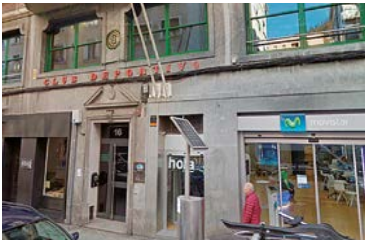
1952tik T. Etxebarria kalean du bere egoitza Klub Deportiboak. Aurretik, baina, Maria Angelako lokaletik Elorzatarren etxeko kafetegira “bidaiaitu” zuen eta, handik, Calbeton kaleko Tupi tabernara gaur egungo “bere etxera” iritsi aurretik.