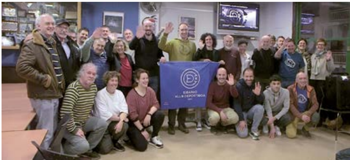
Aurreko asteko eguaztenezan egindako aurkezpen-ekitaldian klubaren 13 batzordeetako ordezkariak izan ziren, beste batzuen artean.