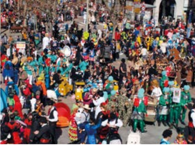
Herriari kolorea ematen dio kuadrillen kalejirak. EIBARKO UDALA