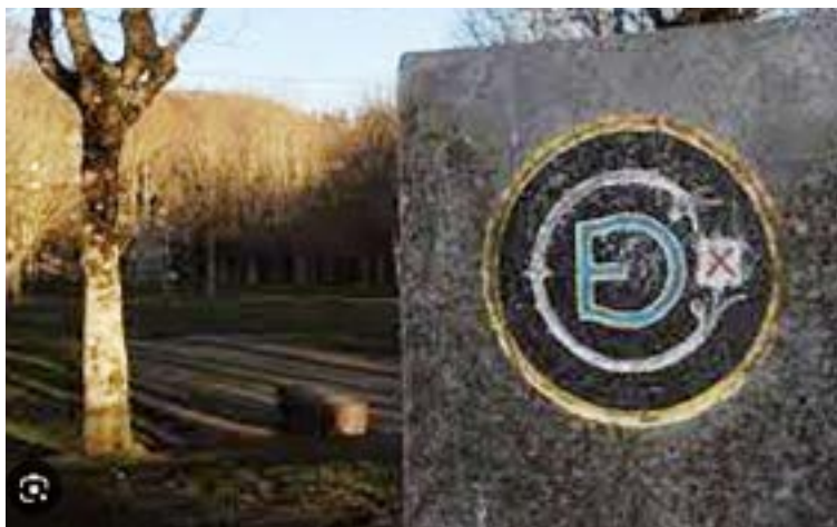
Argazkilaritza, Atletismoa, Dantza (Kezka), Eskia, Espeleologia, Kultura, Mendia, Pilota, Urpekaritza, Xakea, Txirrindularitza, Squasha eta Aldizkaria dira klubeko 13 batzordeak.