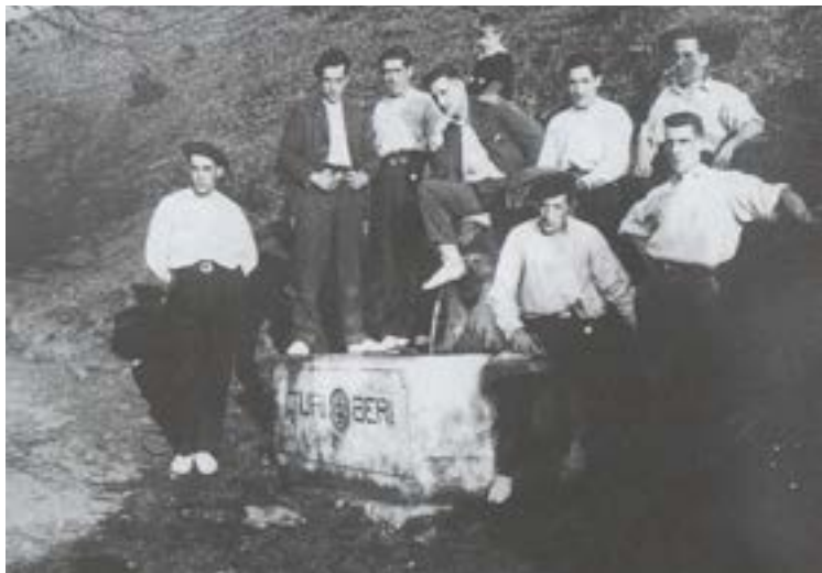
Kalamuako iturria da Klub Deportiboak egindakoetako bat.