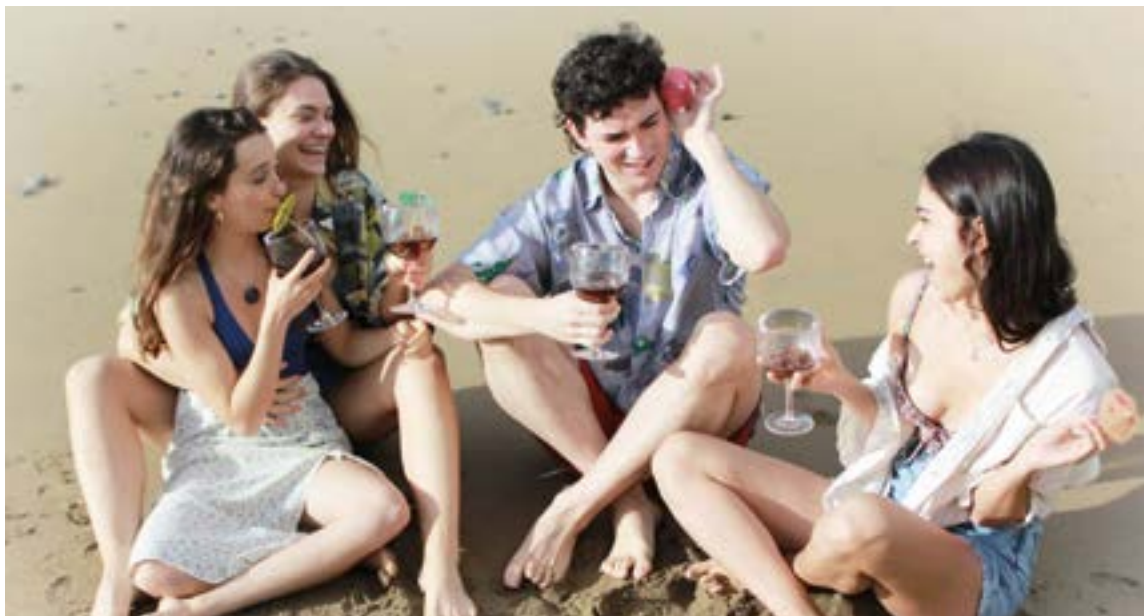
Gazteak antzerkira erakartzeko ahalegina egingo dute 'Bihar arte soilik' antzezlanarekin.