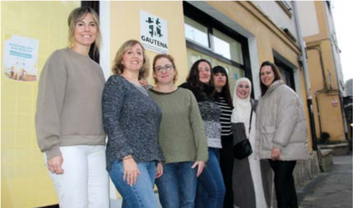
Debabarreneko familien artean antolatu dute otsailaren 1eko ekitaldia. ANAIAZPURUA

te, ume oso txikiak dituzten familiak egongo dira, familiaren ikuspegia landuko du bikote batek, 24 urteko semea duen ama batek bere esperientziak azalduko ditu, ahozko hizkuntzarik gabeko haur autistei eta haien errealitateari buruz arituko da ama bat, anaia baten testigantza egongo da eta, hori guztiaz gain, emakume autista batek bere bizipenak azalduko ditu.