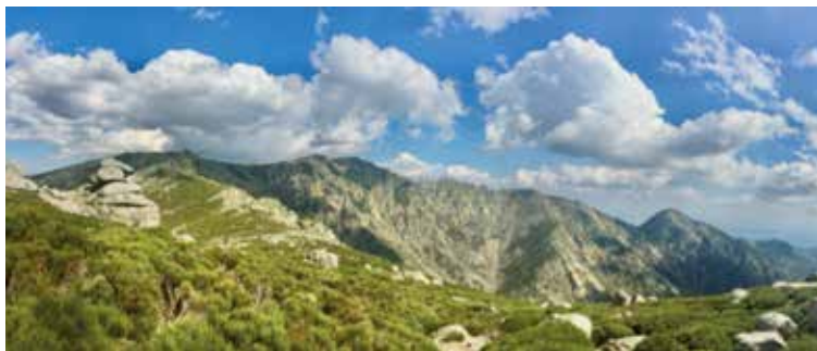
Bost eguneko txangoan La Mira tontorra ere igotzeko asmoa dute Deporrek.

Aste Santu honetarako Deporrek bost eguneko txangoa prestatu du Gredosko mendikatera eta Tietar Haranera, hilaren 28an Eguen Santuz irten, eta apirilaren 1ean astelehenez itzultzeko. Ibilaldiak Avilako probintzian egingo dira, nagusiki Gredoseko mendikatearen hegoaldeko isuri aldean. Gailurretara igo nahi dutenek Alto de la Hoya (2.134 m), Pico Torozo (2.021 m), La Fría (1.983 m), La Mira (2.343 m.)