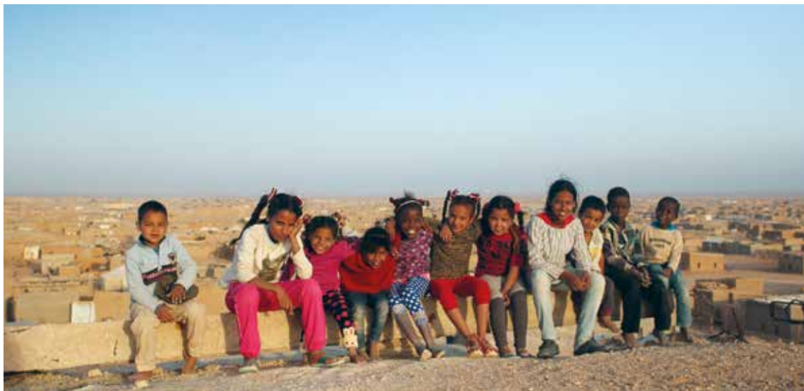
Uda errefuxiatuen kanpamenduetan bizi diren baldintza gogorretatik urrun pasatzeko aukera eman nahi zaie haurrei. OPORRAK BAKEAN