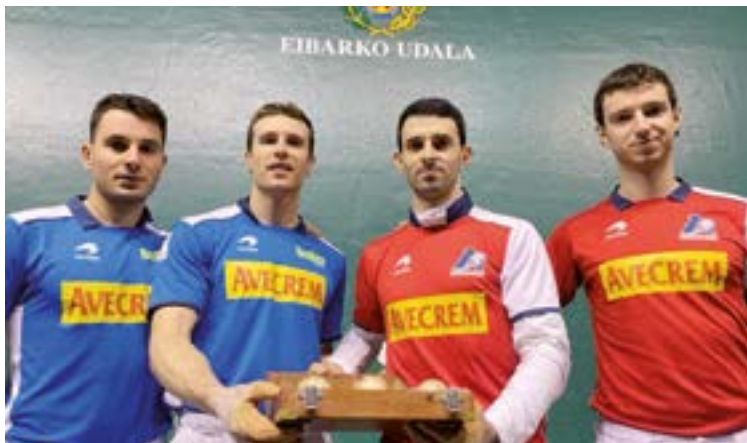
Binakako txapelketako bikoteak eguazteneko Astelenan egindako pilota-aukeraketan.