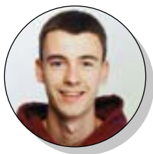
SUGOI ETXARRI • EHE