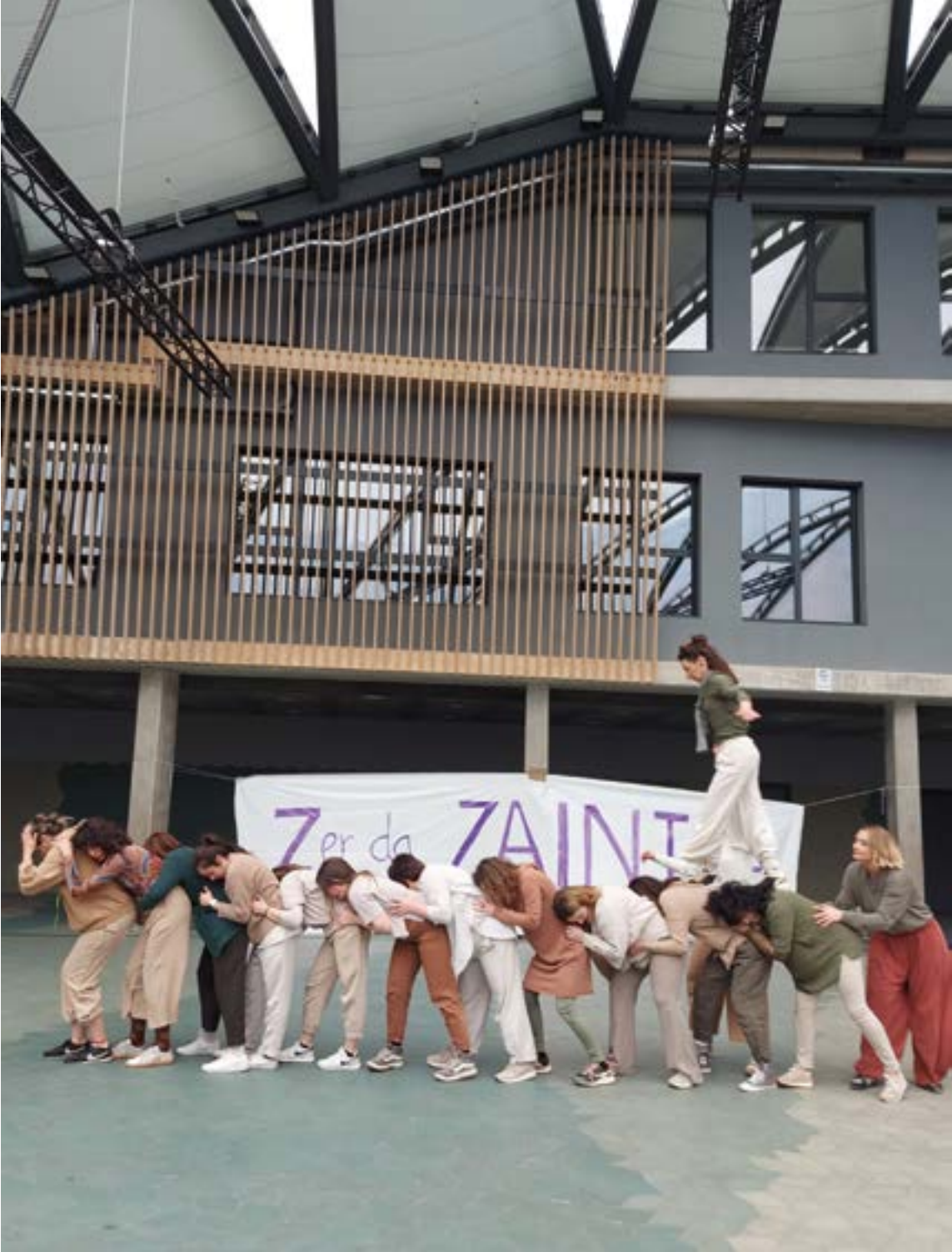
Norbera zaindu, elkar zaindu... bidea errazteko. BAKARNEEJALDE