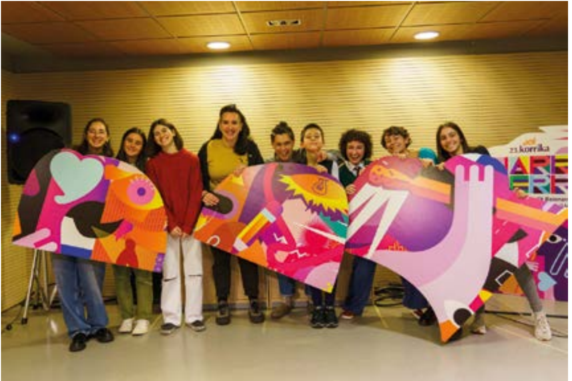
Musika Eskolako ikasleekin batera aurkeztu zuen Mursegok Korrikaren abestia. KORRIKA

gauza bera egitea eta 'reberrekin' eta gauza teknikoekin jolastea, soinu berezi bat sortzeko. 60. hamarkadako doinu horiek izan ziren gure erreferenteak, 'pop-barroko' hori. Horrela, nire lan egiteko modua irudikatzen da. Izan ere, pop kantu xumea moldaketa klasikoekin uztartzen da. Azken batean mundu klasikitik nator eta zinerako musika lantzen ohituta nago, nahiz eta horretan ez daramadan denbora gehiegi.