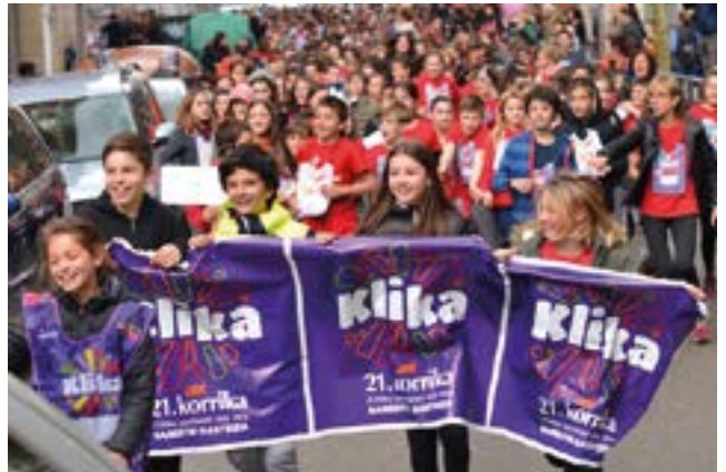
Korrika pasatu baino egun bat lehenago egingo da Korrika Txikia Eibarko kaleetan zehar. EKHI BELAR

Korrikaren inguruko ekintzekin amaitzeko, zer hoberik Baionan Korrikaren amaiera ikustea baino? Horretarako, autobusak jarriko dituzte Ego Gainetik. 09:00etan irtengo dira eta joan-etorriko bidaiak 15 euroko prezioa du. Izena emateko 688 74 66 34 zenbakira WhatsApp bitartez mezua bidali beharko da.