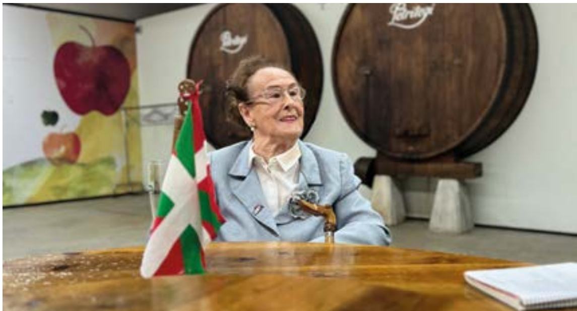
Kontxa Laspiurrek Korrikaren lekukoa eramango du Ipuruan. YANIRE SAGREDO

klaseak ematen. Berak Jose Antonio izeneko nafar bat gogoratzen du: “Harek ikasi zeban fenomeno, eta Eibarren gelditu zan eta taillarra ipiñi zeban. Amañan daka taillarra”.