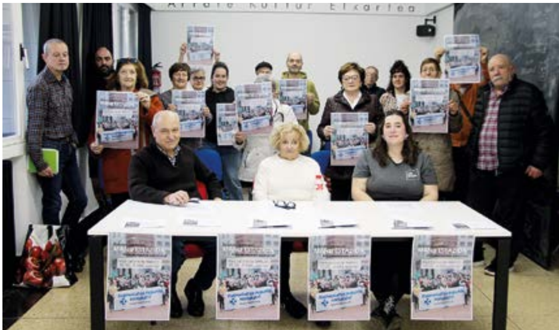
Debabarreneko pentsiodunen mugimenduaren eta Agijupens, Duintasuna, Ernai eta Matraka elkarteetako ordezkariak agerraldia egin zuten eguaztenean, eskualdeko herritar guztiak mobilizatuzera deitzeko. SILBIA HERNANDEZ

izugarri luzatzea ekarri du. Ezin dugu onartu zerrenda horiek murriztea, zerbitzuen pribatizazioaren kontura. Osasuna ez da merkatu-ondasun bat, eskubide unibertsala baizik. Norabide aldaketa horretan, orain arte egin diren pribatizazio guztiak geldiaraztea eta lehengoraztea eskatzen dugu”.